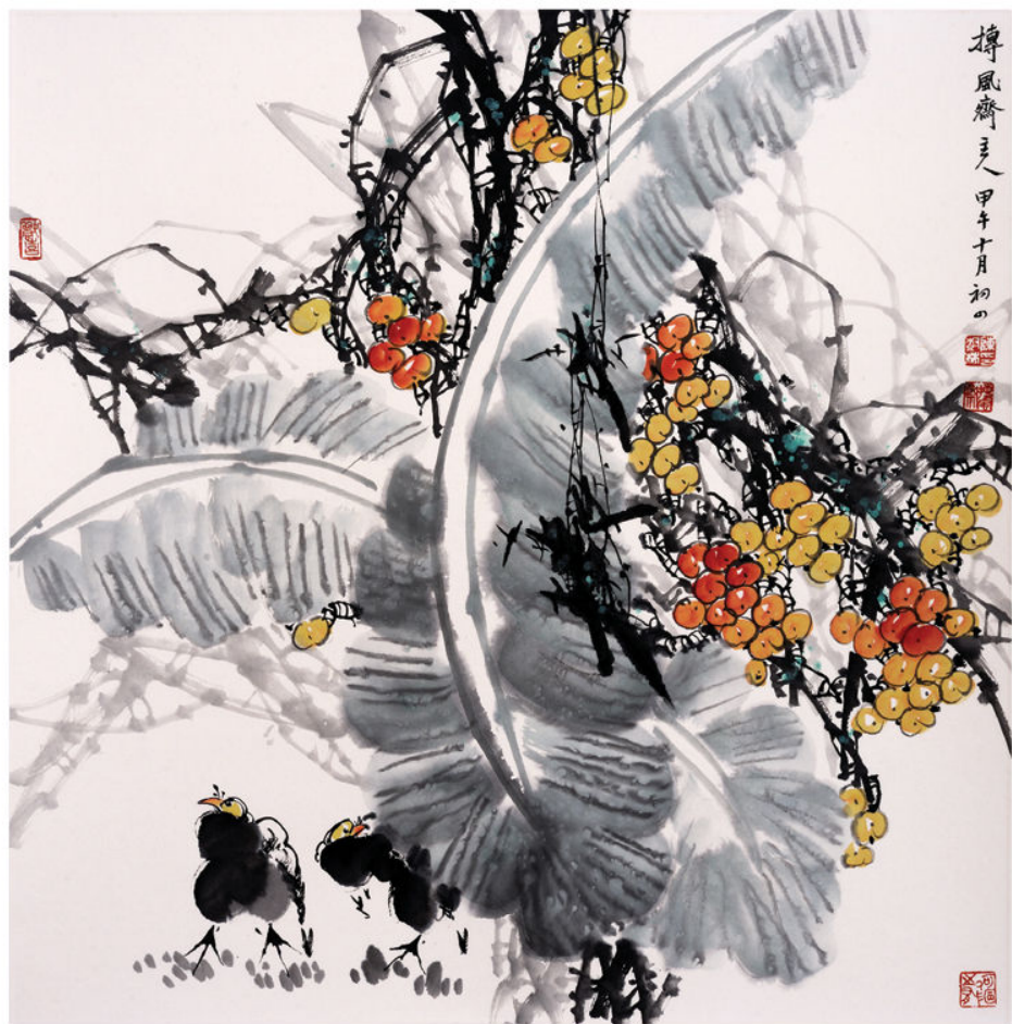
作品：芭蕉叶下（国画） 尺寸：68cm×68cm 作者：陈树林