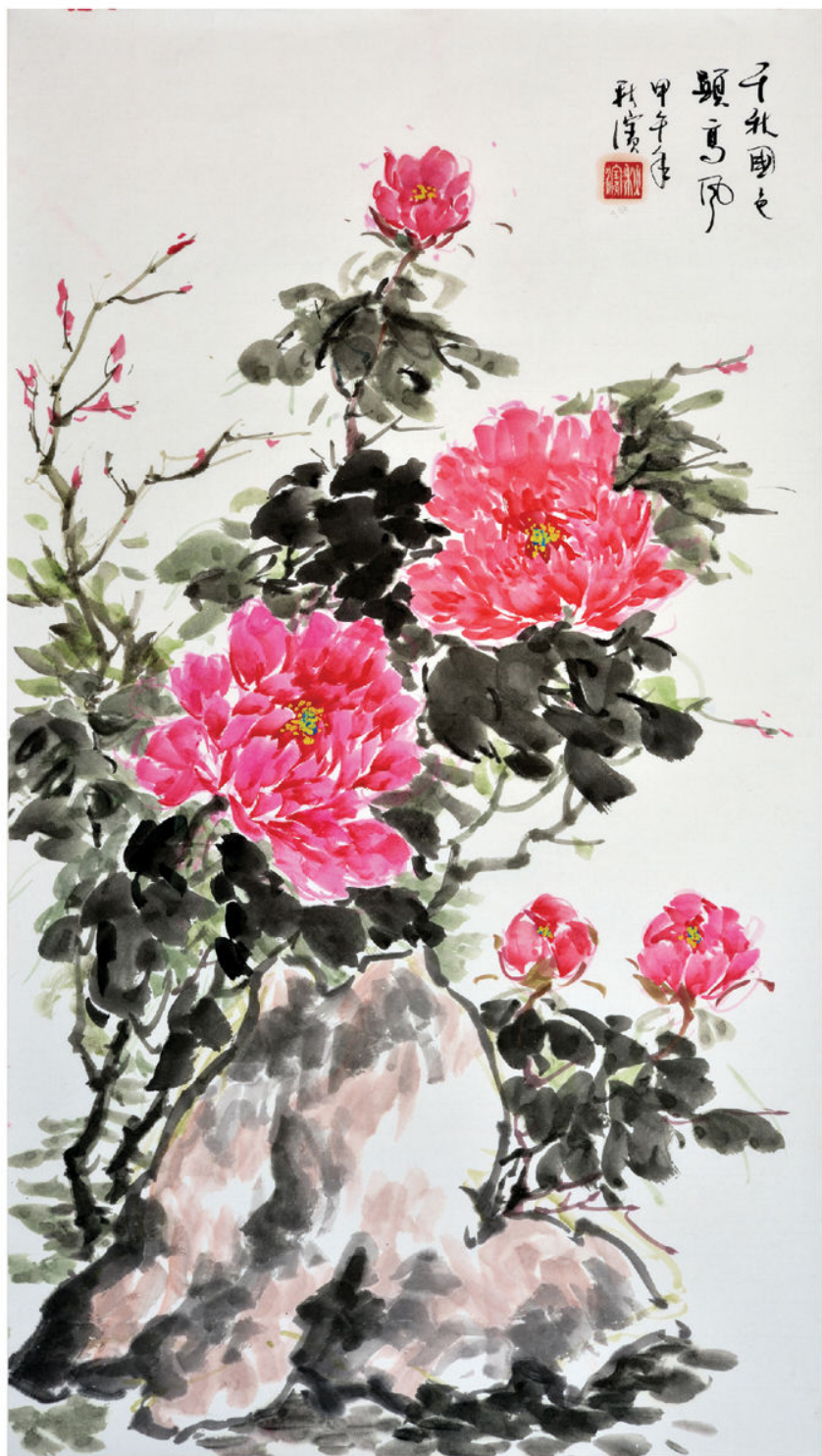
作品：千秋国色显高风（国画）