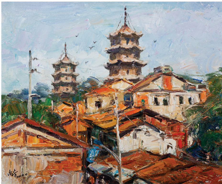
作品：古城泉州（油画） 尺寸：50cm × 60cm 作者：彭传芳