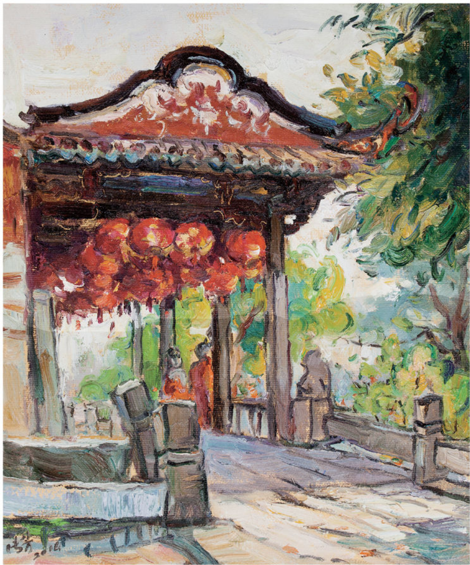
作品：五里桥亭（油画） 尺寸：50cm x 50cm 作者：彭传芳