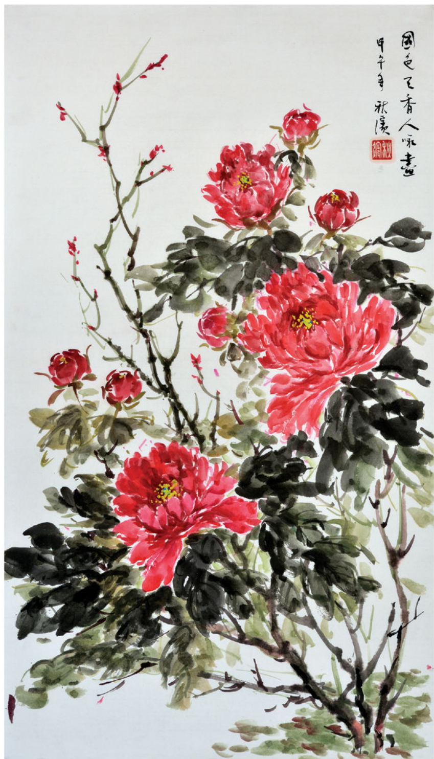
作品：国色天香人咏画（国画）