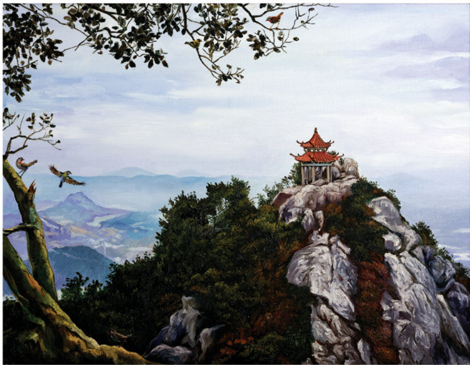
作品：紫帽山（油画） 尺寸：70cm × 90cm 作者：陶贤辉