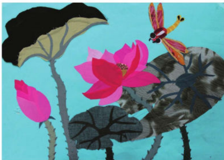
大连市旅顺口区龙头中心小学学生创作的布贴画《荷花》