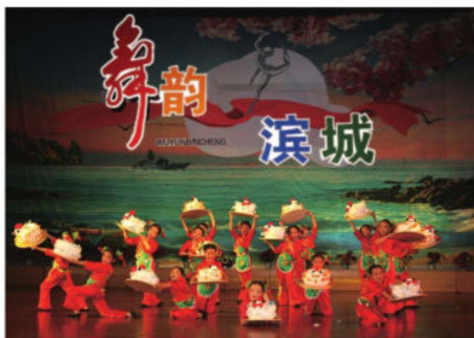
大连市旅顺口区九三小学学生以面塑为题材创作的舞蹈《年年盛》