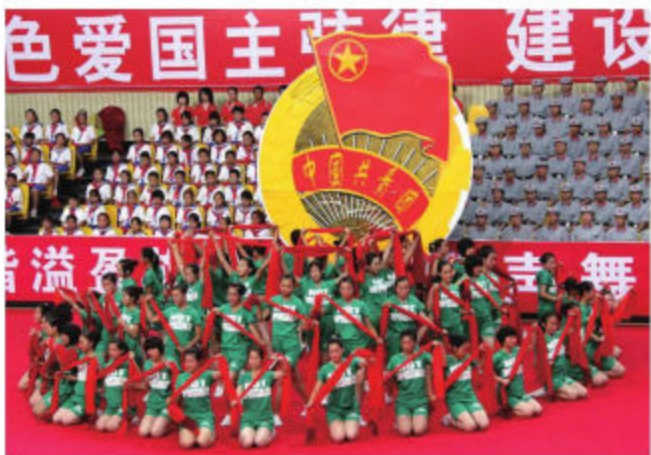
大连市旅顺口区庆祝新中国成立60周年大型歌舞展演