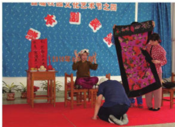
旅顺第三高级 中学课本剧表演