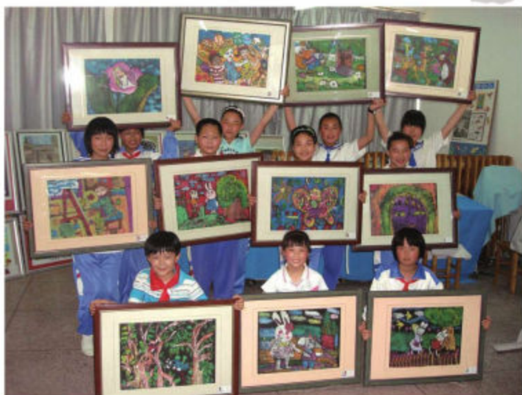
大连市旅顺口区水师营中心小学学生展示自己创作的彩色版画