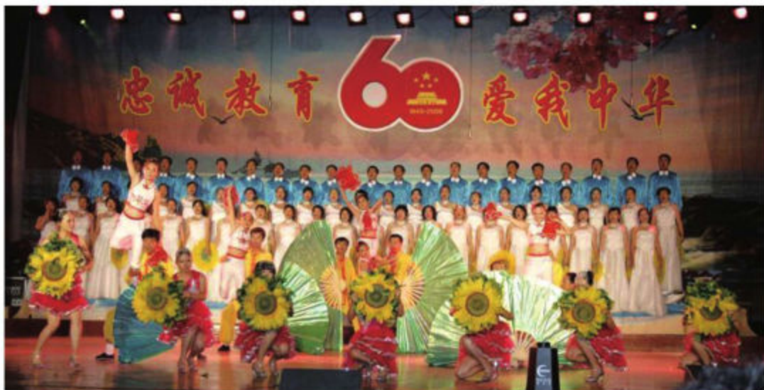
大连市第六十二中学师生表演的歌舞《在希望的田野上》