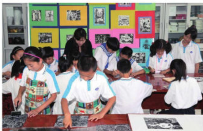
大连市旅顺口区九三小学学生在进行版画创作