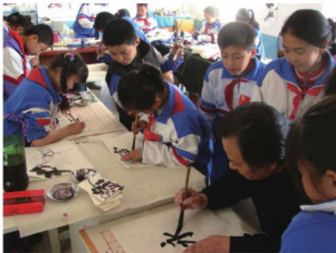
大连市旅顺口区九三小学的书法校本课