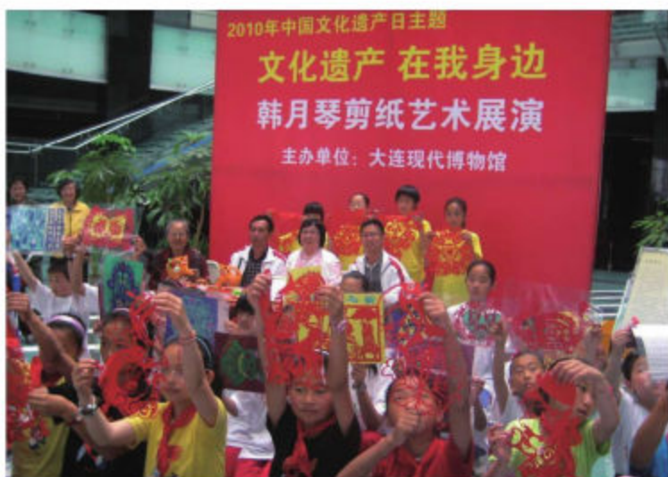
大连市旅顺口区前夹山小学师生在大连市举办的“文化遗产在我身边”活动中做剪纸展示