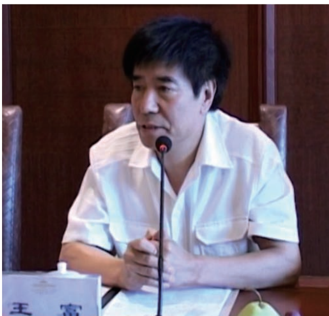
王富，教育部巡视专员，教育部关心下一代工作委员会常务副主任，中国教育装备行业协会会长，国家督学。