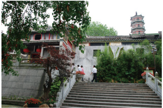
◎ 佛教禅宗祖庭之一—国恩寺（云浮） Buddhist Zen ancestral temple in Xinxing (Yunfu)

相传六祖惠能结束在肇庆地区的隐居生活后来到了岭南历史最久、影响最为深广、规模最为宏大的寺院广州光孝寺，当时正赶上寺院印宗法师在讲经。一阵清风