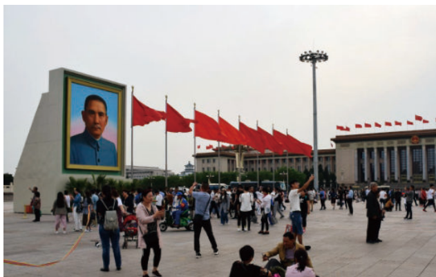
◎ 北京天安门广场孙中山像（北京） The portrait of Sun Yat-sen at Tian'an Men Square in Beijing (Beijing)