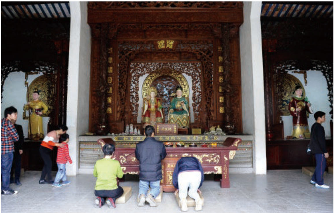
© 洗太庙 (茂名高州) Lady Xian Temple (Gaozhou, Maoming)

到了隋代,洗夫人化解民族矛盾,严惩贪官,招慰亡叛,安定百姓,既铲除了腐败,又为维护和促进民族团结立了新功,岭南数郡共举她为主,尊为“圣母”。军事上,她反对地方割据和分裂活动,维护国家统一,经济上,她积极传播汉族当时的生产技术,推动岭南社会经济的发展,并大力宣扬汉族的文明与进步,改革俚人的社会习俗,不断推动岭南社会进步,被赞誉为“中国巾帼英雄第一人”。