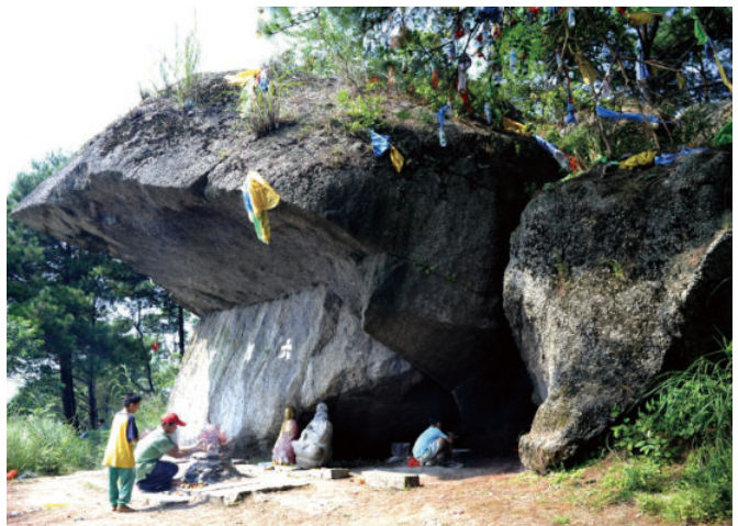
◎ 六祖惠能怀集冷坑隐居处（肇庆） The Sixth Patriarch Huineng lived in a seclusion in Lengkeng Huaiji (Zhaoqing)