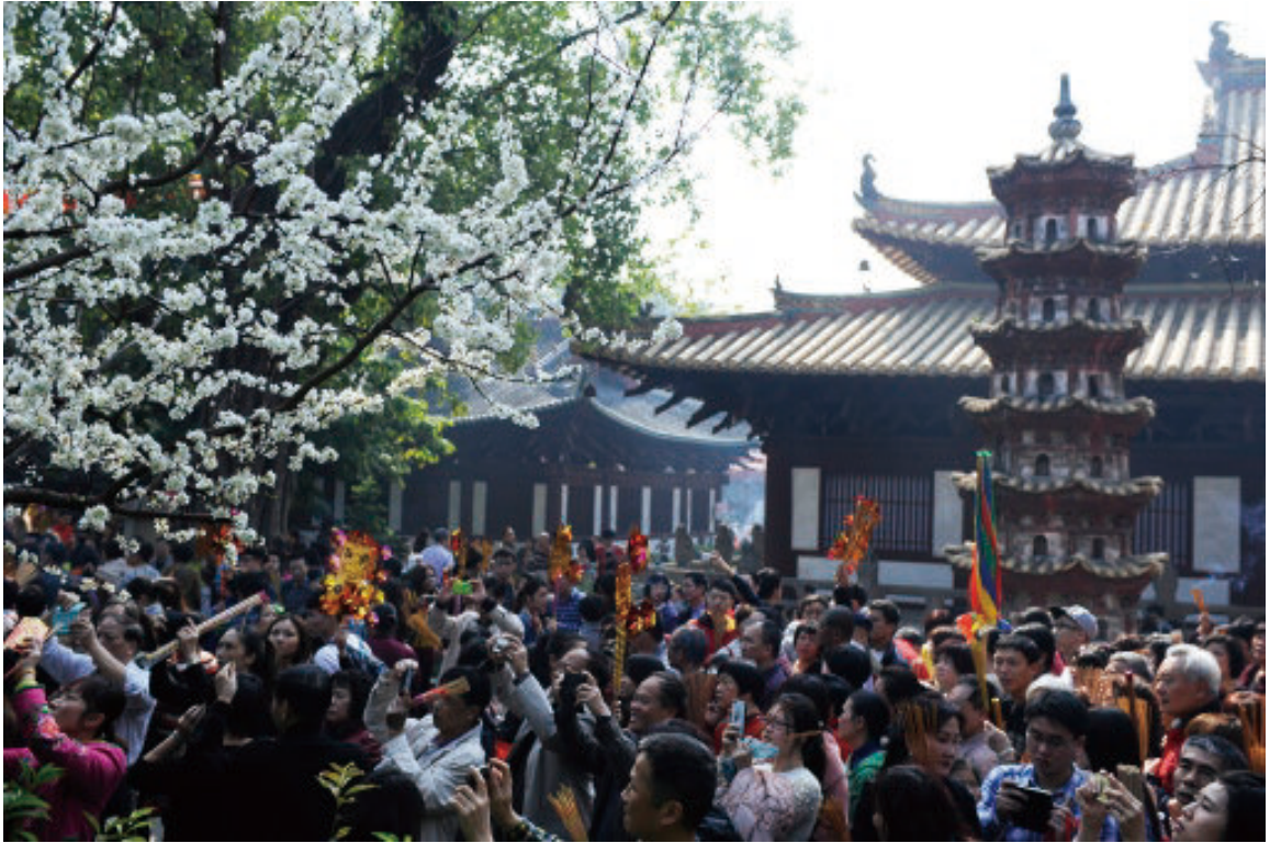
◎ 光孝寺瘞发塔前新年祈福 (广州) The blessing in front of the hair-inhmed Pagoda in Guangxiao Temple (Guangzhou)

吹来，佛阁顶上的旗幡随风飘动，印宗法师便向众僧发问：“这是什么在动？”一僧曰：“此乃幡动。”另一僧谓：“此乃风动。”惠能趋前插话：“此乃心动。”智解风幡孰动之辩，首创“心动”之说。印宗法师遇到惠能，言谈之下，特别赞扬。替六祖剃了头之后，印宗法师以荐贤胸怀和远见反过头来拜惠能为师，并把惠能的头发埋在地下，后建塔以资纪念。惠能在此启行“去发”之礼，正式进入佛门，出山面世，担当禅主，正式揭开以禅济世的篇章。