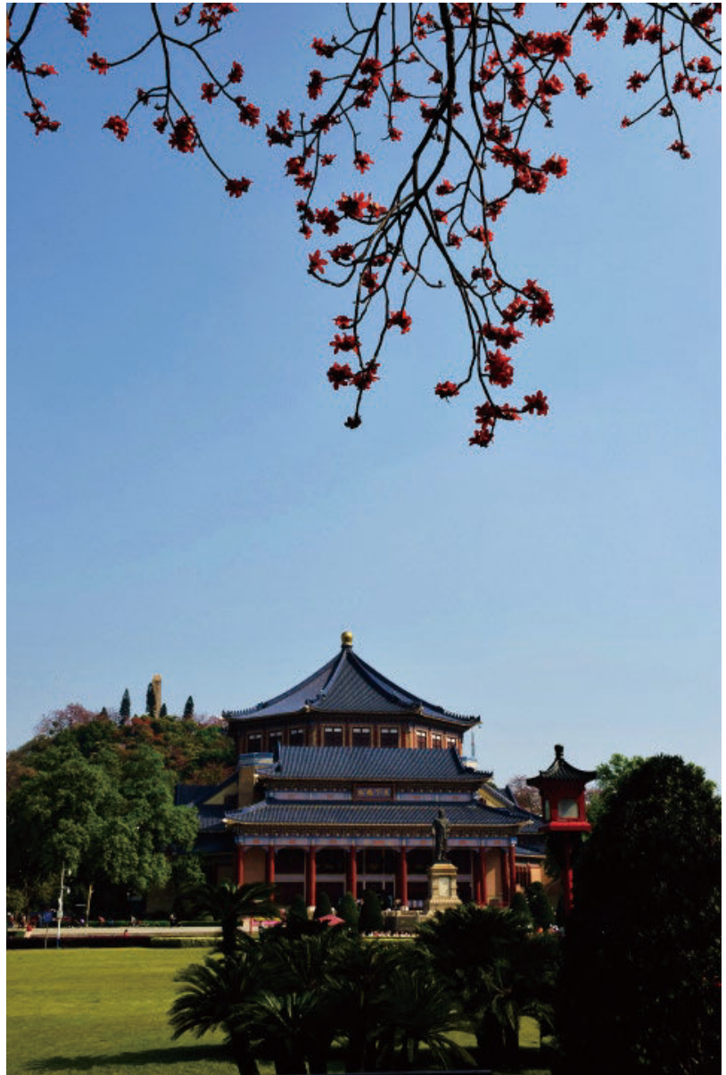
◎ 广州中山纪念堂(广州) Guangzhou Sun Yat-sen Memorial Hall (Guangzhou)

孙中山(1866—1925), 名文, 广东香山(今中山市)翠亨村人, 是改变中国命运的近代民主革命家、中国国民党创始人、三民主义的倡导者, 是首举反君主专制旗帜的灵魂人物。孙中山于1905年组织中国同盟会, 发动武装起义, 领导了震惊中外的辛亥革命, 推翻了中国历史上延续几千年的封建王朝专制统治, 开创了我国民主革命风起云涌的历史新篇章, 是中国现代化的先驱, 辛亥革命后被推举为中华民国临时大总统。孙中山先生是20世纪中国三大伟人之一。