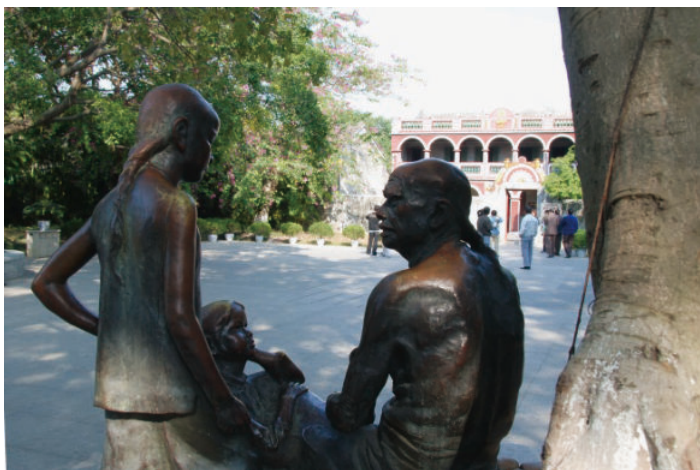
◎ 中山市翠亨村（中山） Cuiheng Village (Zhongshan)

1894年，孙中山上书李鸿章，提出“人能尽其才，地能尽其利，物能尽其用，货能畅其流”的革命政治主张，明白了“和平方法，无可复施”，从此走上了为复兴祖国而努力的革命道路。就在这一年，孙中山建立了中国第一个资产阶级革命团体——兴中会，并提出了“驱除鞑虏，恢复中华，创立合众政府”的主张。1905年他成立了第一个全国性统一的资产阶级革命政党——中国同盟会，把自己的思想阐发为“三民主义”，即“民族、民权、民生”，推动了资产阶级民主革命的发展。1912年1月1日，孙中山在南京宣誓就职临时大总统，宣告“中华民国”成立。南京临时政府颁布了一系列法令和措施，对于中国的发展起到了积极的作用。1924年冬，孙中山扶病北上，到北京后，继续为召开国民会议、反对段祺瑞的卖国政策进行斗争。他是伟大的爱国者，全心全意为改造中国而耗费了毕生的精力。