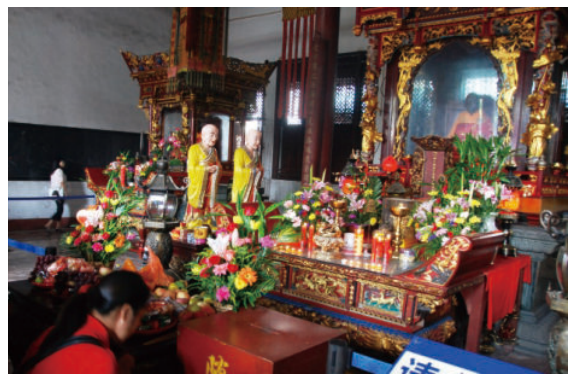
◎ 民众朝拜惠能六祖 (曲江南华寺) (韶关) Pilgrims at Nanhua Temple paid homage to The Sixth Patriarch Huineng (Shaoguan)

六祖惠能的禅学思想在国内和世界上都有着巨大的影响力。他坚持“农禅合一”的主张和实践，使禅宗文化成为中国传统文化的一个重要组成部分，深刻影响了唐宋以来中国的哲学思想和文化艺术。