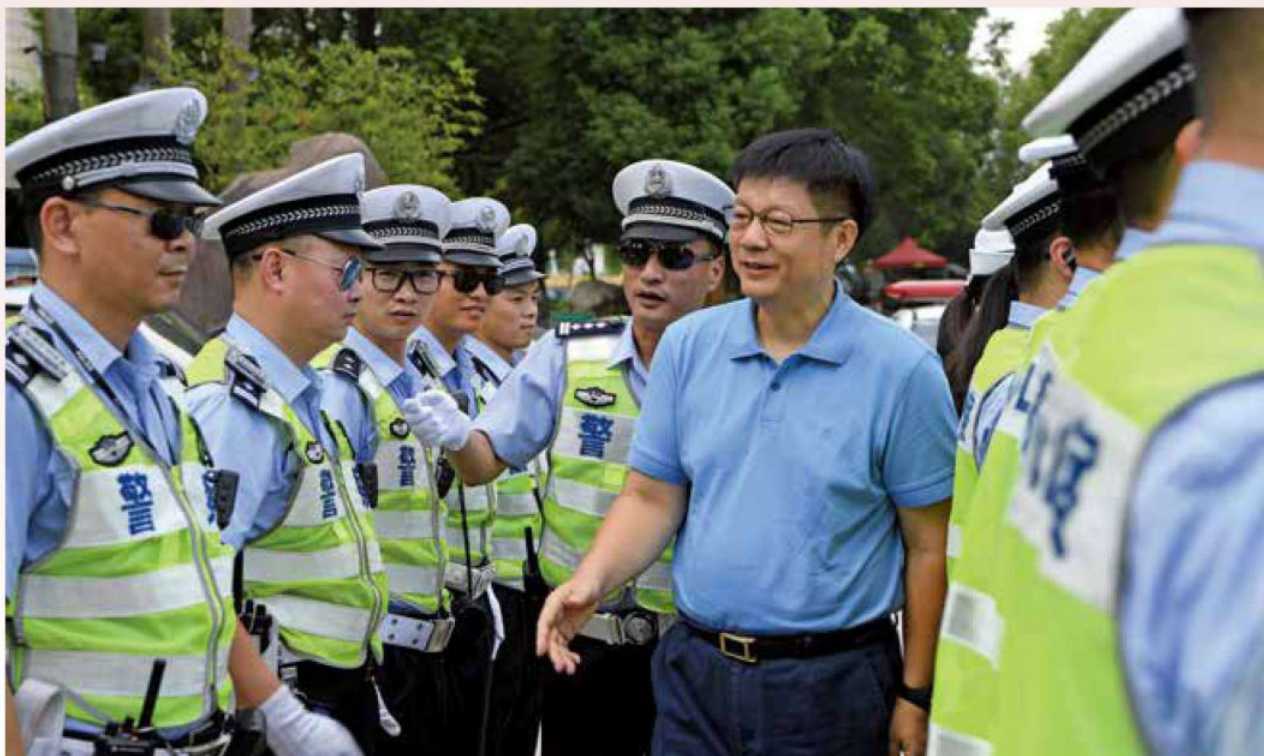
2017年8月15日，市委副书记、市长张耕上路慰问奋战在高温一线的交通警、协辅警。