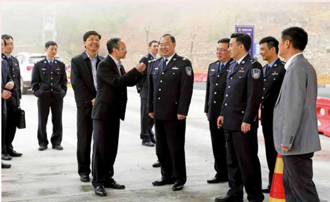
2017年4月11日，省委常委、公安厅长徐加爱到温州检查指导工作。