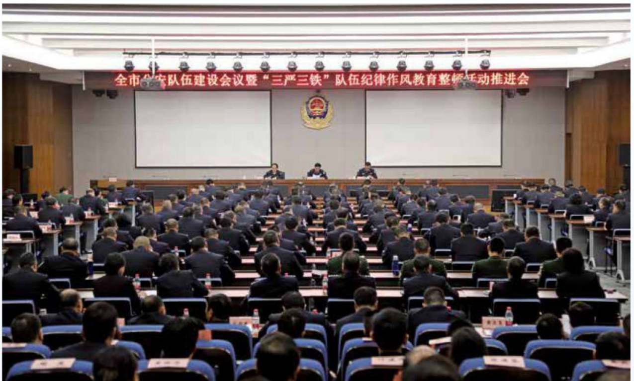
2017年2月27日，市局召开全市公安队伍建设会议暨“三严三铁”纪律作风教育整顿活动推进会。