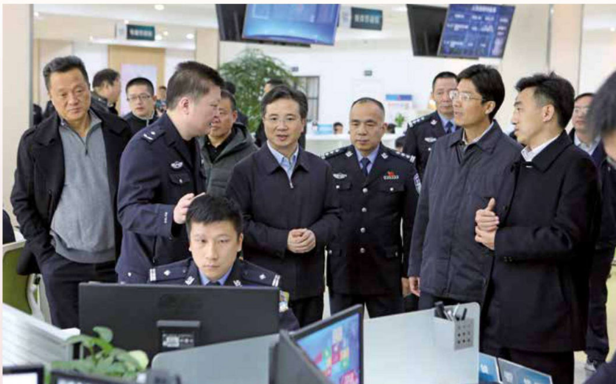
2017年12月9日，省委常委、市委书记周江勇到市局检查指导工作。