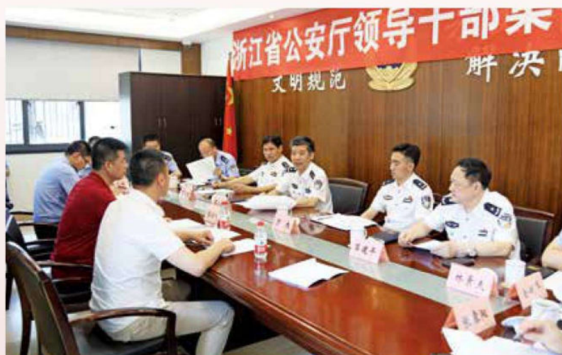
2017年7月12日，省厅党委委员、副厅长石小忠到温州开展集中接访工作。