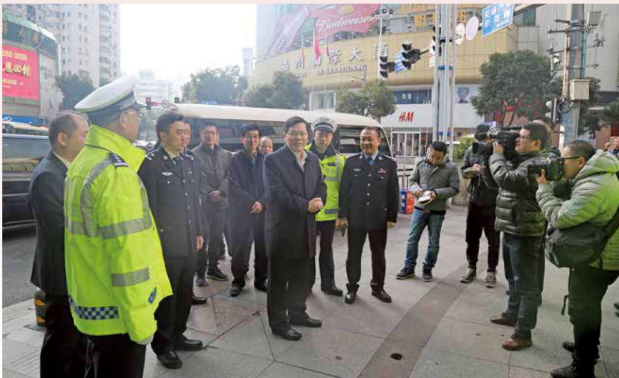
2017年1月26日，市委书记徐立毅慰问路面执勤民警。