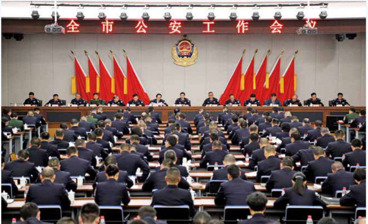
2017年1月24日，市局召开全市公安工作会议。