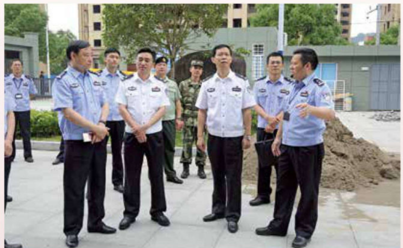
2017年6月8日，省厅党委委员、副厅长沈亚平到乐清调研指导工作。