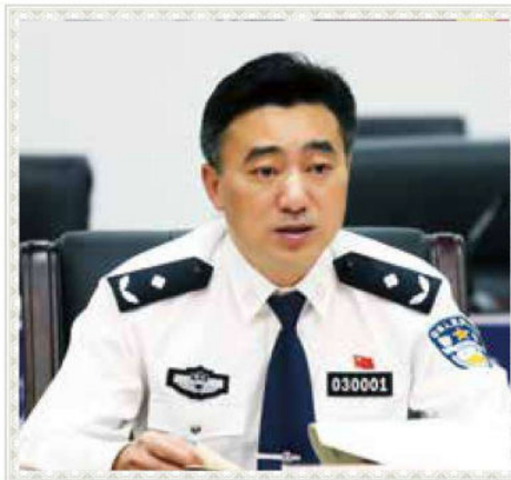
罗杰 市委常委、市公安局党委书记、 局长，督察长，三级警监。