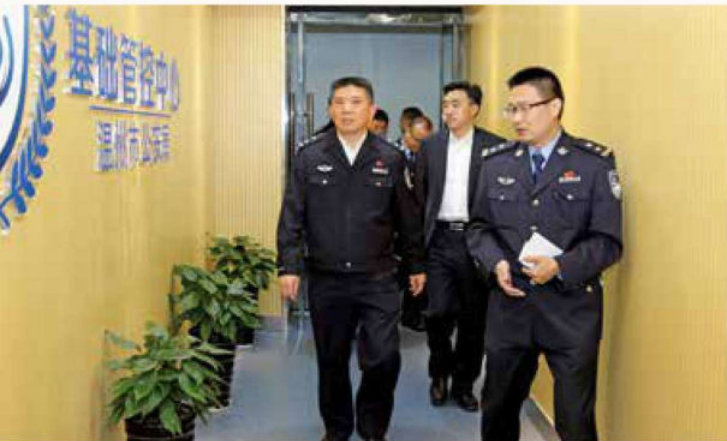
2017年4月10日，省厅党委委员、副厅长金伯中到温州检查基层基础工作。