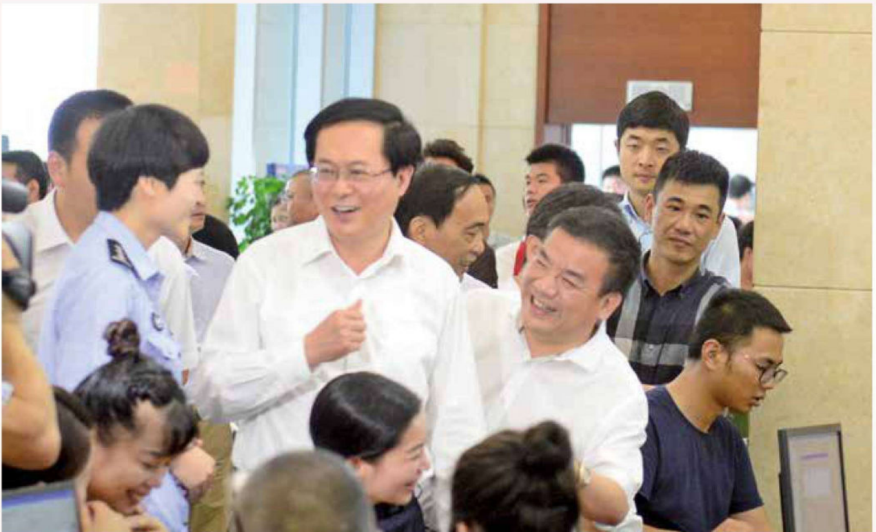
2017年6月26日，省委书记车俊到苍南行政审批中心公安窗口调研指导最多跑一次工作。