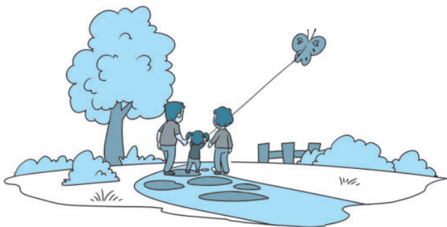
一家人在公园里放风筝

但国家、社会为公民提供各项生存和生活保障是以国家的富裕、富强为物质基础的，公民参加劳动，就是为国家和社会创造出物质财富，国家、社会富裕了，公民的个人生活才能有根本的物质保障，每个人的生活水平才能从根本上得到提高。因此，公民积极参加劳动，既是一种权利，也是一项应尽的义务和光荣的职责。