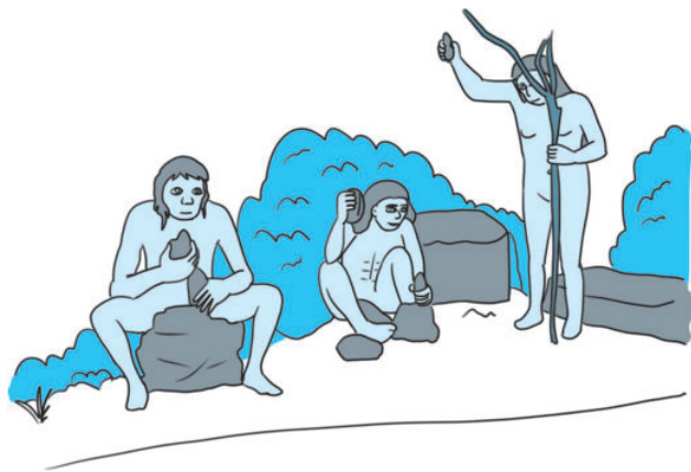
北京猿人打制石器

按照传统的分类方法，劳动可以分为体力劳动和脑力劳动。体力劳动是指以人体肌肉和骨骼的劳动为主，以大脑和其他生理系统的劳动为辅的人类劳动。脑力劳动是指以大脑神经系统的劳动为主，以其他生理系统的劳动为辅的人类劳动，如思考、记忆等，主要是指依靠头脑中的知识和智慧改造自然和改造社会的活动。体力劳动与脑力劳动都是十分重要的劳动形式。从人类劳动的演变史来看，不同社会形