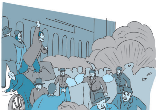
1886年芝加哥工人大罢工

原来劳动节的诞生有着这样的历史背景，小法这才明白。芝加哥的工人们罢工是为了争取八小时工作制，时间过去了一百多年，现在的劳动者都享有了哪些权利呢？现在的社会这么发达，好多工作都由机器来完成了，人们是不是可以不用再劳动了呢？放下报纸，爱思考的小法头脑里冒出一个又一个问号。下面我们就通过学习来解答小法的问题。