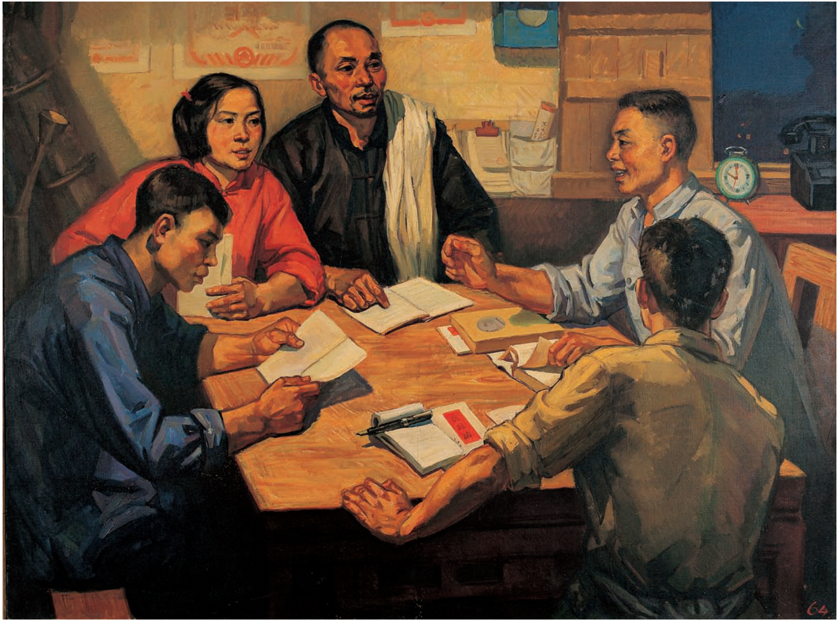
农村支部 / 布面油画 / 125cm×165cm/1964 年