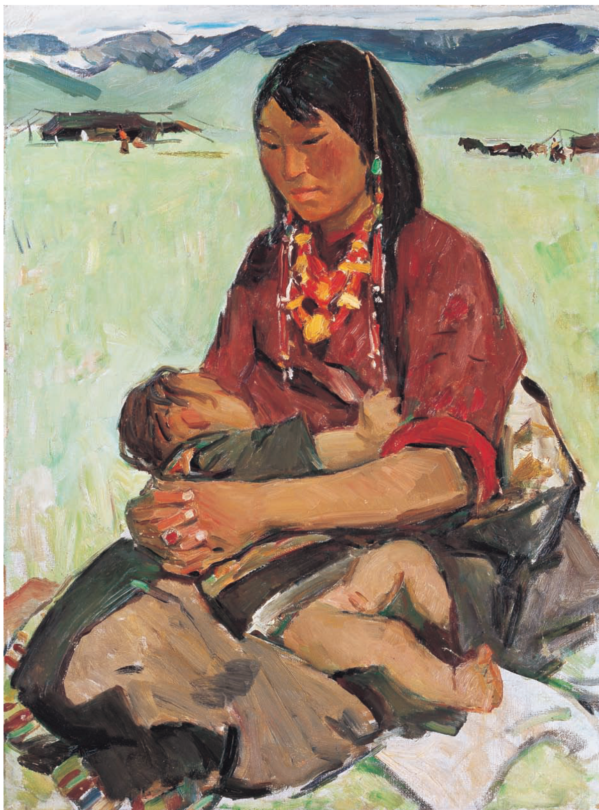
藏族母子 布面油画 60cm×80cm 2013年