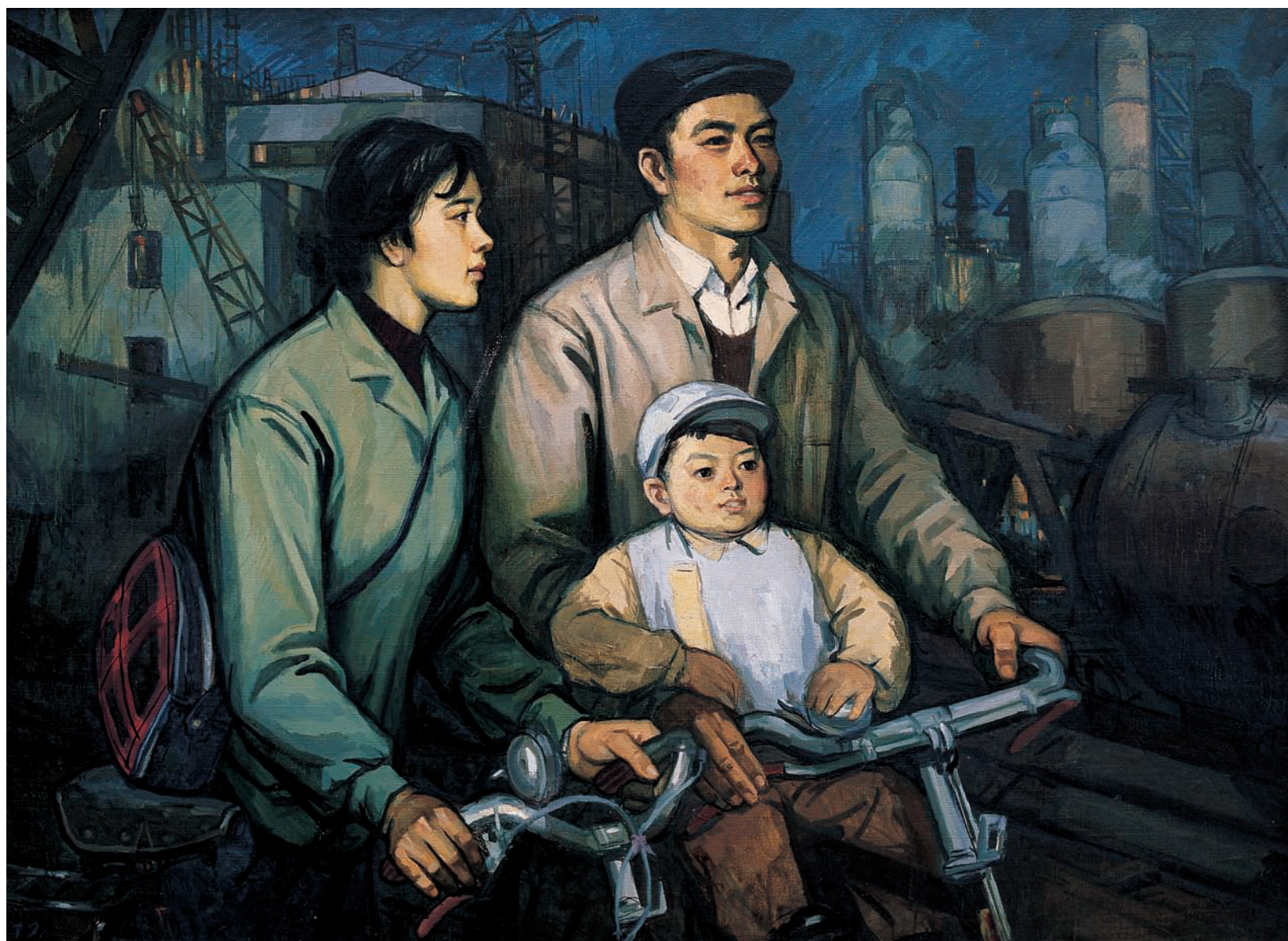
建设者 / 布面油画 / 110cm×151cm/1979 年