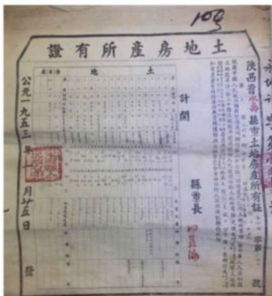
1953年永寿县人民政府颁发的 土地房产所有证