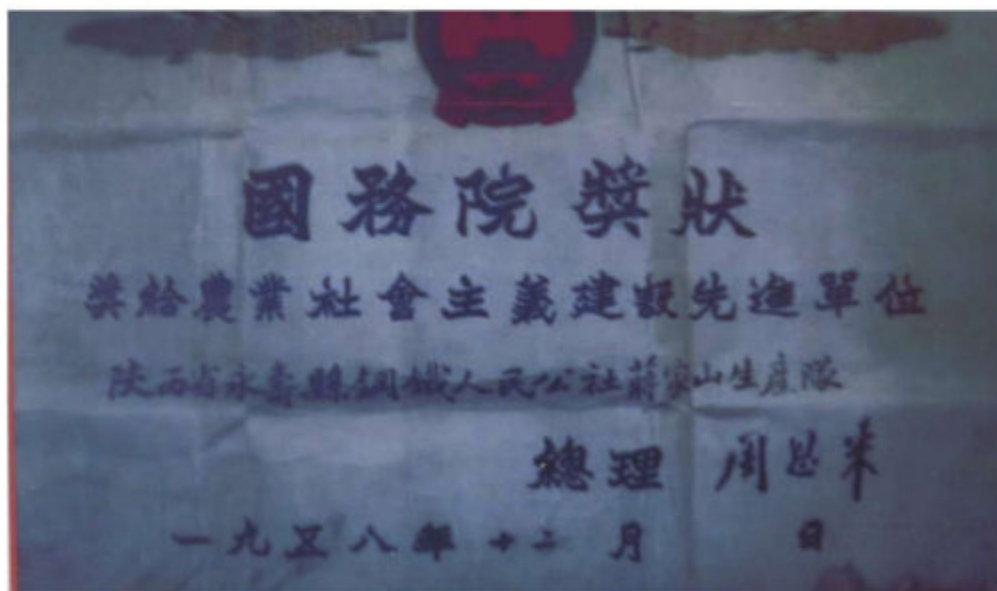
1958年国务院给钢铁（永平）公社蒋家山生产队颁发的 “农业社会主义建设先进单位”奖状