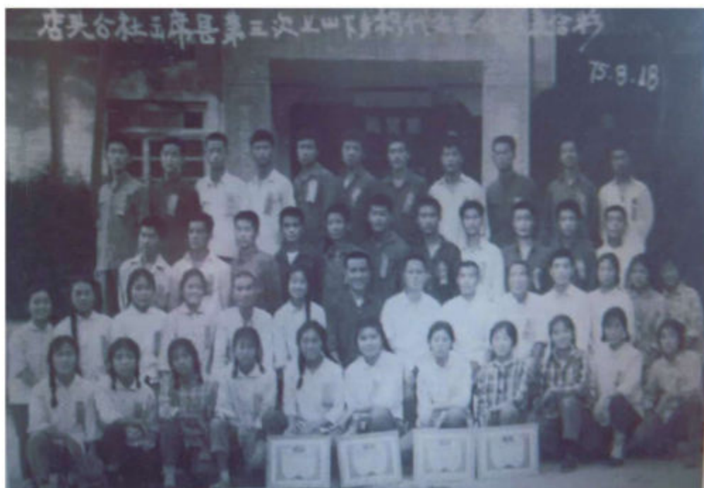
1975年在店头公社插队的知青出席县上山下乡积代会