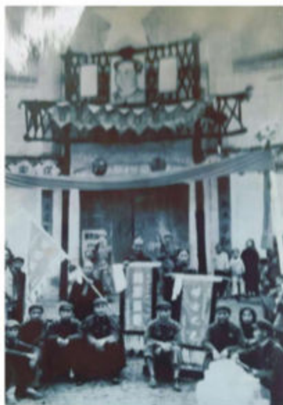
1954年永寿县首届农业表彰会