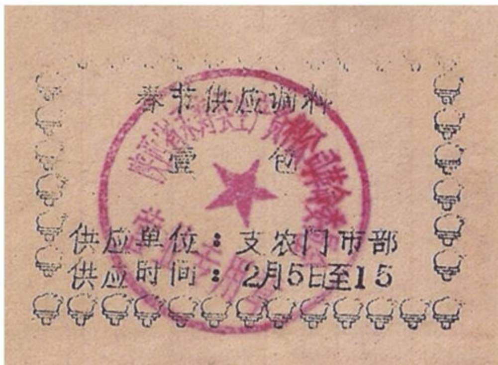
“文革”期间的定量供应调料单