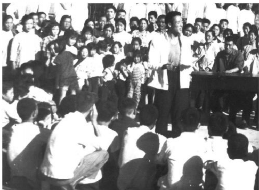
1973年监军公社永寿大队农民赛诗会