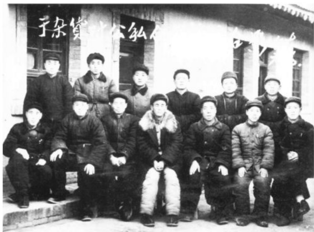
1959年乾县永寿公私合营杂货门市部职工