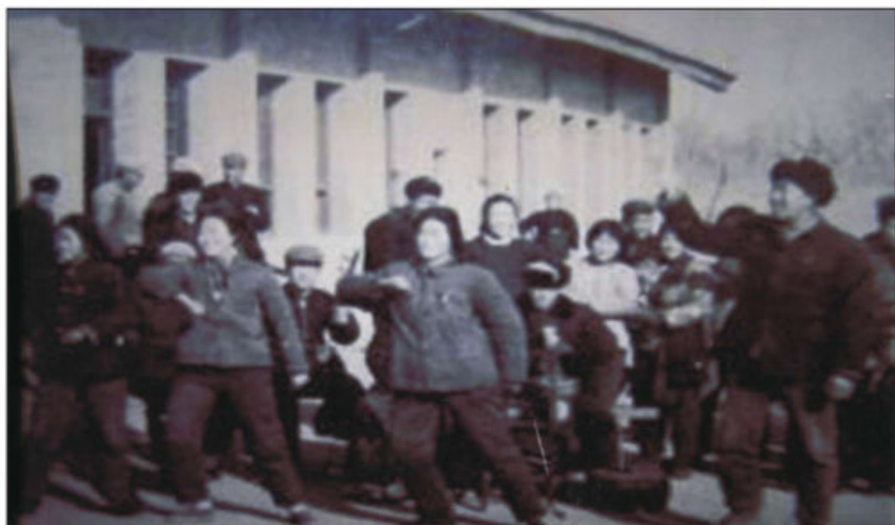
1974年在甘井公社插队的知青排练文艺节目