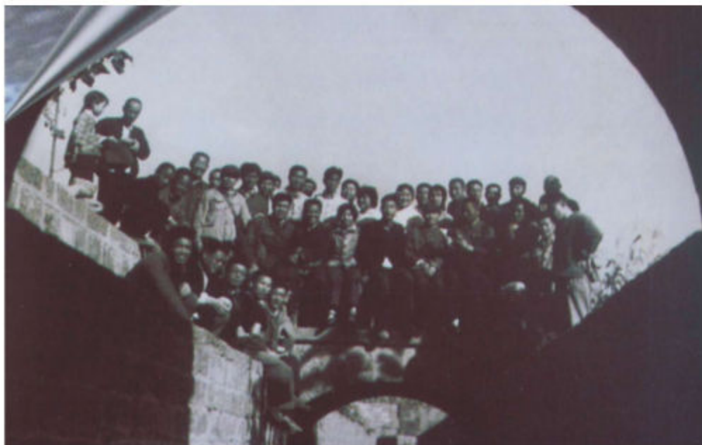
1971年县委领导和民工在绛山水电站