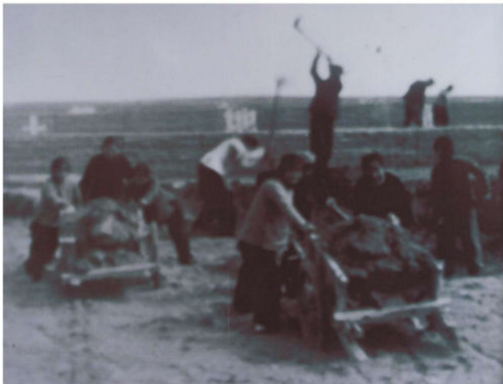
1966年监军公社城关大队农田基本建设工地