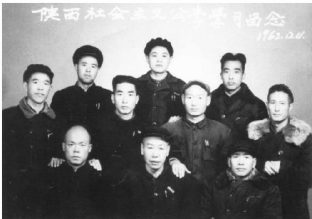
1962年陕西社会主义公学永寿学员