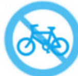
禁止非机动车通行