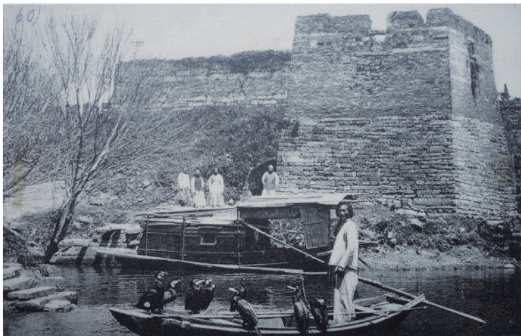
图1 朱柏庐先生生活过的昆山古城