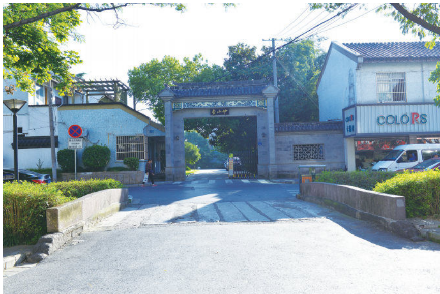
图2 朱柏庐故居附近的通匾桥