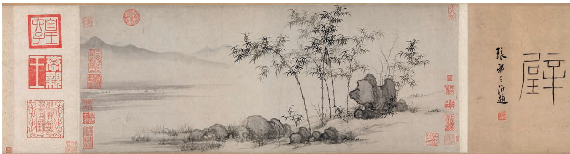
元 赵原 沈巽 赵沈合璧图 卷 纸本水墨 全卷纵二五·七厘米 横八八二·二厘米 美国大都会艺术博物馆藏