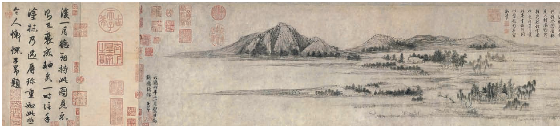
元 赵孟頫 水村图 卷 纸本水墨 纵二四·九厘米 横一〇·五厘米 故宫博物院藏

吴镇师承元代夏文彦，《图绘宝鉴》记载了他的绘画渊源：『画山水师巨然，其临摹与合作者绝佳。而往往传于世者，皆不专志，故极率略』。巨然《层岩丛树图》上董其昌题道：『观此