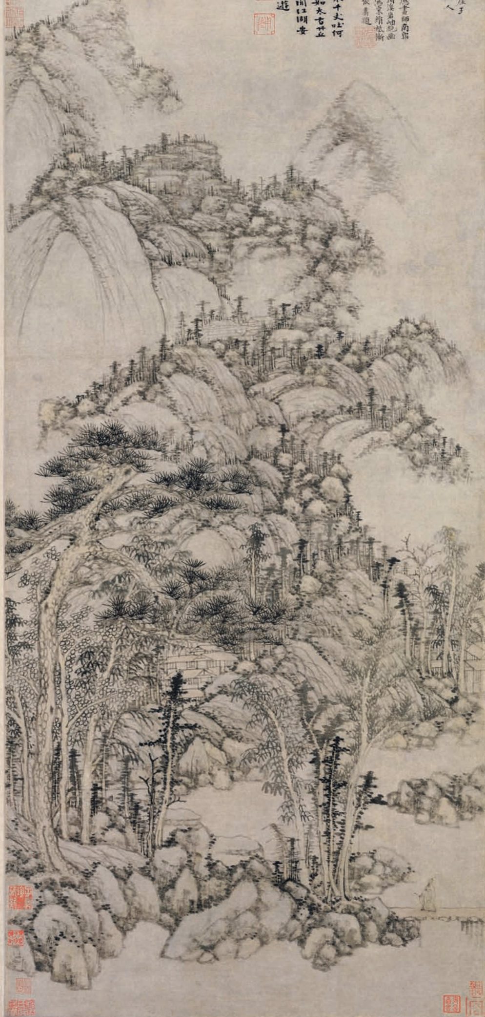
元 黄公望 丹崖玉树图轴 纸本设色 纵一〇一·三厘米 横四三·八厘米 故宫博物院藏