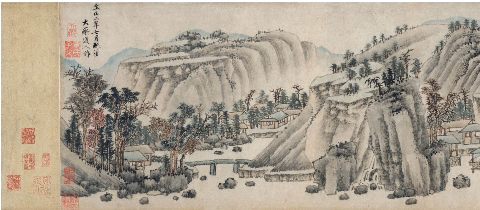
元 黄公望（款） 秋林烟霭图 卷 纸本设色 纵三〇厘米 横二五九厘米 藏地不详