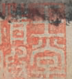
元 黄公望（款） 秋林烟霭图 卷 局部二