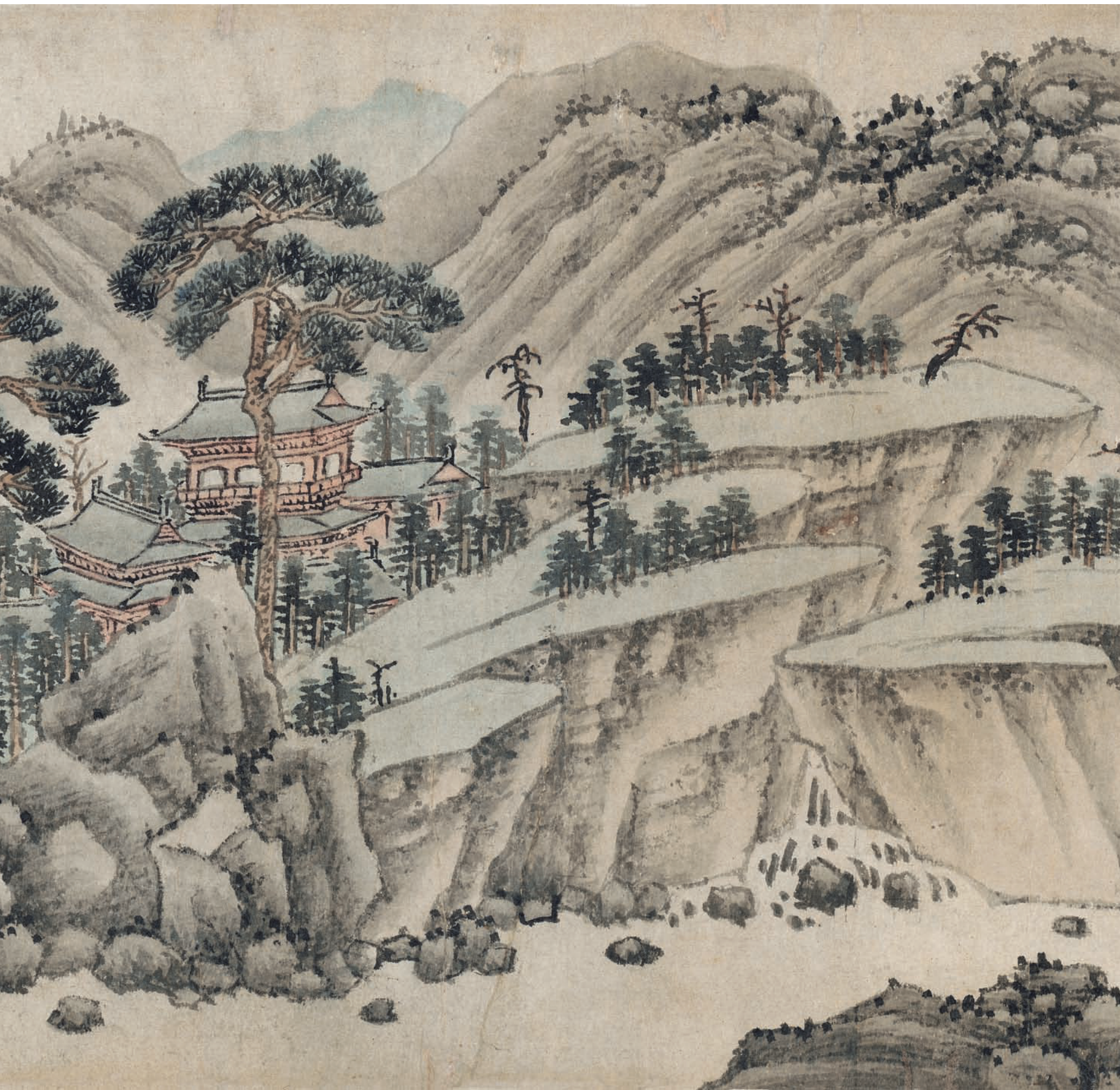
元 黄公望（款） 秋林烟霭图 卷 局部一