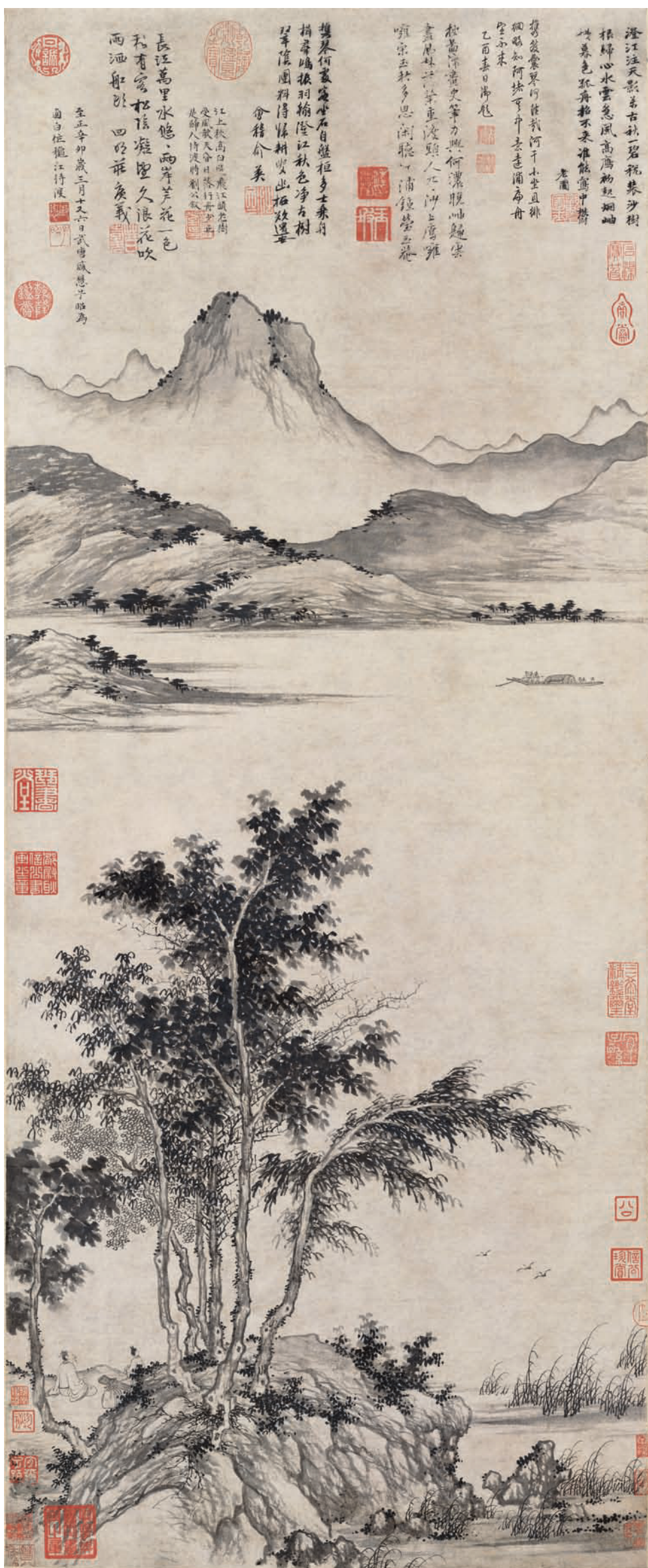
元 盛懋 秋江待渡图 轴 纸本水墨 纵一一·五厘米 横四六·三厘米 台北故宫博物院藏