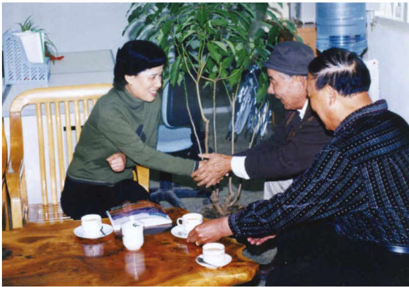
■ 2001年11月3日广西壮族自治区副主席袁凤兰在愚自乐园简易办公厅会见曹日章总裁（中）和叶鸿鹏投资顾问（右）。袁凤兰称赞愚自乐园是“艺术奇观、流芳千古、造福人类的文化艺术旅游项目”。