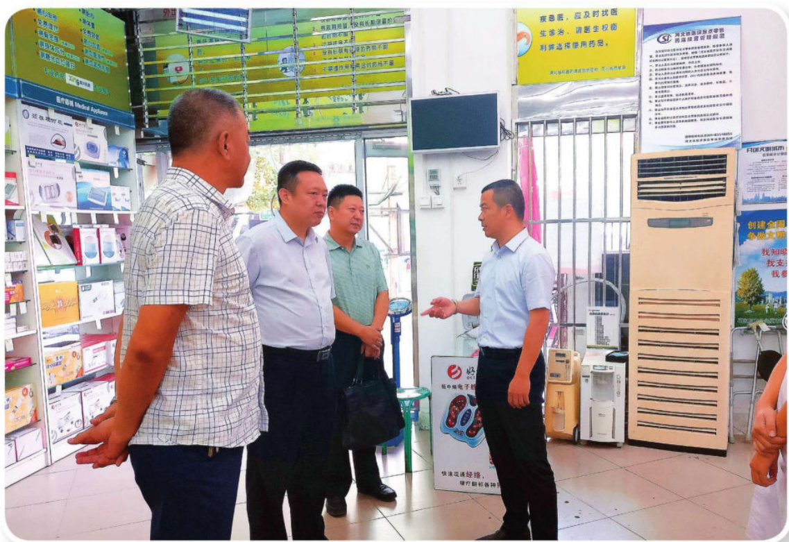
9月30日，区长穆德英（右一）督导食品药品安全工作