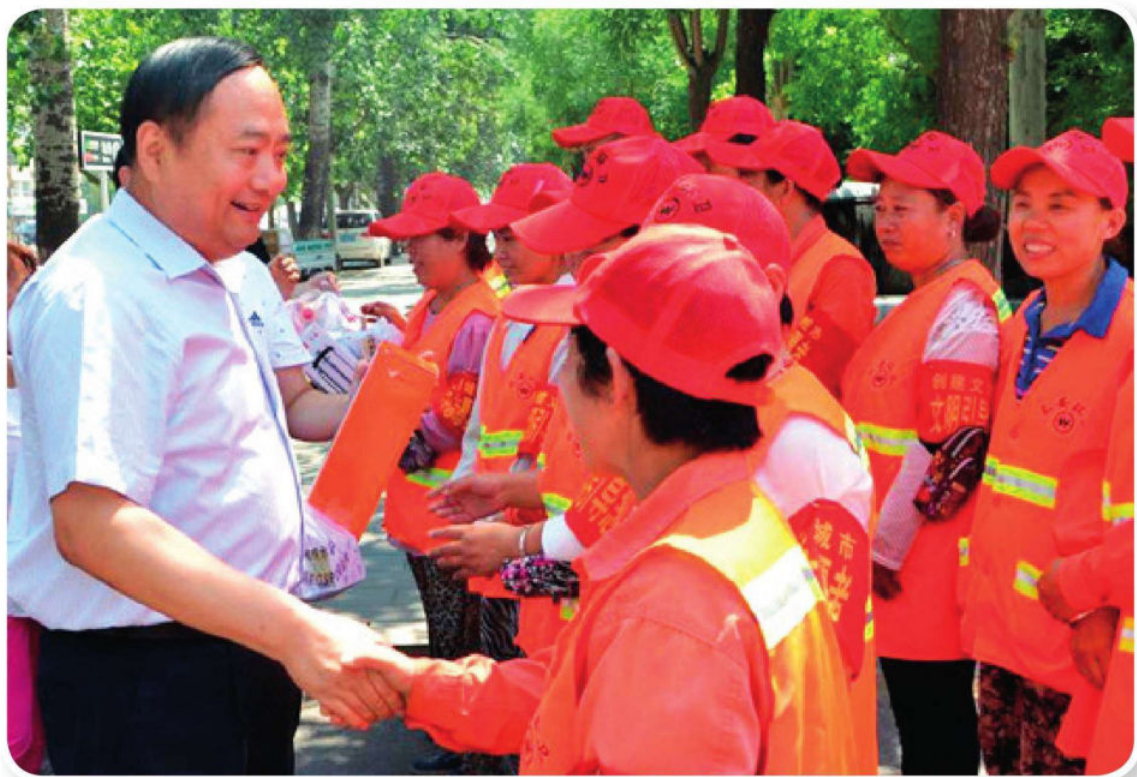
7月11日，市长邓沛然（左一）到长安区看望慰问烈日下坚守一线的环卫工人