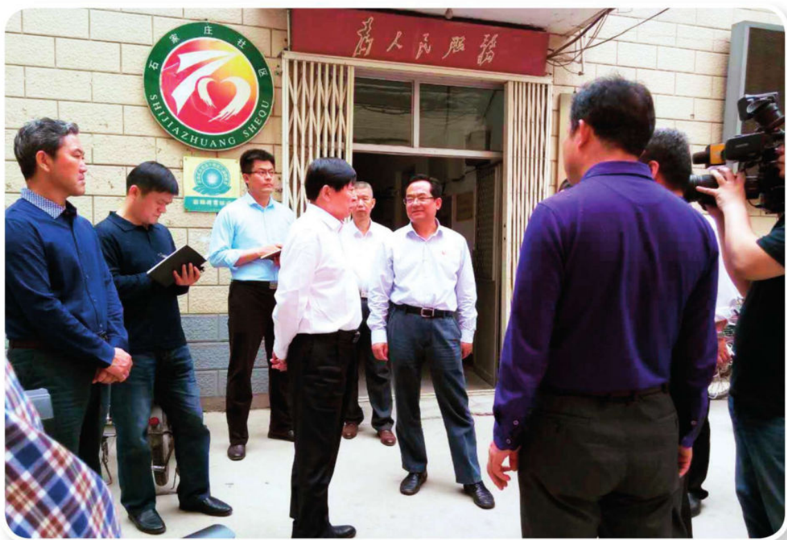
5月1日，省委常委、市委书记邢国辉（左四）到一印社区调研全国文明城市创建工作