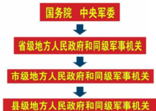
人民防空领导体制

5 各级人民防空主管部门管理本区域人民防空工作。其设置、职责和任务，由国务院、中央军委规定。