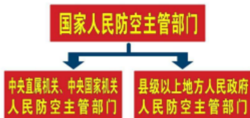
人民防空管理机构

5 各级人民防空主管部门管理本区域人民防空工作。其设置、职责和任务，由国务院、中央军委规定。