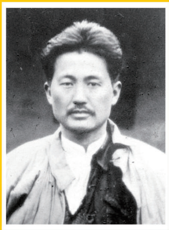
方志敏 ( 1899—1935 )