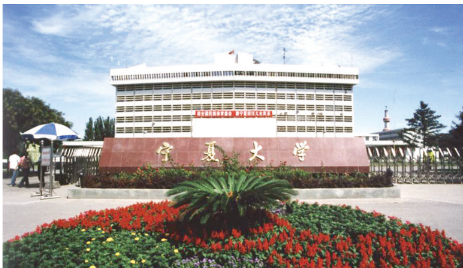
怀远楼（始建于1991年，建筑面积12080平方米，框架8层）