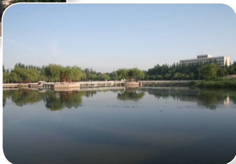
文萃校区文翠湖景（始建于2008年）