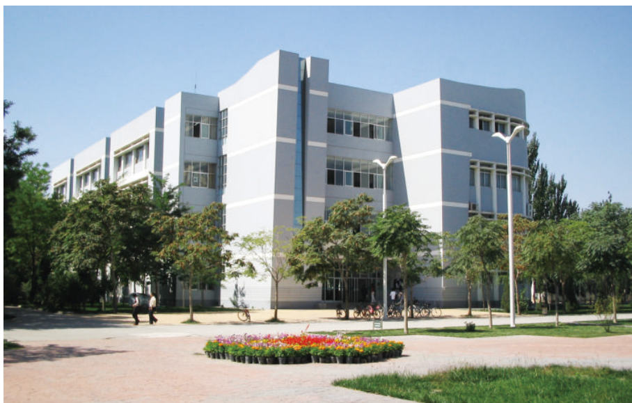
金波楼（始建于2000年10月，建筑面积5593平方米，框架4层）