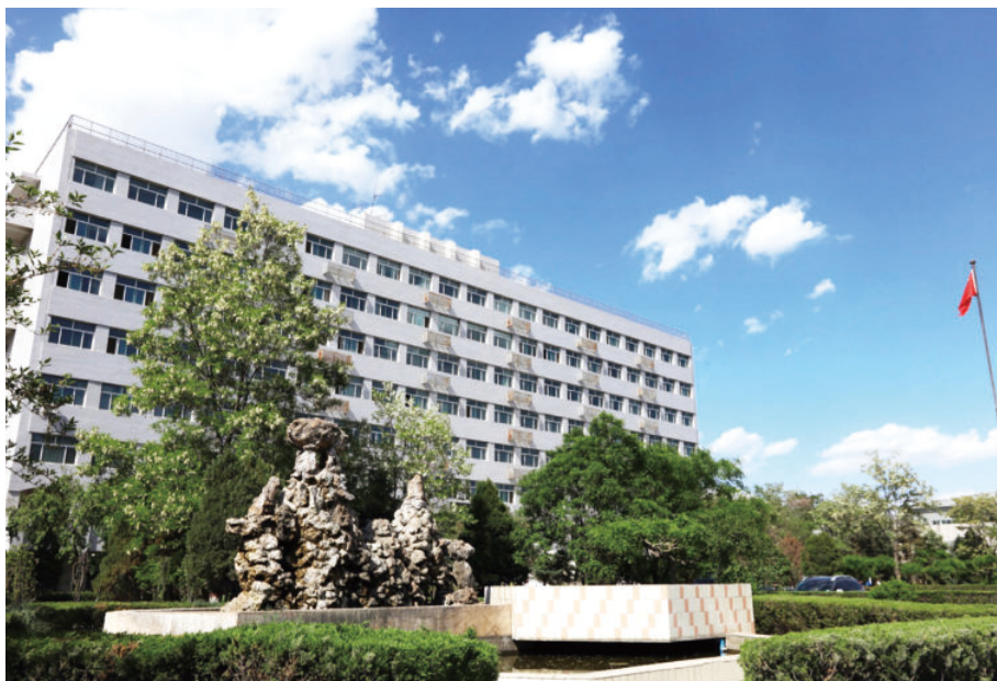
知行楼（始建于1986年，建筑面积10426平方米，框架8层）