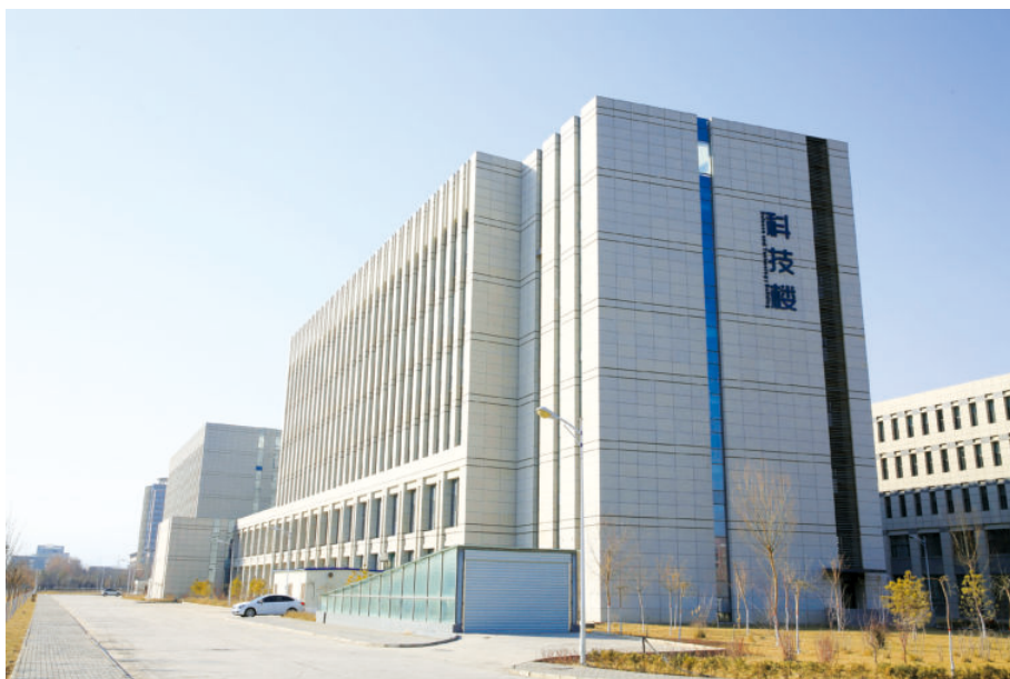
科技楼（始建于2010年12月，建筑面积33863平方米，框架8层，东西配楼6层）