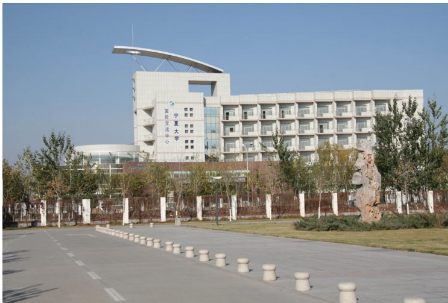
国际交流中心（始建于2005年，建筑面积12400平方米，框架6层）