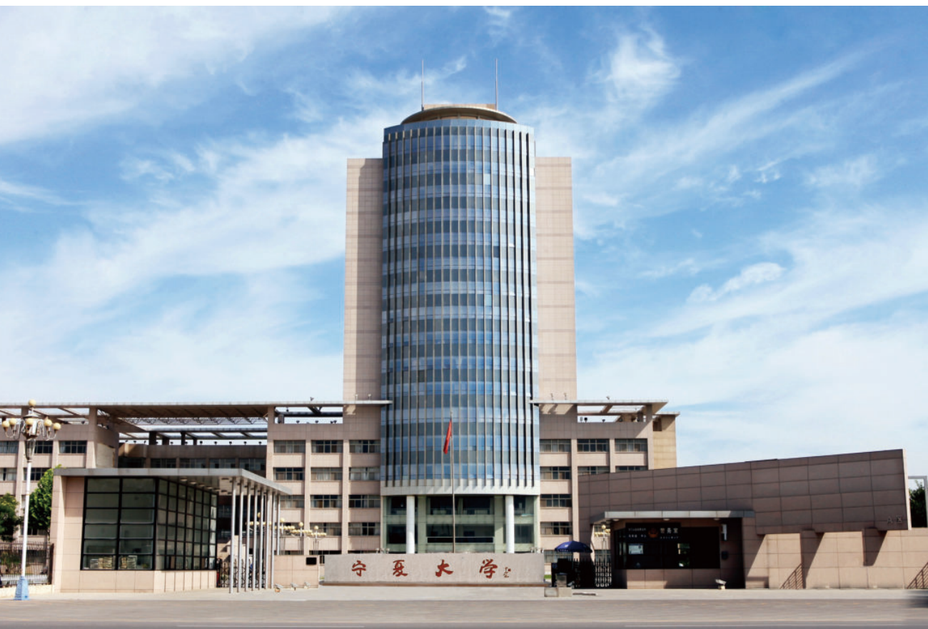
德勤楼（始建于2002年，建筑面积35689平方米，框架17层）