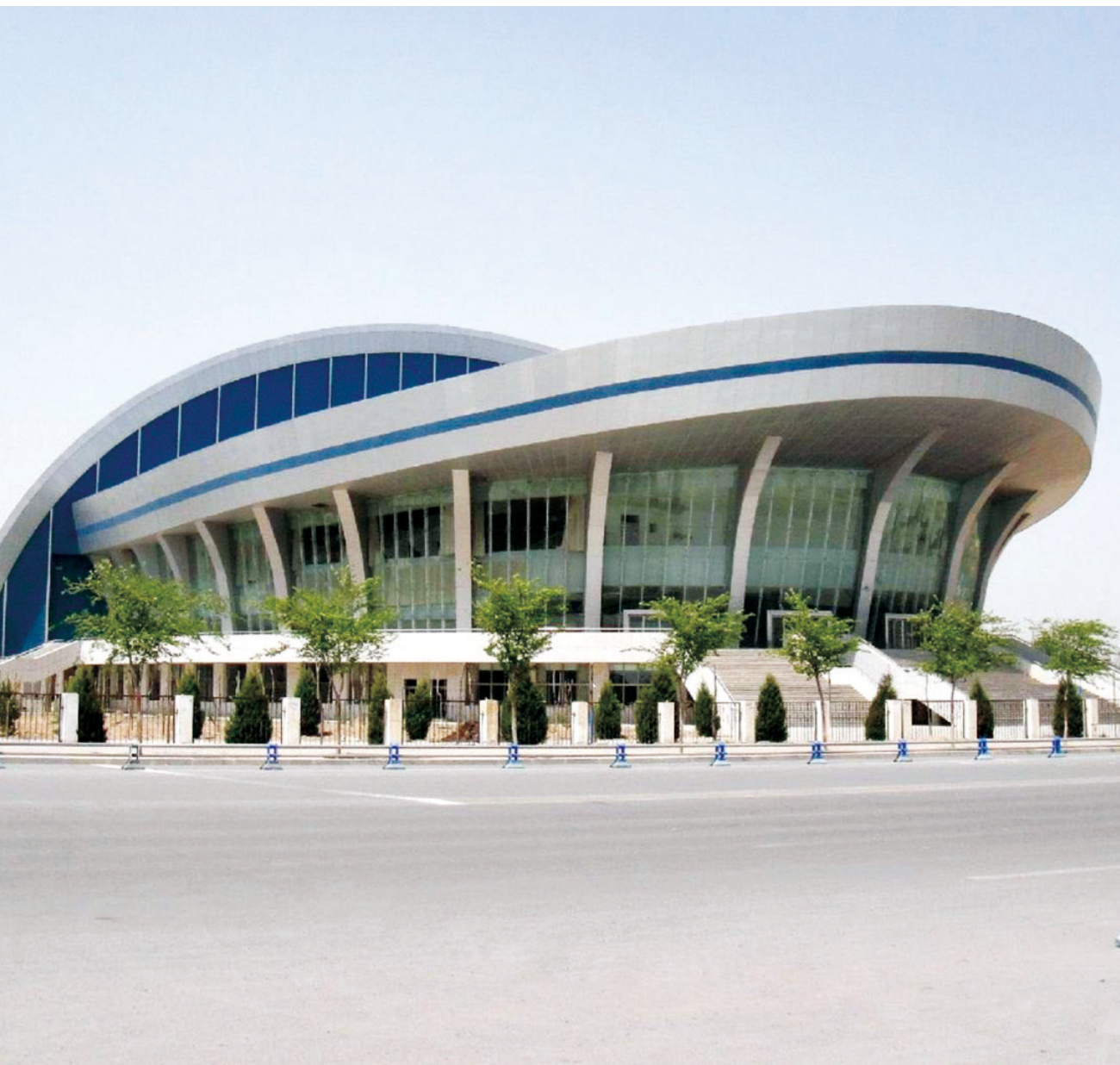
大学生活动中心（始建于2005年3月，建筑面积15180平方米，管桁架框架结构）