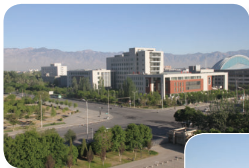
文萃校区图书实验综合楼 （始建于2007年3月，建筑面积31326平方米，框架8层）