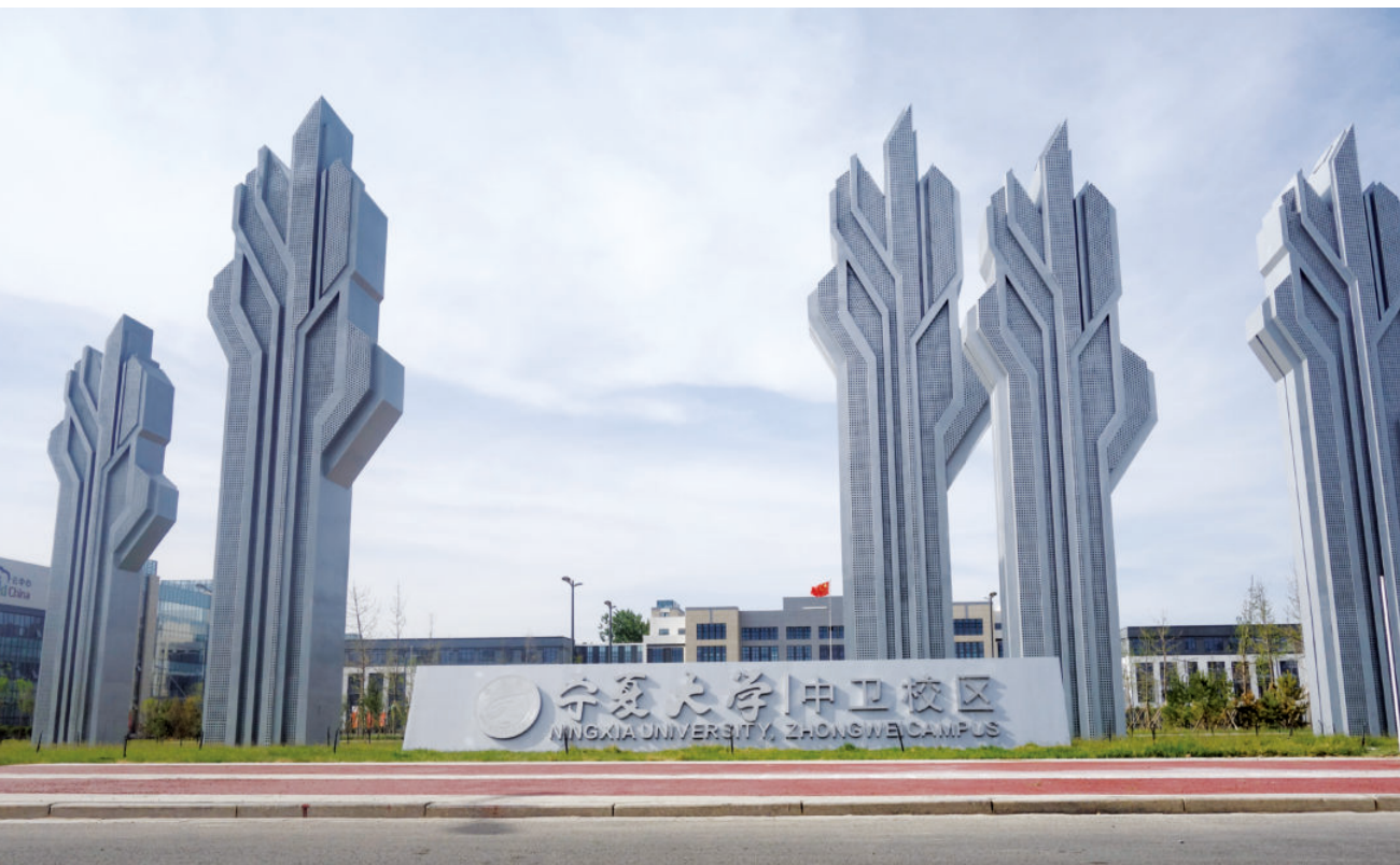
中卫校区正门（始建于2015年）