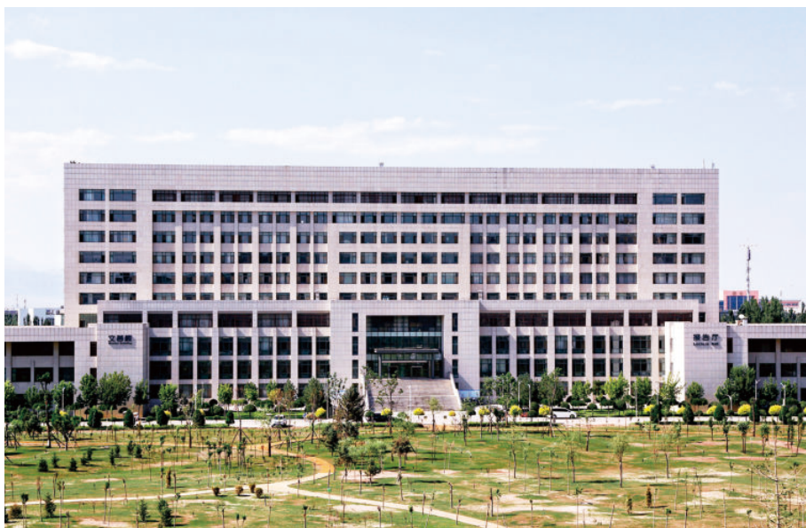
文荟楼（始建于2007年，建筑面积29796平方米，框架10层）