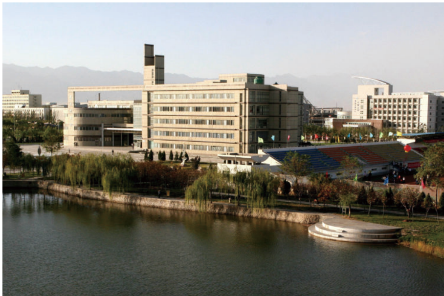
逸夫图书馆（始建于2000年4月，建筑面积18381平方米，框架5层）