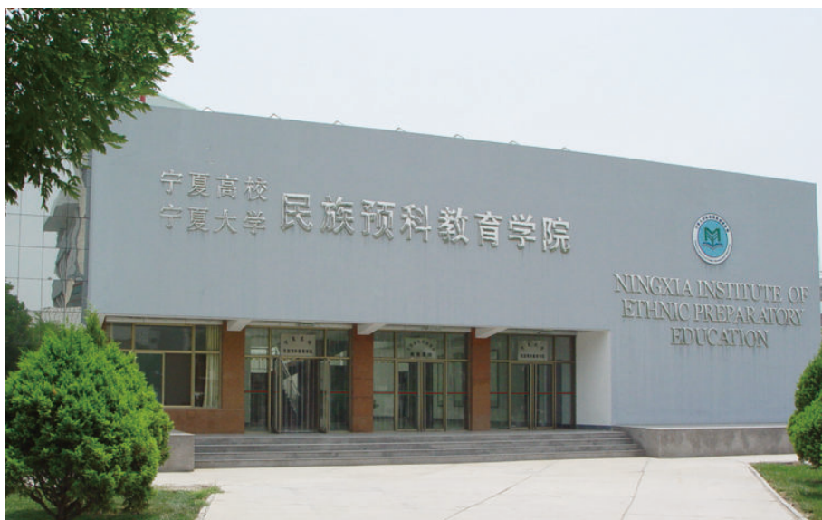
民族预科学院楼（始建于1993年，建筑面积1970平方米，砖混2层）