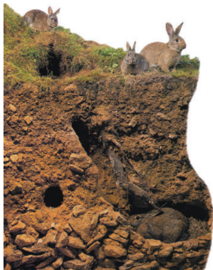
兔子洞通常位于隐秘的山坡上，洞口的周围有植物的藤蔓作为掩护。

爱丽丝一点儿也没伤着，她一下子就跳着站了起来。抬头往上看，只见头顶漆黑一片。她面前是一条长长的走廊，早先看到的那只白兔正急急忙忙地往里走。 爱丽丝一刻也没耽搁，像一阵风一样追了过去，正好听到兔子在拐角处说：“哦，我的耳朵和胡子！时间来不及了！” 当兔子转过拐角处时，