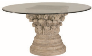
图为 19 世纪 60 年代做工精良的玻璃桌子。

爱丽丝仍然紧紧跟在它后面，但是一眨眼它就不见了。这时，爱丽丝发现自己在一个地势较低的大厅里，大厅很长，灯火通明。