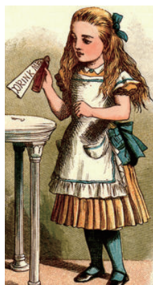
图为英国插画家约翰·坦尼尔在 1865 年绘制的爱丽丝喝缩小药水的插图。

突然，爱丽丝发现身旁有一张三条腿儿的小桌子，桌子是由坚实的玻璃做的，上面除了一把金制的小钥匙，什么也没有。爱丽丝的第一反应是：这把钥匙肯定是大厅里某一扇门上的。但是，不是锁太大，就是钥匙太小，没有一扇门打得开。当爱丽丝转悠第二趟时，她突然发现了一扇窗帘，窗帘比较低，后面有个大约十五英寸高的小门。她试着把钥匙插进锁眼，正合适，这让她高兴极了。