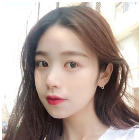
图 1-6 中景模式展现耳坠