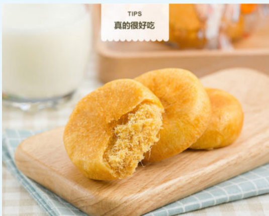
图 1-3 主体突出