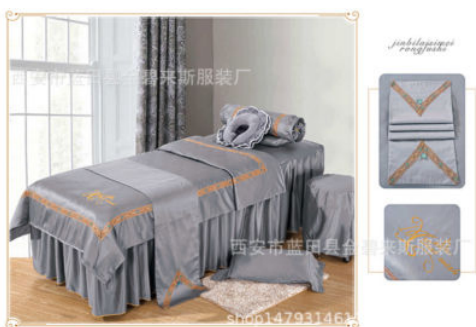
图 1-10 厂家水印效果

防盗水印对于网店图片来讲是一个重要的自我保护手段。卖家可以在原创商品图上标识个性化信息，如 logo、店名、企业名称、旺旺号等，以防止其他卖家盗取。商品图片打防盗水印时需注意水印的内容、大小、位置等，不能影响商品信息的传递，且商品主图不能带有水印标记，如图 1-10、图 1-11 所示。