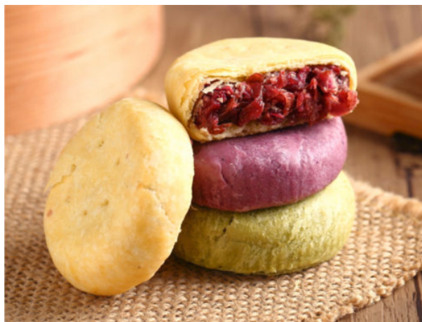
图 1-9 暖色调展示