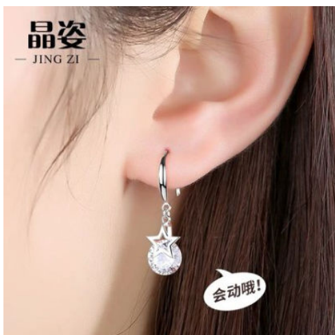
图 1-5 特写模式展示耳坠

主体物在图中所占的比例大小（即景别）要适中，因为过大会显得突兀，过小又无法展现出商品的信息，过大或过小都会造成买家对商品信息的判断失准。主体图在图中的比例要根据具体的商品信息传递要求来执行。如图 1-5 和图 1-6 所示的两张图都是耳环的模特展示图。图 1-5 采取半脸方式（景别为特写），能很好地展现出耳环的信息点；图 1-6 采用了模特头像整体图（景别为中景），其欲表达的是耳环的佩戴效果，但模特的全脸信息明显掩盖了耳环，对买家而言没有太多的商品信息传递意义。