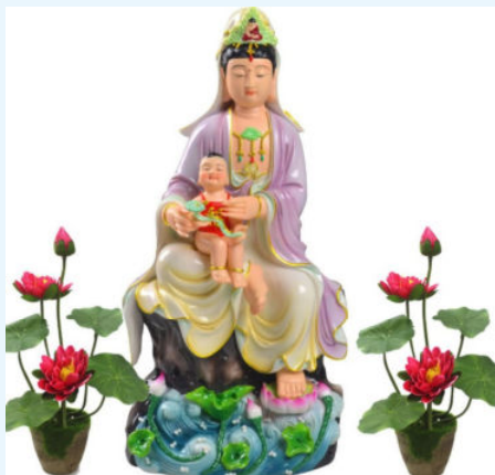
图 1-4 主体不突出