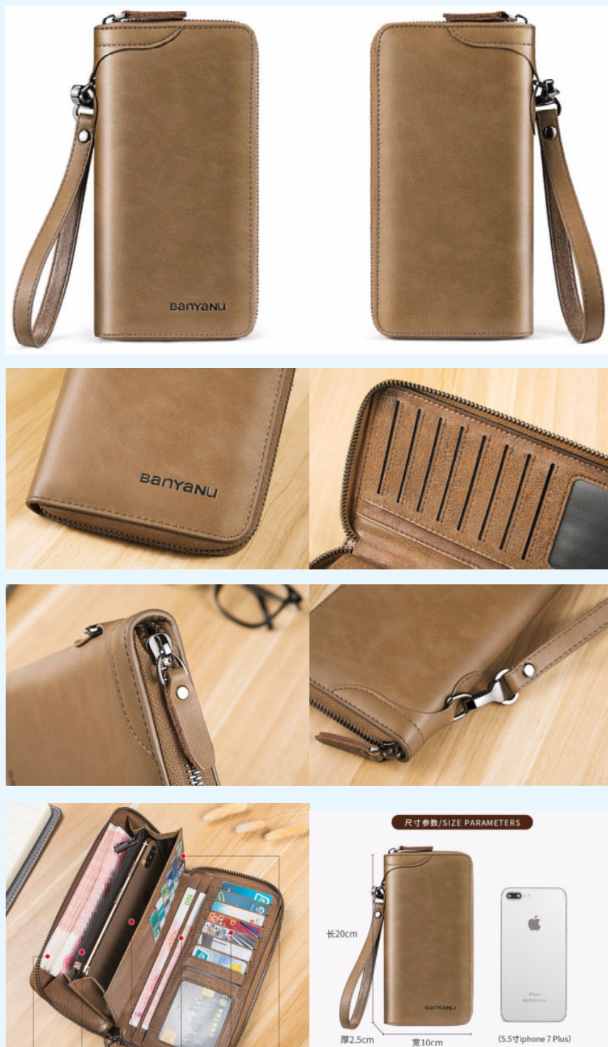
图 1-7 商品的多角度细节展示