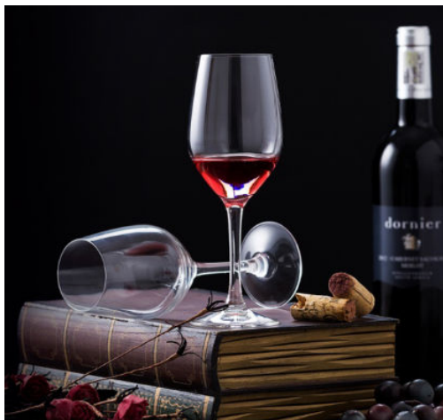
图 1-13 精心设计拍摄场景