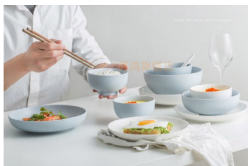
图 1-11 店铺水印效果