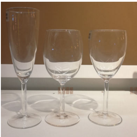
图 1-12 商品普通场景拍摄