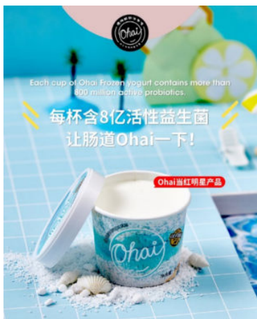
图 1-8 冷色调展示