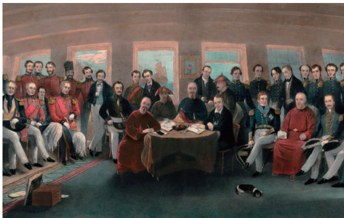
《南京条约》签约仪式

固保守，妄自尊大，主张学习和掌握别人的长技；毫不奴颜媚骨，妄自菲薄，这样一种坚定自若的民族自信和自尊的思想，这样一种炽烈的爱国主义激情，正是我们民族的精魂所在。