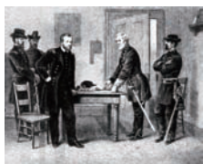
南北战争后期，南方的失败已成定局，在李与格兰特谈判后，双方的战争基本停止，军事对抗也基本结束，美国保持了统一。图为李与格兰特谈判。