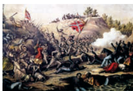
南北战争期间很多黑人积极参加北方军队，为北方的胜利做出了很大贡献，有很多人因此而牺牲。图为南方军队屠杀投降的黑人士兵。