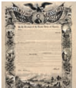
图为解放宣言。解放宣言的发表对广大黑人起了很大鼓舞作用，他们踊跃参军，增强了北方的力量。