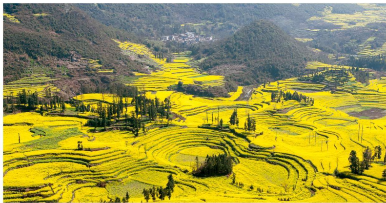
★ 罗平峰林油菜花海