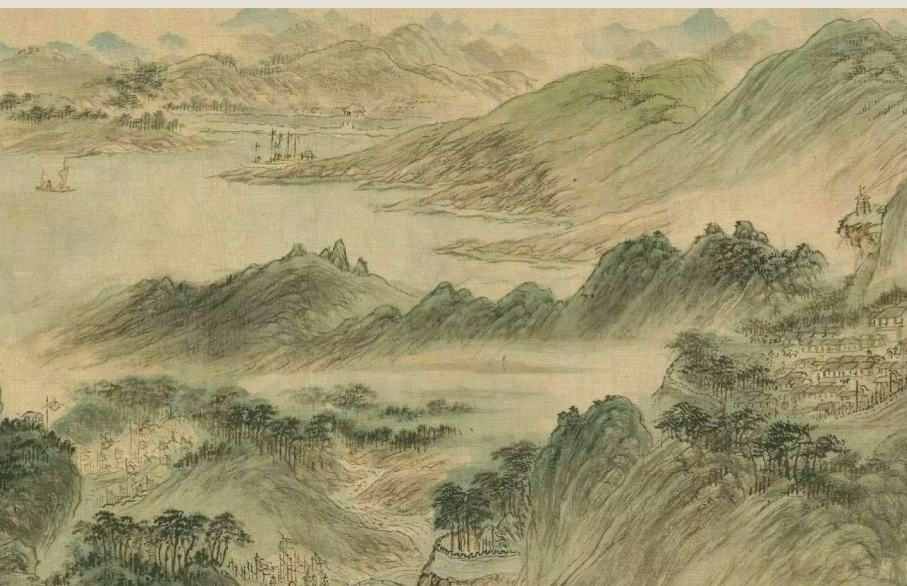
* [明] 黄尚坚