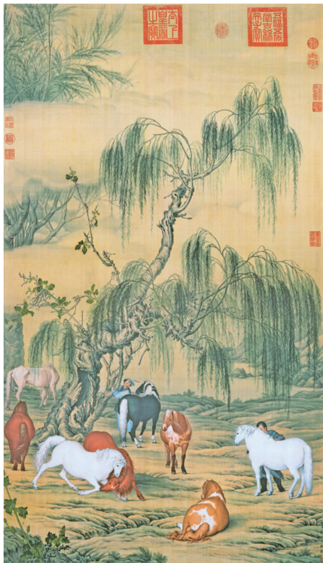
图8 〔清〕郎世宁《柳荫八骏图》