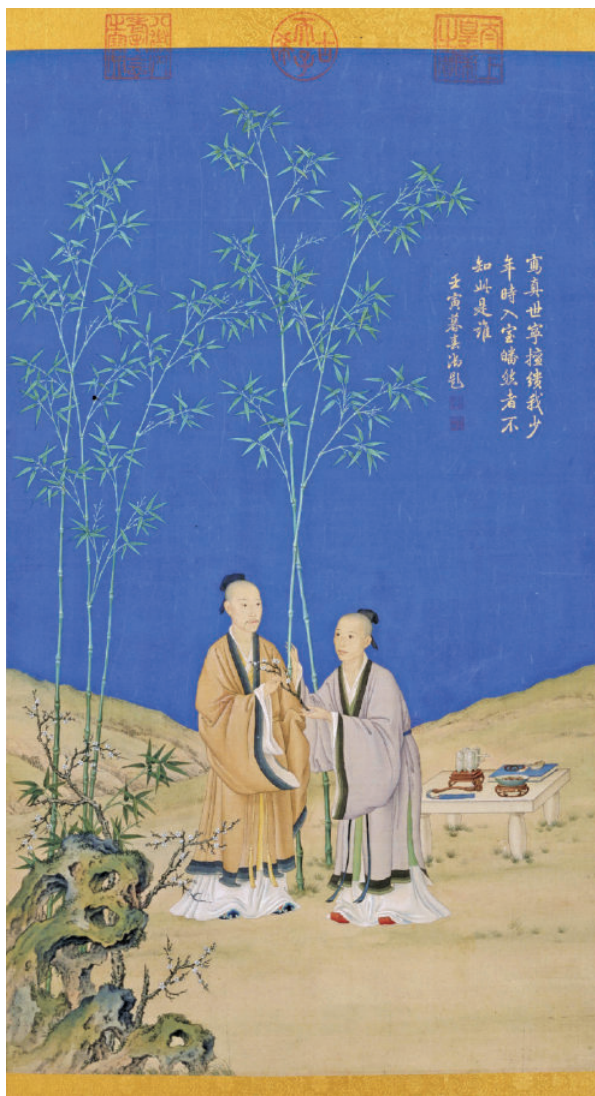
图9 〔清〕郎世宁《弘历平安春信图》轴