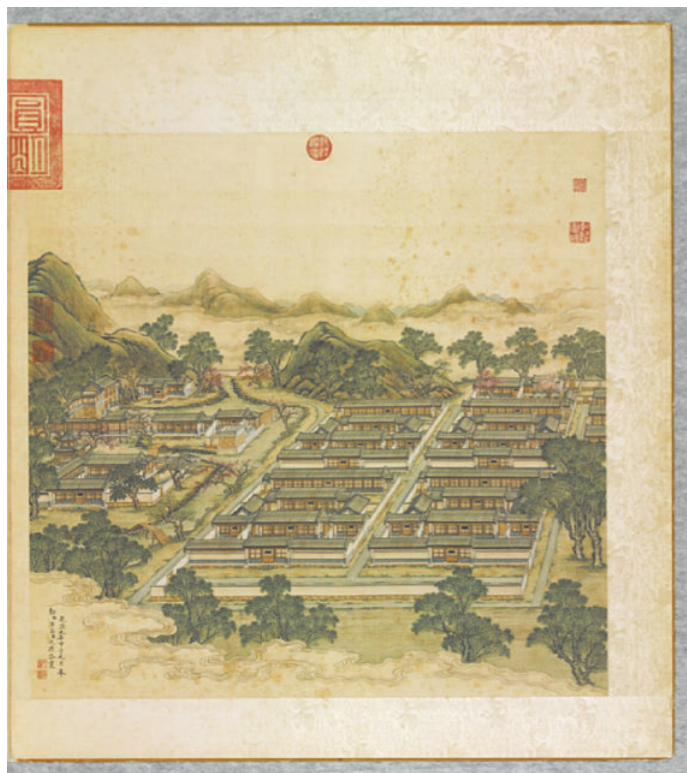
图 12 “洞天深处”，内有“如意馆”之建筑群