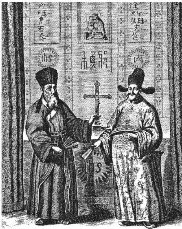
图2 利玛竇与徐光启