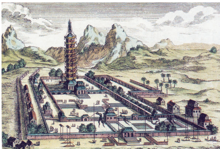
图4 纽霍夫绘南京大报恩寺塔