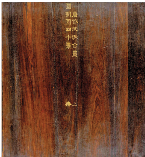
图 11 〔清〕唐岱、沈源合画，乾隆吟诗，汪由敦代书， 《圆明园四十景图咏》绢本工笔彩绘本