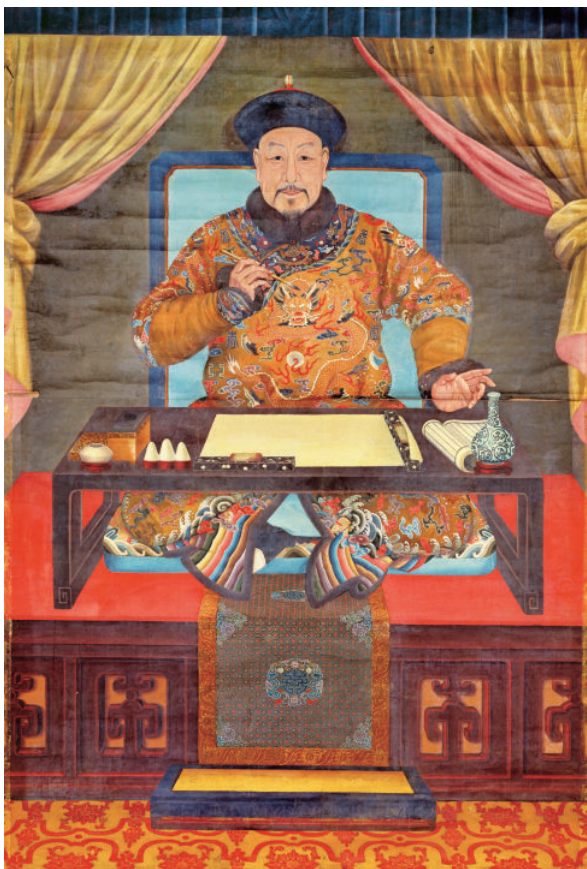
图 10 〔清〕《弘历朝服像》