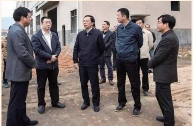
12月5日，市委书记胡世忠（前排右三）在县工业园区调研第四期标准厂房建设情况