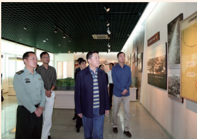
10月9日，陆军政治部主任张书国中将（前排右一）参观三湾改编纪念馆