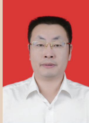
永新县人民政府县长 孙劲涛

高举中国特色社会主义伟大旗帜，以邓小平理论、“三个代表”重要思想和科学发展观为指导，深入贯彻习近平总书记系列重要讲话精神，牢牢把握“四个全面”战略布局，认真落实中央、省市和县委决策部署，紧紧抓住罗霄山片区扶贫开发、国家重点生态功能区等重要战略机遇，围绕同步全面小康目标，不忘初心、继续前进，落实“五大发展理念”，坚持“三个走在前列”，以加快绿色崛起为主线，加快发展、加快脱贫，强化改革攻坚，强化创新驱动，强化责任担当，大力实施“产业升级、城乡一体、生态先行、合作共赢、民生固本”五大战略，为全面建成开放文明美丽小康新永新而接续奋斗！