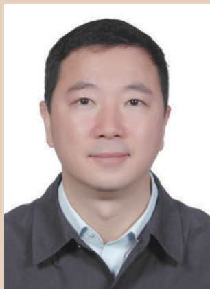
中共永新县委书记 肖兵

高举中国特色社会主义伟大旗帜，以邓小平理论、“三个代表”重要思想和科学发展观为指导，深入贯彻习近平总书记系列重要讲话精神，牢牢把握“四个全面”战略布局，紧紧抓住罗霄山片区扶贫开发、国家重点生态功能区等重要战略机遇，围绕同步全面小康目标，不忘初心、继续前进，落实“五大发展理念”，紧扣“绿富美”发展主题，实施“产业升级、城乡一体、生态先行、合作共赢、民生固本”五大战略，纵深推进“四新永新”建设，为全面建成开放文明美丽小康新永新而接续奋斗！