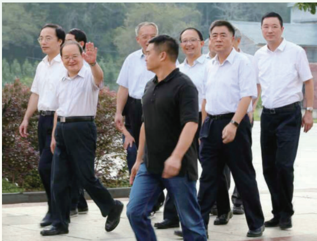
9月11日，省委书记鹿心社（前排中间）在县调研“两学一做”学习教育和脱贫攻坚工作