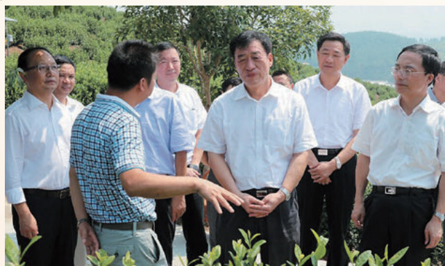
9月25日，省委副书记、代省长刘奇（前排中间）在县调研