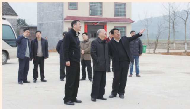
2月25日，省委常委、省纪委书记周泽民（前排中间）在县调研