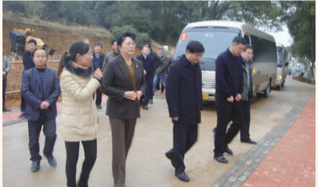
1月14日，省人大常委会副主任、党组书记洪礼和（前排左三）在莲洲乡钱溪村“安居家园”进行精准扶贫走访慰问