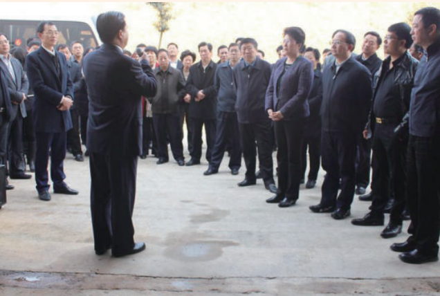
2月20日，市委书记王萍（前排右四），市委副书记、市长王少玄（前排右三）率全市“看特色 看变化”流动现场会与会人员，在县工业园区检阅县工业经济发展情况