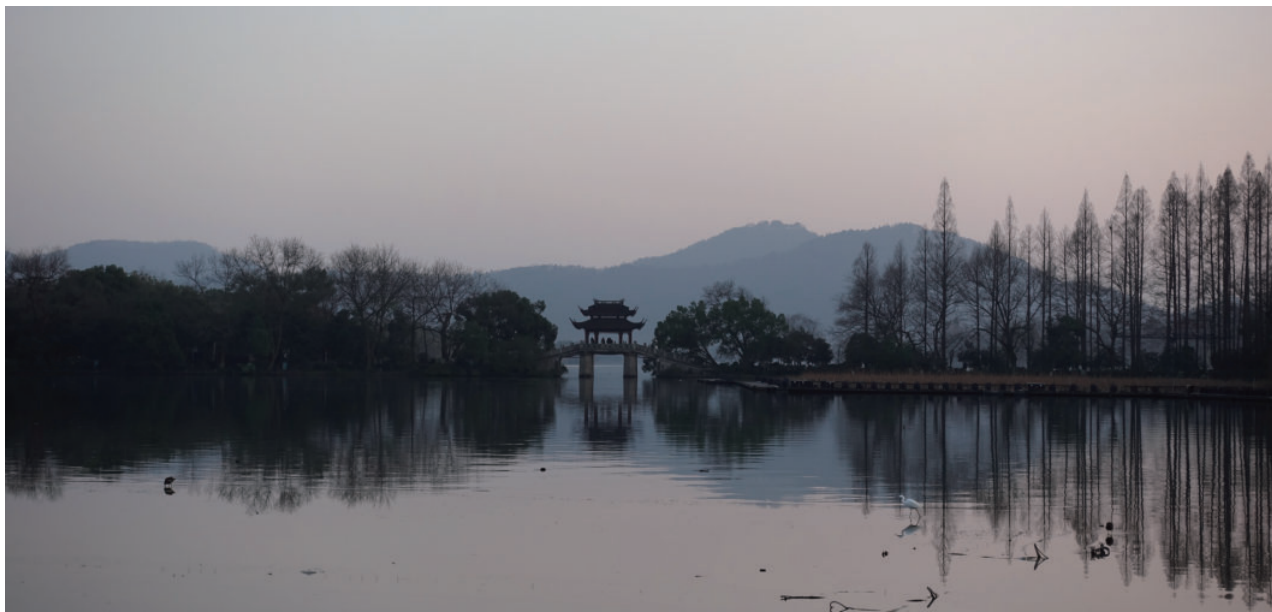
图 1-3 杭州西湖

如站在逻辑角度去分析，西湖十景在类型上山景为主，水景为辅，比例上三成山景，七成水景，无比契合西湖的风景特征。山景中峰、谷、寺、塔等元素相互组合，水景中两堤、一岛、四园从类型、位置、元素、形态、特征等方面勾勒出西湖的整体空间格局。其不仅具有从景观特征出发去构建景区结构、塑造布局特色、创造景点构成的逻辑体系，也具有将自然景致、气候天象、人文意象及四季风情进行有机融合的逻辑体系（表 1-1，图 1-5）。