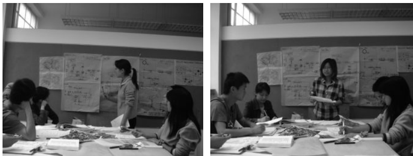
图 1-1 从教学环节与过程来讲，课程设计的完成均是逻辑思维指导下的形象表达过程

笔者从读大学算起，接触和学习风景园林已近 30 年，从学生到教师，在多年的风景园林学习和教学中，从教学角度思考，面对一个以理科生身份进入大学，选择了风景园林这一兼具文学、艺术和工学特征专业的学生，该如何去开展教学活动？从多年的教学经验看，应该还是逻辑优先，首先需要为学生解释相关风景园林是什么、为什么、如何做的问题，才能进行诗意的畅想与拓展，这是符合本科专业教育的教学规律的。当然两者在不同课程与课题的教学过程中也往往是相互交叉的。如基础设计对光影、色彩等的思考与创作，逻辑分析与意象创作相互推进；古典园林设计中优先进行为谁设计、什么状态与心绪、具体空间使用与形态等的逻辑探索，再进行立意、布局、景点设计等；景观详细规划中的策划是无限的畅想，规划则又是逻辑思维的层构表达；总体规划对资源的定性分析和定量分析、对景区的总体定位也无不体现逻辑与诗意的思辨哲理（图 1-1、图 1-2）。而实际风景园林工程项目从创意到落地建成，也是一个逻辑与诗意不断转换的过程。