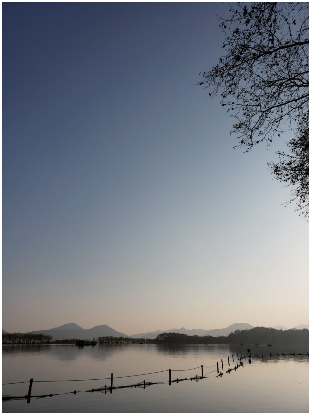
图 1-4 杭州西湖