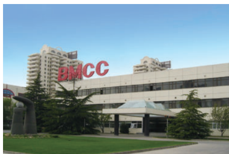
1987年，松下在中国大陆成立第一家合资企业 北京·松下彩色显象管有限公司