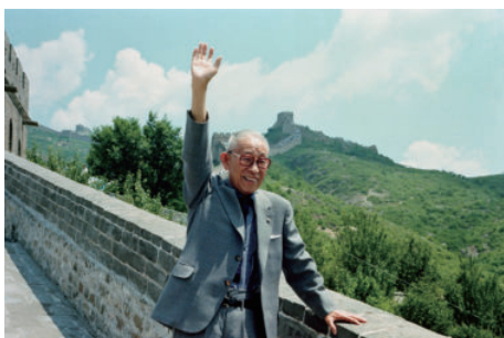
创业者松下幸之助先生