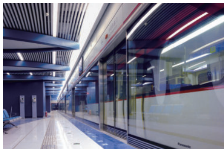
2008 年北京机场线应用松下屏蔽门