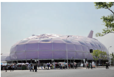
2010 年向上海世博会日本馆提供最新技术支持