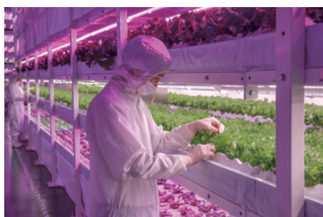
2014 年松下中国农业事业启动