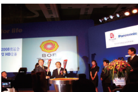
松下全力支持北京 2008 年奥运会，北京奥运会 全面采用 Panasonic P2HD 高清半导体存储卡 系列广播电视转播设备