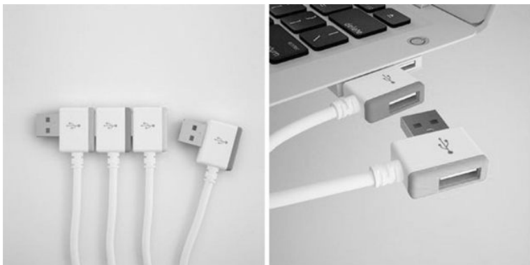
图 1-2 德国 IF 国际工业设计大奖作品

息、交互等方面。随着近几年工业设计的发展,工业设计还应包括对产品开发系统中的整体要素进行把握,这包括从产品开发初期到产品生命周期的终结,以及后续产品的研发,还包括产品市场开发、售前、售后服务等等,如今的工业设计不再单单指对产品的造型进行设计,其内容更加丰富完善。