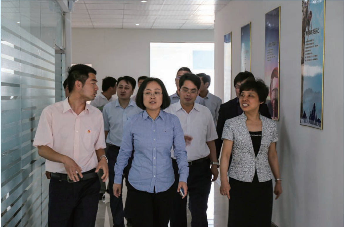
共青团湖北省委书记张桂华（中）一行到英山县大学生创业孵化基地视察调研