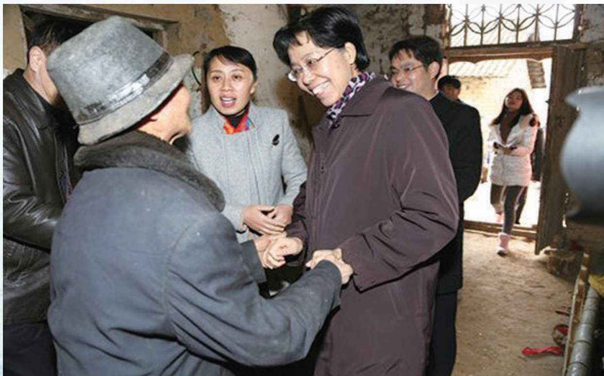
湖北省高级人民法院党组书记、院长李静慰问英山贫困户