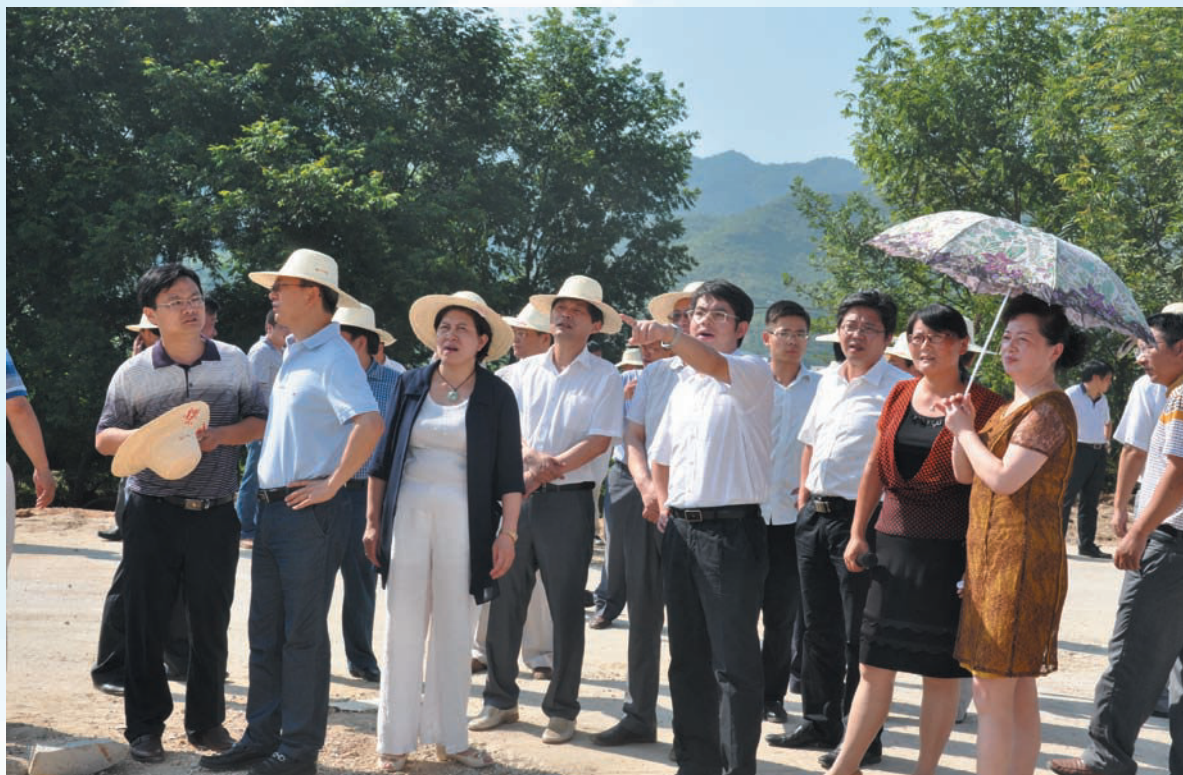
7月28日，县四大家领导视察南河洪灾灾情