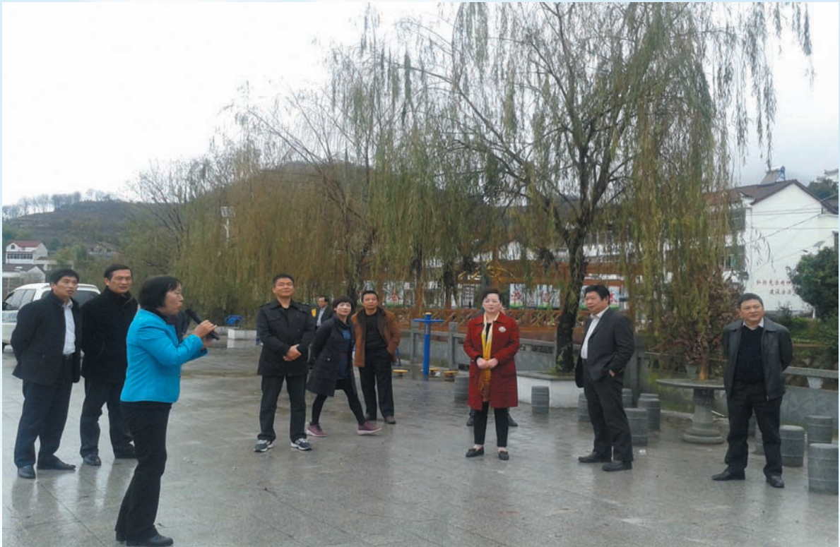
11月20日，市人大常委会部分领导在温泉镇百丈河村视察美丽乡村和休闲农业建设情况