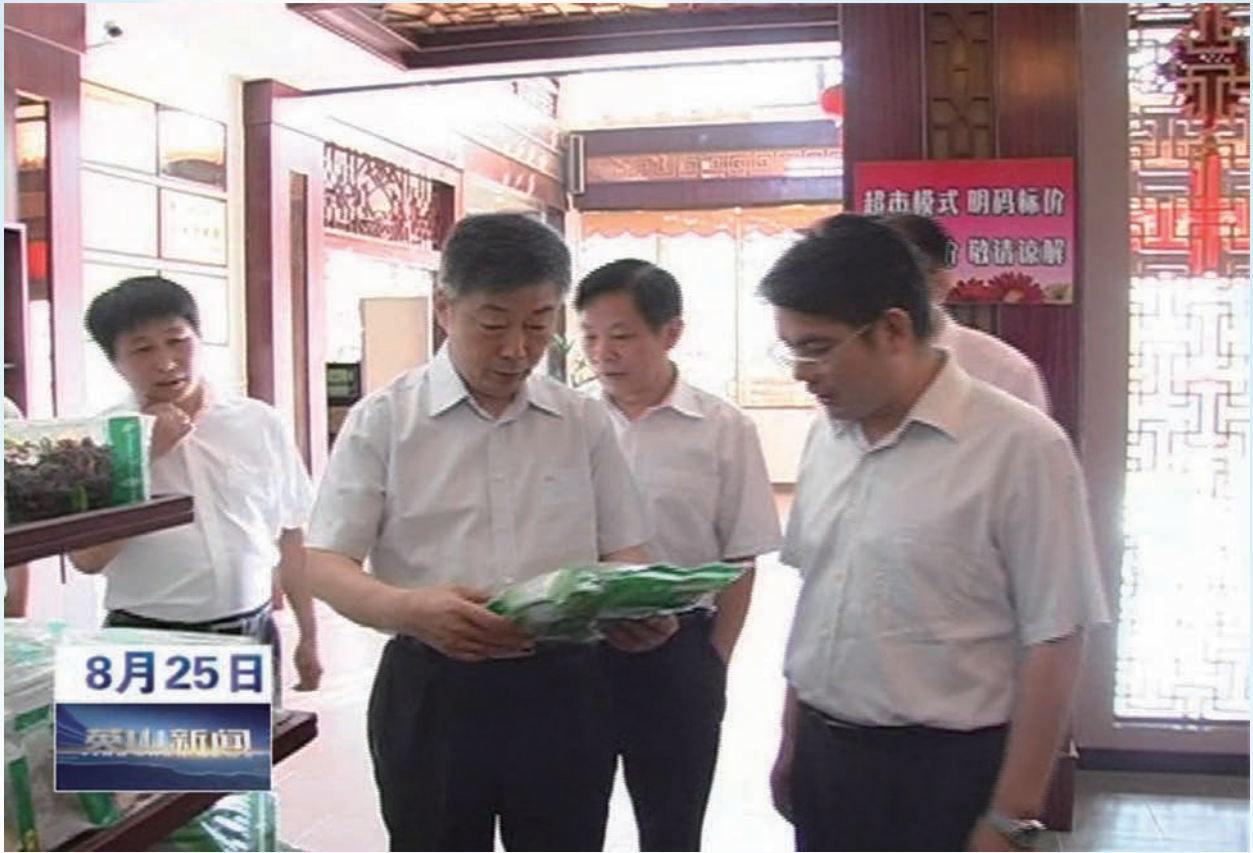
湖北省政协副主席肖旭明在英山调研