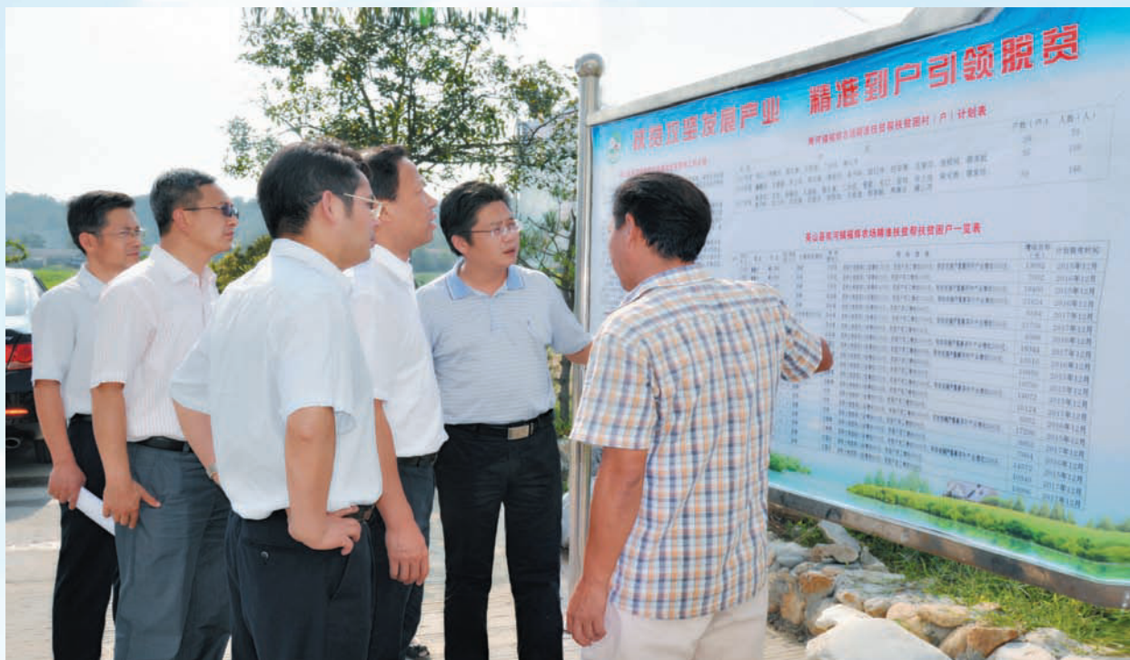
黄冈市市委书记刘雪荣（右三）在福辉农场调研精准扶贫工作