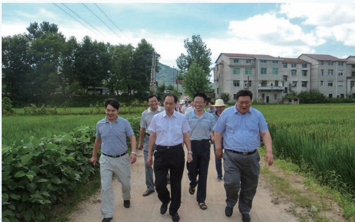
湖北省农业厅厅长戴贵洲考察英山农业高效示范基地建设情况（前排左起陈武斌、戴贵洲、王浩明）