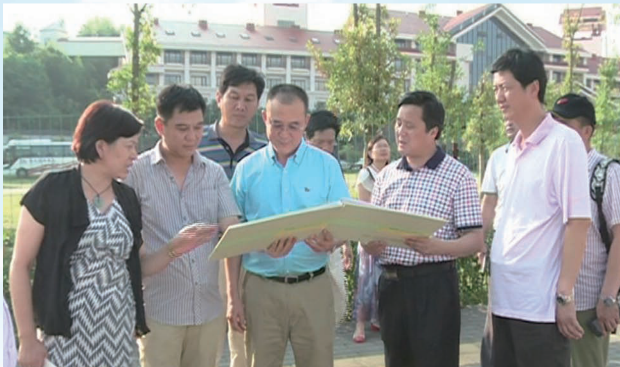
国家新闻出版广电总局研究院院长吕松山（中）在英山调研