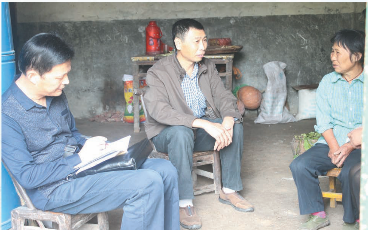
扶贫干部走访精准扶贫对象户