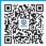
大连出版社官方微信

长篇童话《蓝皮鼠和大脸猫》《小糊涂神儿》《小精灵灰豆儿》等被中央电视台拍摄成系列动画片,多次获得金鹰奖、金童奖。