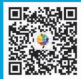
中国幻想儿童文学网