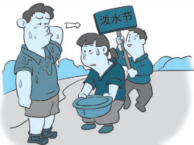
图 2-1 小白在泼水节上收到他人的祝福

假期，小白和小荷去傣族村旅游，绵延不绝的绿色森林和傣家风格的房屋让两人赞叹不已。