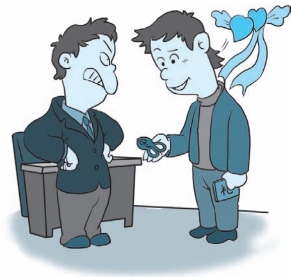
图 1-5 赠送剪刀，收礼者面露不悦