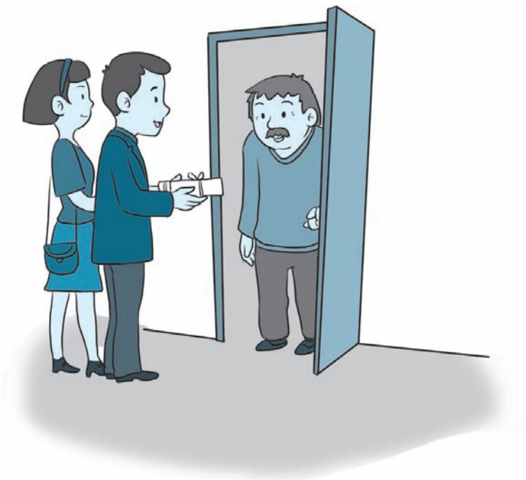
图 1-2 登门拜访时，双手奉上礼物

其是农历春节。每年端午节，澳门人都会在新口岸海、水塘角海面等地举行龙舟竞渡，每年的比赛都会吸引亚洲、欧洲、美洲等地区的多个国家参与，十分隆重。