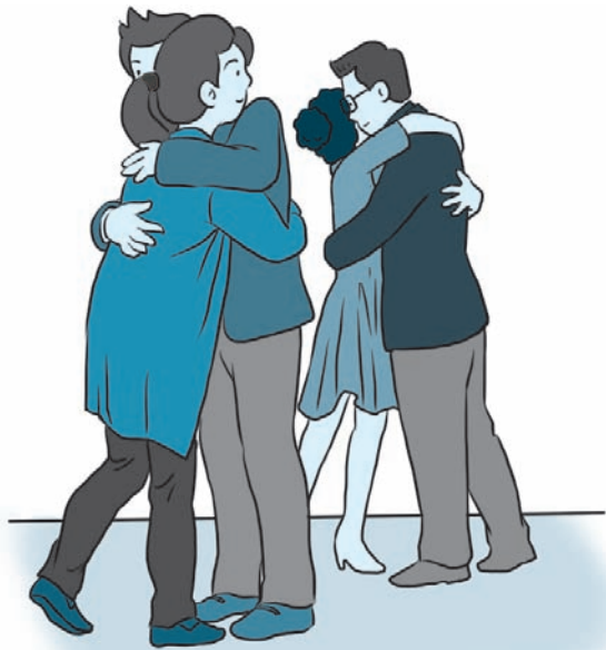
图 1-3 亲朋好友间行拥抱礼

奉上。主人宴请宾客通常是在饭店，台湾的饭菜极其丰盛，一顿饭可能有 20 道菜。接受宴请后，客人通常会写一封感谢信，向主人表达谢意。