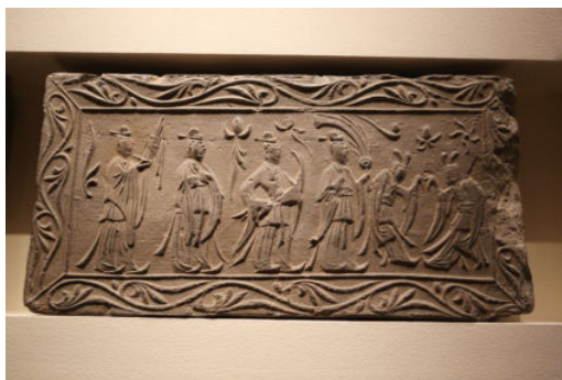
▲ 南朝画像砖：礼乐图

强调礼、乐、伦常，表面看是维护周礼，实则是希望君民各守其位，稳定社会秩序。强调“尊尊”（尊重应该尊重的人）、“亲亲”（亲近应该亲近的人）、“君君”（君主要有君主的样子）、“臣臣”（臣子要有臣子的样子）等“伦常”关系，强调各种礼仪制度等，都是在通过“正名”即道德教化的方法，让社会各阶层的人对自己的社会地位有清醒的认识和定位。所以，礼、乐、伦常是封建统治者稳定社会秩序的重要形式和手段。