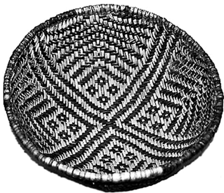
大约公元450—750年间阿纳萨齐人的编筐

在今日美国科罗拉多州西南角的梅萨维德国家公园,可看到约有4300处普韦布洛印第安人居住地遗址,有平原村庄和悬崖房屋。平原村庄大多是在公元550—1300年间建造的,悬崖房屋的建造则稍晚,大约起始于公元1200年。遗址内大约有600多处是用石头在悬崖凹进的地方垒砌起来的,崖壁上还能看到印第安人留下的岩壁雕刻。1276—1299年间,普韦布洛人遭遇干旱与饥荒,许多人被迫移居他乡。