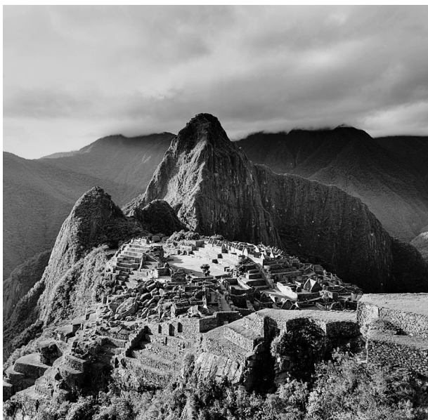
马丘比丘古遗址 战争是印加人的常态,但战歇时印加人也不忘建设。图为 1911 年发现的被称为印加帝国“失落之城”的古遗址马丘比丘。马丘比丘意为“古老的山巅”,建于 1460 年左右,坐落在海拔 2400 米安第斯山脉南坡陡峭而狭窄的山脊上,面积有 9 万平方米。城内约有 200 座建筑,功能格局分布明确,有神庙、宫殿、堡垒、民宅、街道、广场、水利设施等。建筑多用巨石垒砌而成,大小石块对缝严密,不用灰浆等黏合物。