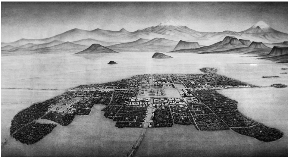
特诺奇提特兰古都遗址

宗教在阿兹特克人生活中占有重要地位,他们相信灵魂永存,相信至高无上的主宰的存在,崇拜自然神,国王被看成神的化身。阿兹特克人修建神庙,举行隆重的宗教仪式。他们相信神在造人时作出了牺牲,人也要为神作