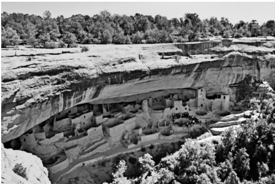
梅萨维德国家公园的悬崖宫殿遗址

梅萨维德国家公园的悬崖宫殿是公园内最壮观的一处遗址,代表普韦布洛印第安人的建筑成就。