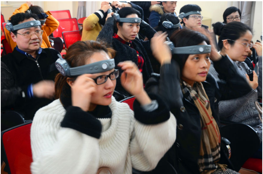
好奇“玩童”,玩转实验室: 探访普陀区教育学院