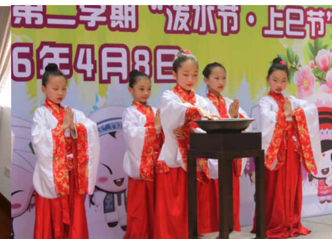
民俗节庆活动：三月三女儿节