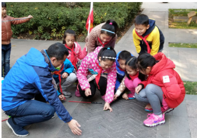
社会实践活动：弄堂里的“花样经”