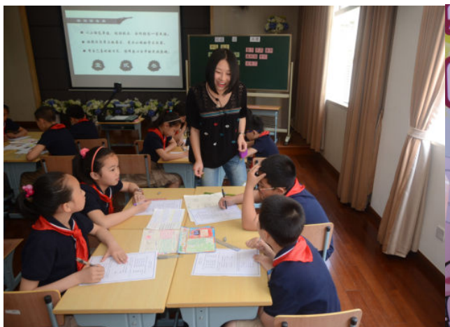
民俗文化渗透基础性课程研究课：四年级语文课《民谣话英雄》