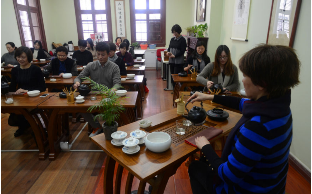
走进社区学校,共筑精神家园: 走进长寿社区文化活动中心