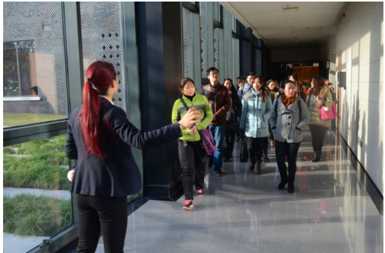
文化墨旅,嘉图访书:游学嘉定区图书馆