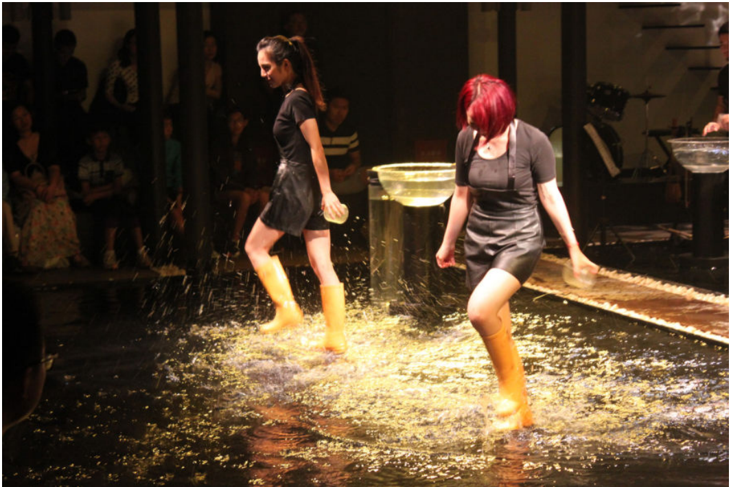
梦里水乡,醉美江南:寻梦上海朱家角古镇