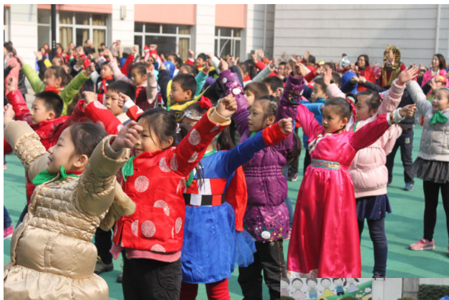
民俗节庆活动：东西方迎新文化节