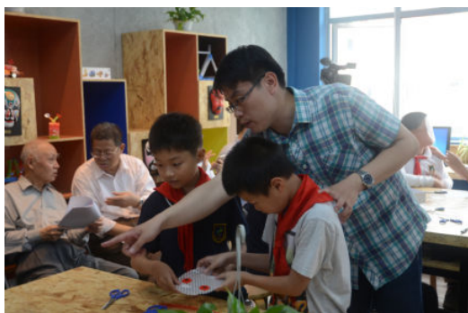
民俗文化创新探究型课程研究课：国粹智能实验室课程《花旦》