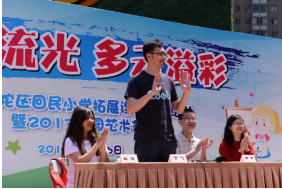
拓展课程展示暨校园艺术节活动