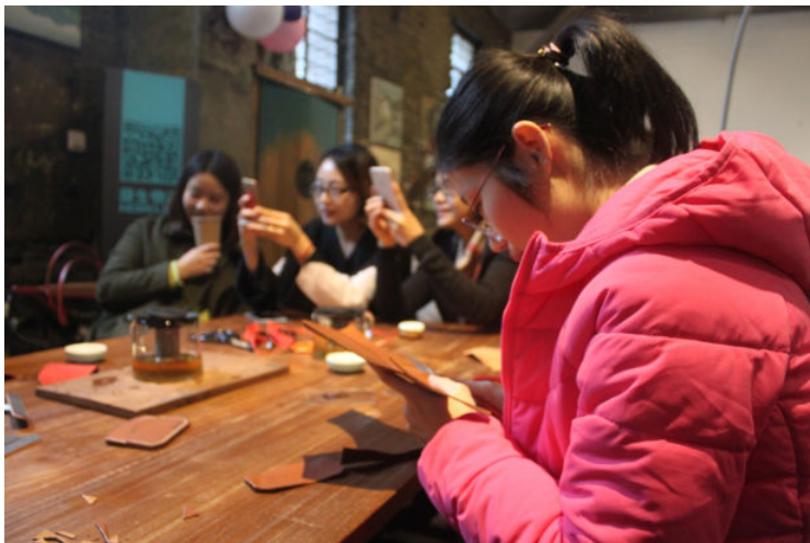
捧一颗匠心,做一回匠人:体验“漫生快活”创意生活馆