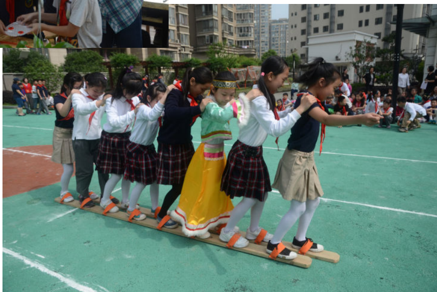
民俗文化融入拓展型课程研究课：体育拓展课《玩转华夏》