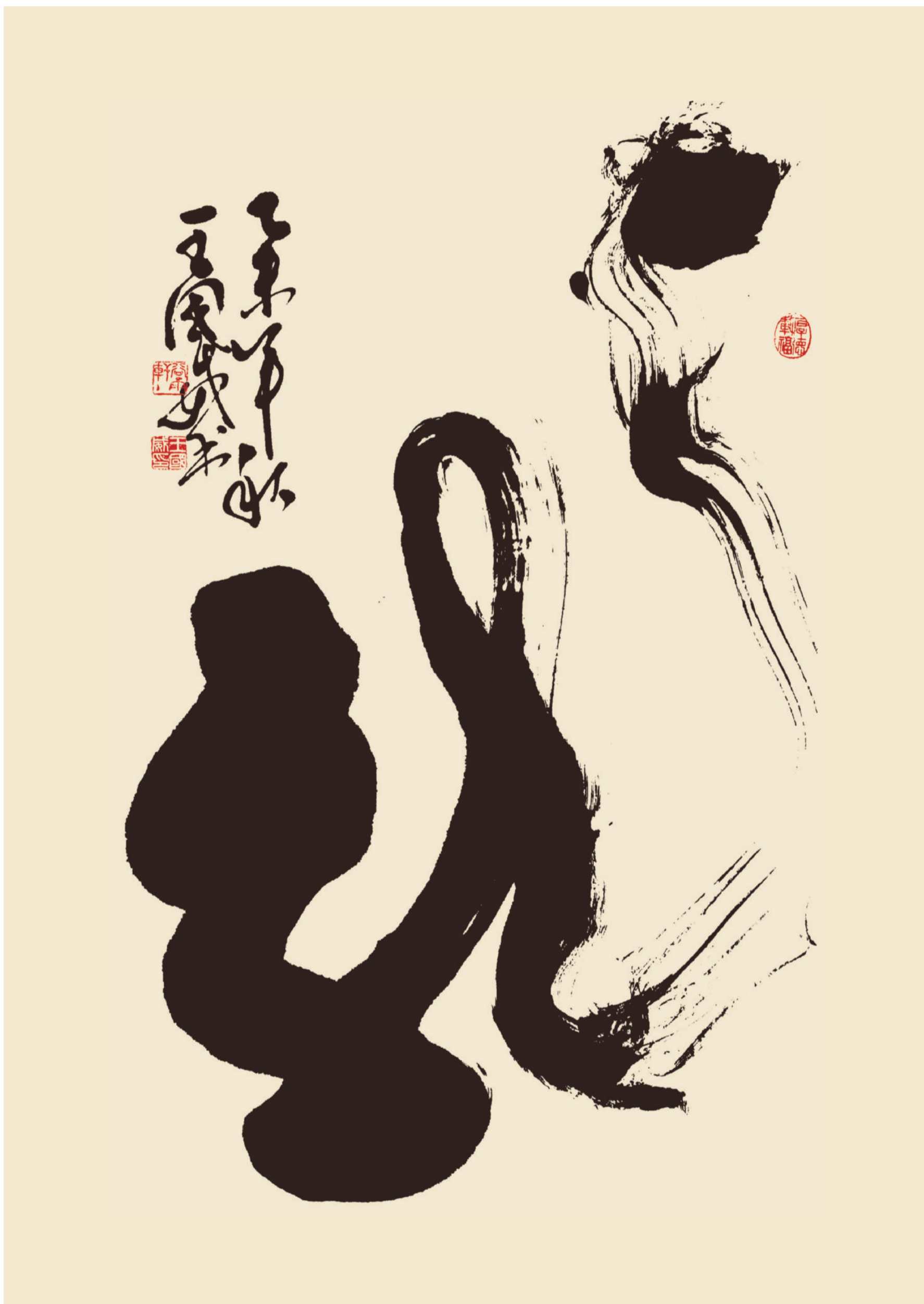
作品規格：138cm × 69cm