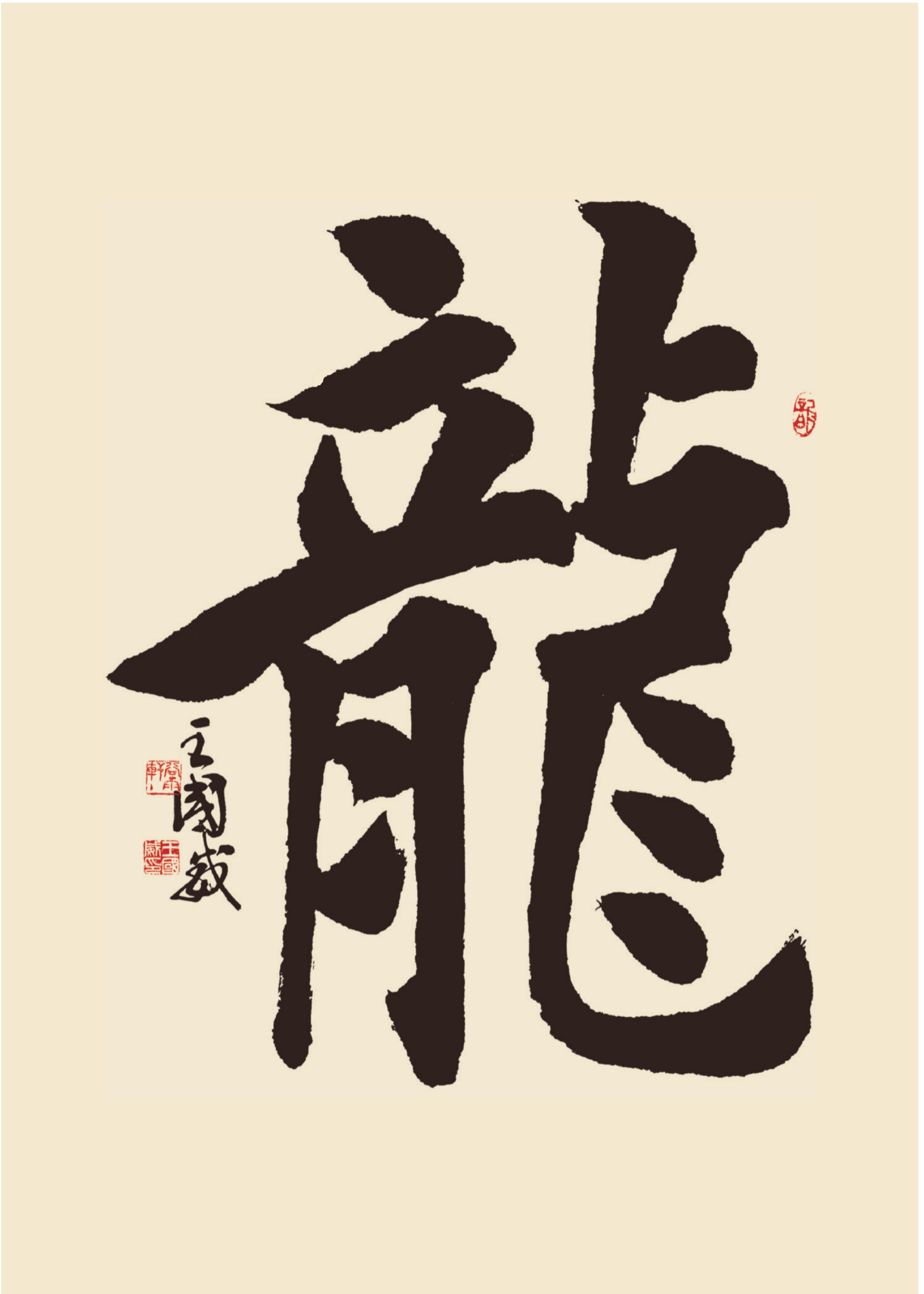
作品規格：138cm × 69cm