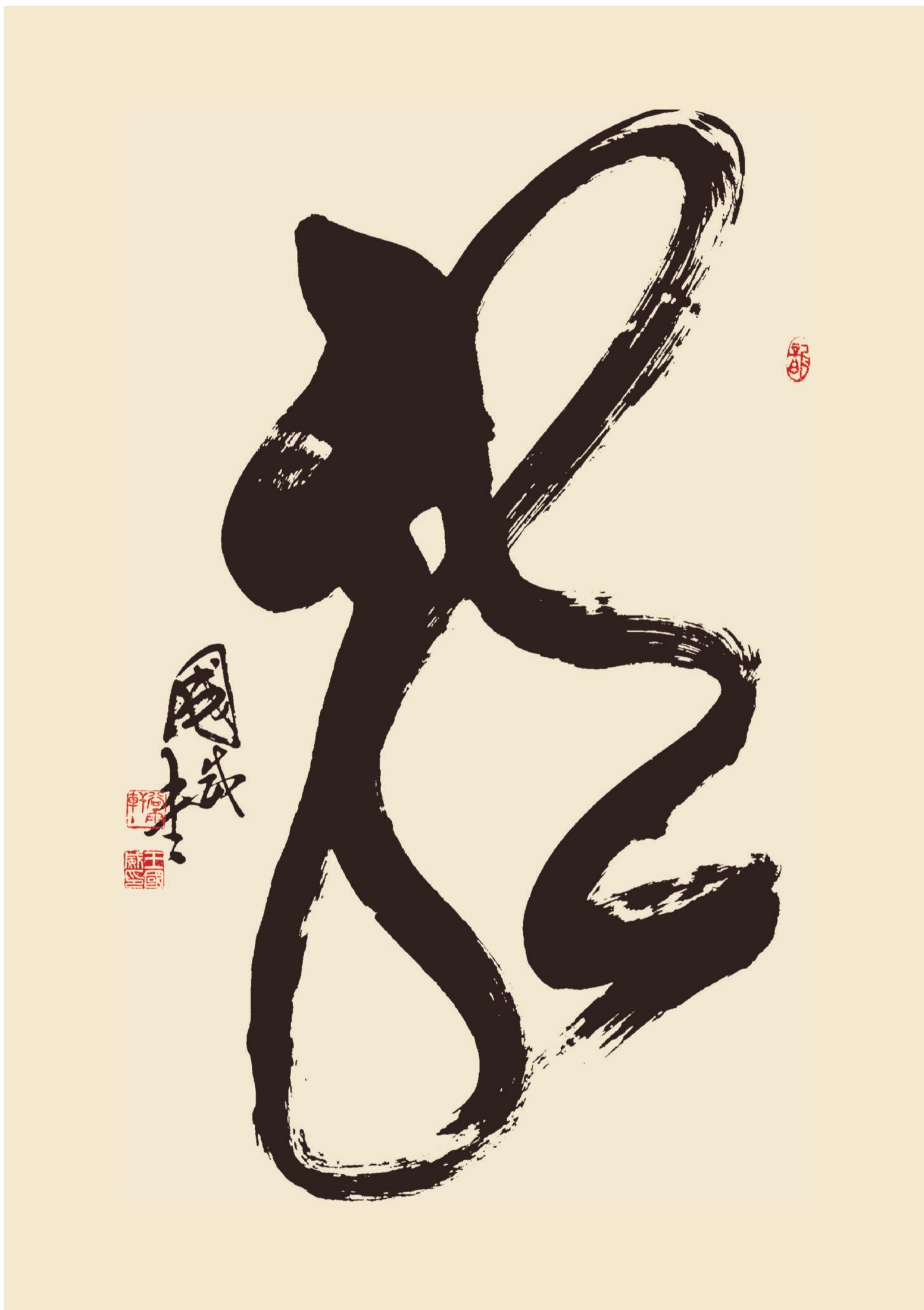
作品規格：138cm × 69cm