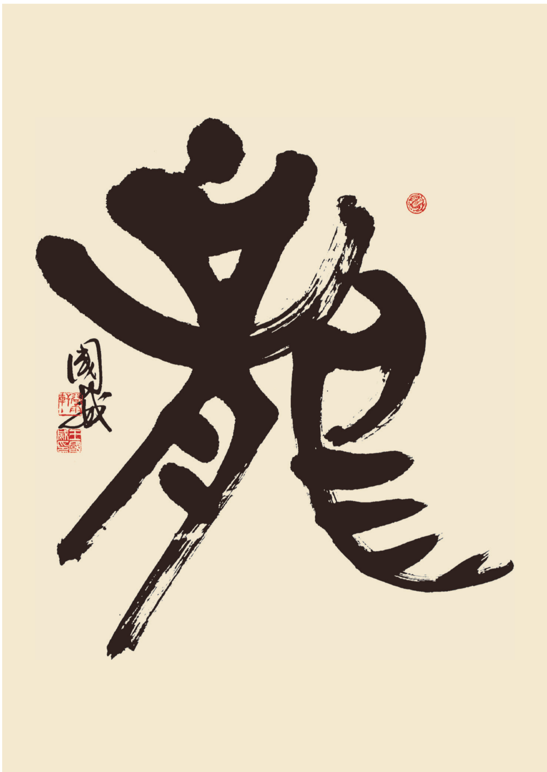
作品規格：138cm × 69cm