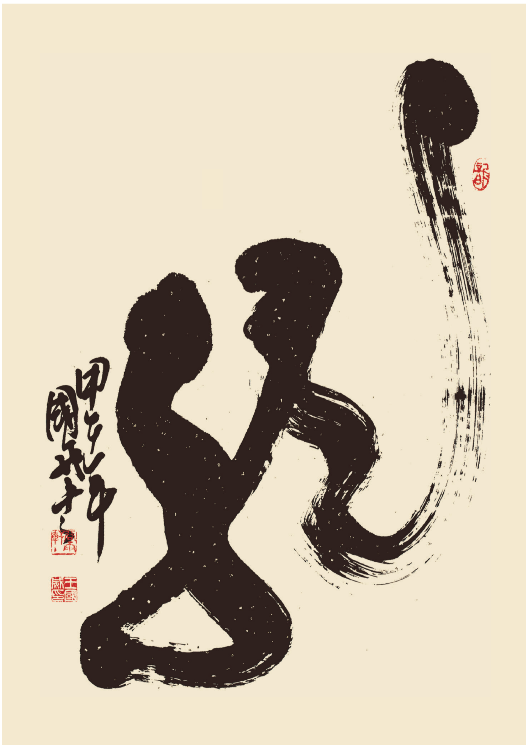
作品規格：138cm × 69cm