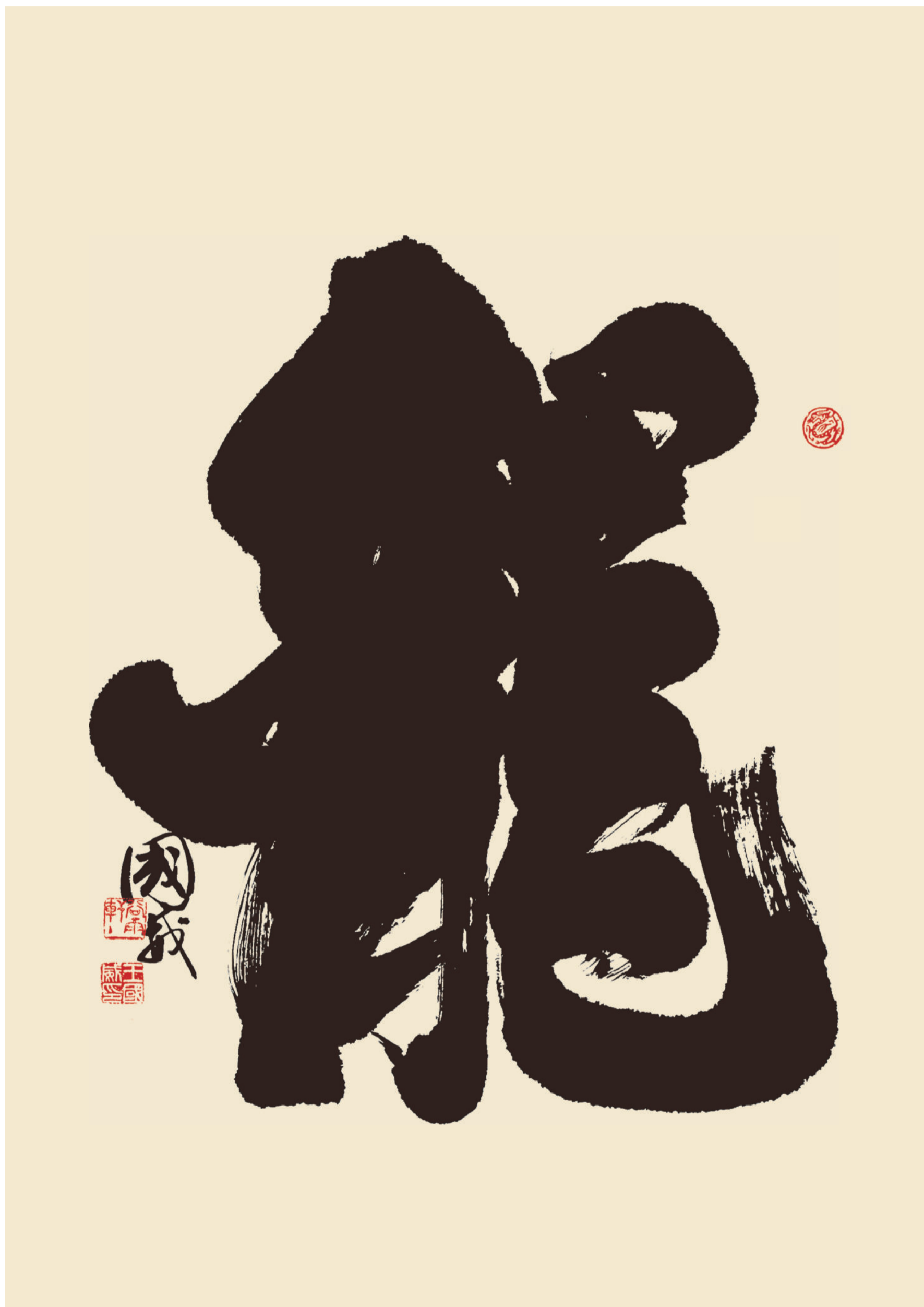
作品規格：138cm × 69cm