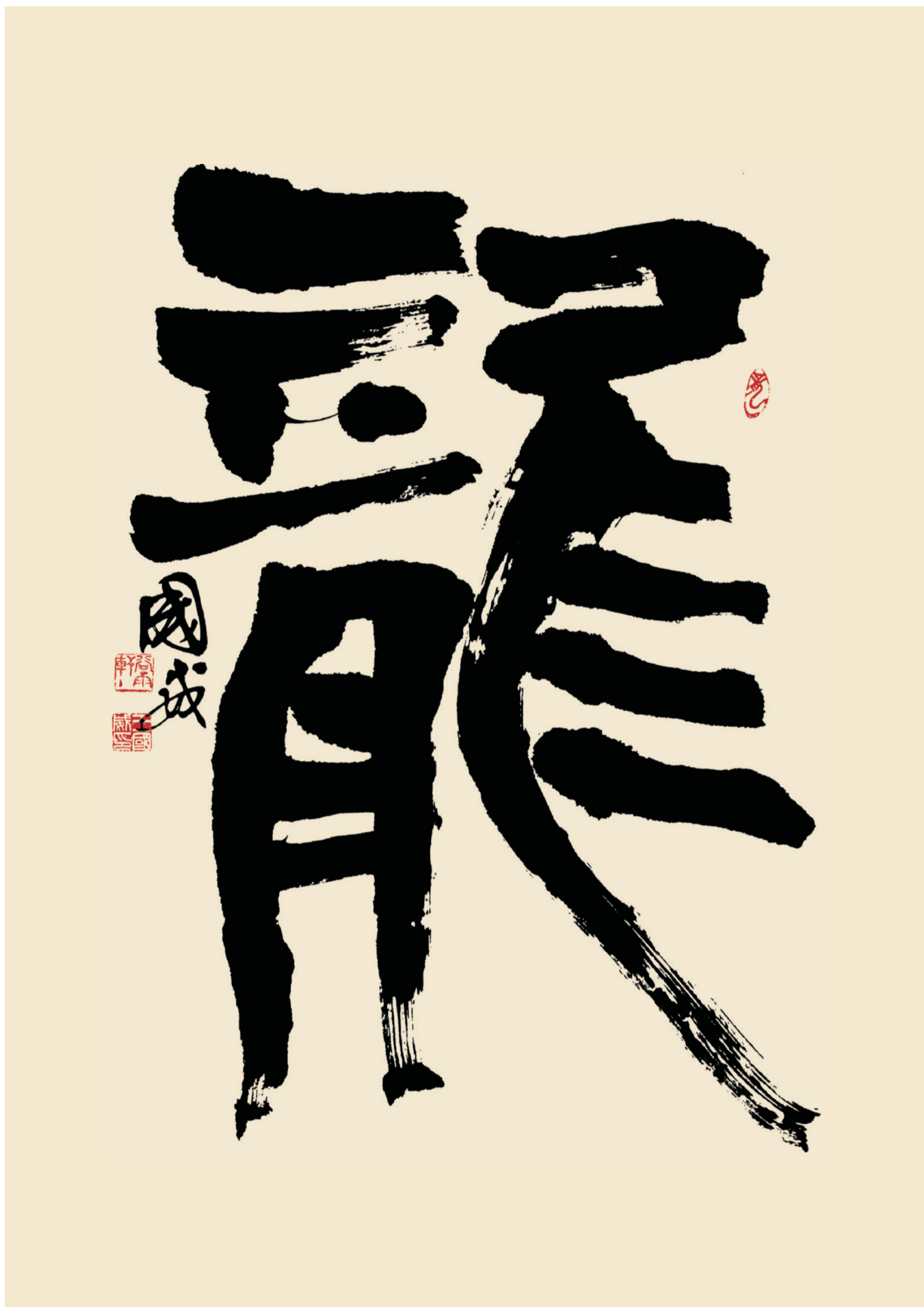
作品規格：138cm × 69cm