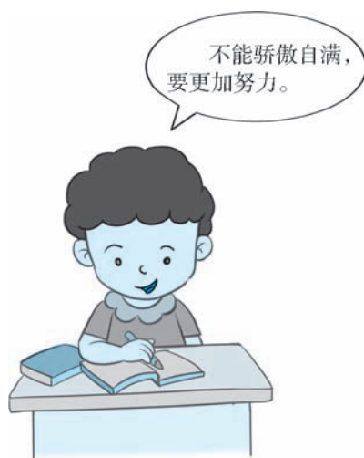
图 2-5 认真做作业

逢人多说赞美语，寒冬也成三春暖。 夸赞他人讲分寸，言出肺腑表真情。 受到表扬不骄纵，勤恳谦虚再努力。