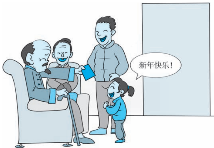
图 1-2 拜年

贺词用于事情发生之后，表达喜悦和庆贺，比如：“生日快乐”，“新婚快乐”，“新年快乐”。