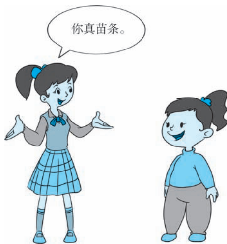
图 2-2 赞美时应注意分寸

赞美要发自真心，寻找对方引以为豪的优点。一位女同学每天为自己的内向保守而苦恼，假如你赞美她文静淑女，她一定高兴不起来。