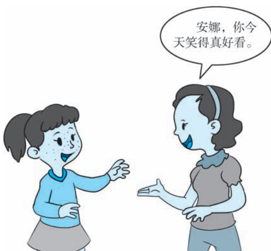
图 2-1 夸奖