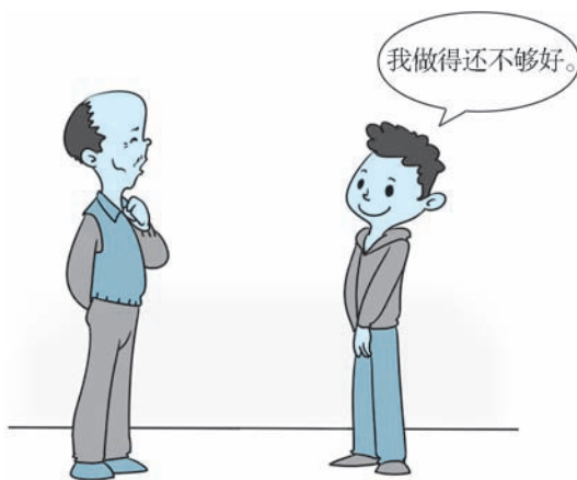
图 2-3 回应赞美也是一门艺术