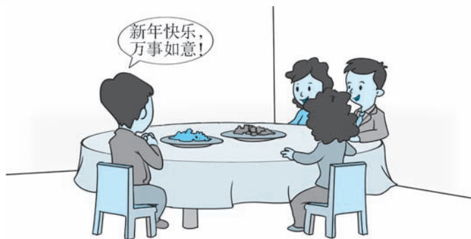
图 1-3 饭桌上的新年祝福

祝贺用语的使用范围非常广泛，例如诞辰、结婚、开业仪式等。在别人获得某项荣誉时，也应送上自己的美好祝愿。祝贺长辈时，应该持恭敬端庄的态度。