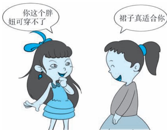
图 2-4 小乐和余珊