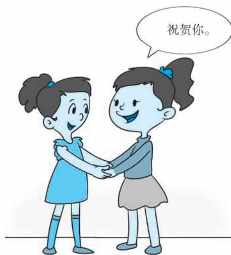
图 1-1 手拉手