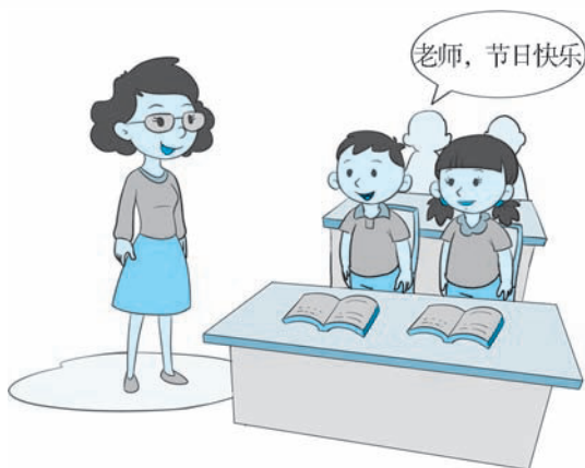
图 1-4 教师节