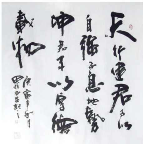
《天行健，君子以自强不息》书法作品