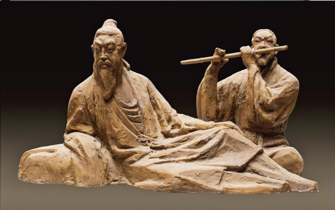
《听笛》 玻璃钢 高 36 cm 2010 年