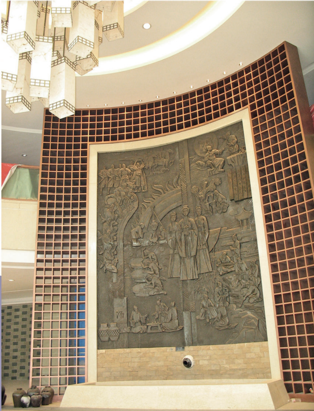
《酒的传说》 玻璃钢仿铜 720 cm × 600 cm 2012 年

浮雕雕刻投醪出征、流觞曲水等酒文化传说故事,体现了酒文化博物馆的主题思想。浮雕高7.2米,弧形饰面与共享空间相融。