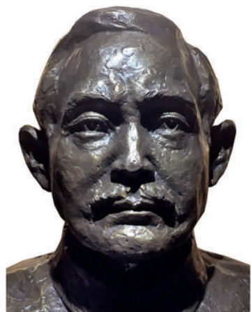
《民主革命先驱 孙中山》 青铜 80 cm × 70 cm 2016 年