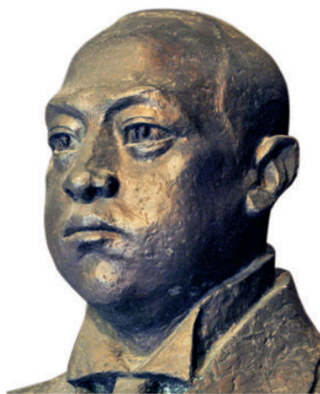
《辛亥英烈 陶成章》 青铜 80 cm × 70 cm 2002 年