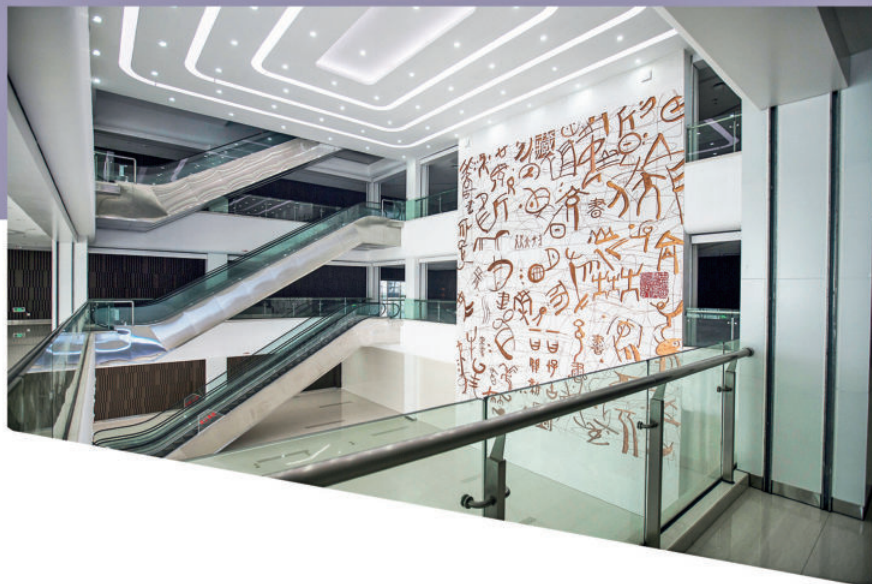
《天书》 大理石 1300 cm × 918 cm 2014年