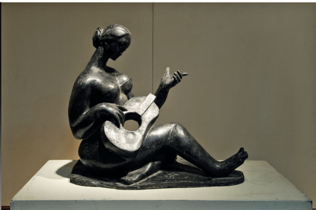
《心声》 高 100 cm 玻璃钢 1991 年