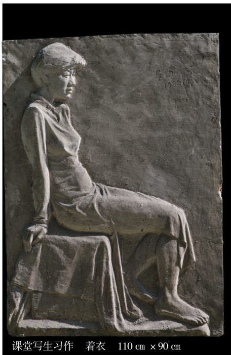
课堂写生习作 穿衣 110 cm × 90 cm

与此同时还应邀承接多个颇具影响的景观规划设计项目。按理已进入炉火纯青期，做起项目来理应轻车熟路，轻松些了，但我面对新的创作项目时，仍然会非常努力地去，总感觉是社会赋予的一份责任和使命，因每一件作品都比我的生命要长，将会永远地展现在公众面前接受评判，人们总是要求公共艺术的完美性，就像每个人都希望自己的人生完美一样是一件相当重大的事件，我不敢怠慢，总是全身心投入去做好它，达到完美。而当我面对学生时，总是想：我的教学将会直接影响学生的人生轨迹，责任重如泰山啊，因此，没有理由不努力。我想只有这样，也许艺术之树才会常青不衰，才有可能达到成功的彼岸。