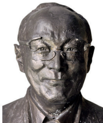
《著名科学家 徐光宪》 青铜 70 cm × 65 cm 2013 年