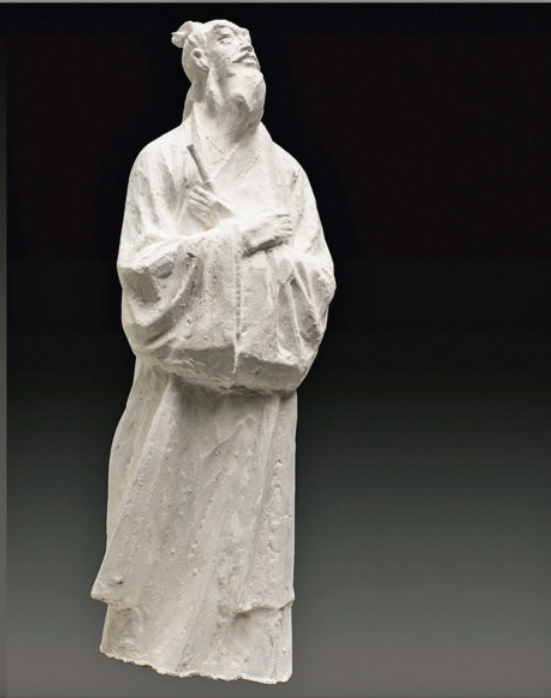
《蔡邕》 玻璃钢 高 44 cm 2010 年