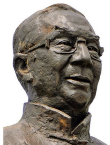
《爱国侨胞 张杰》 青铜 70 cm × 65 cm 2010 年