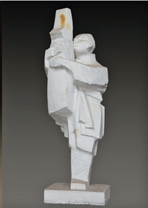
《少林小子》 石膏 高 44 cm 2010 年