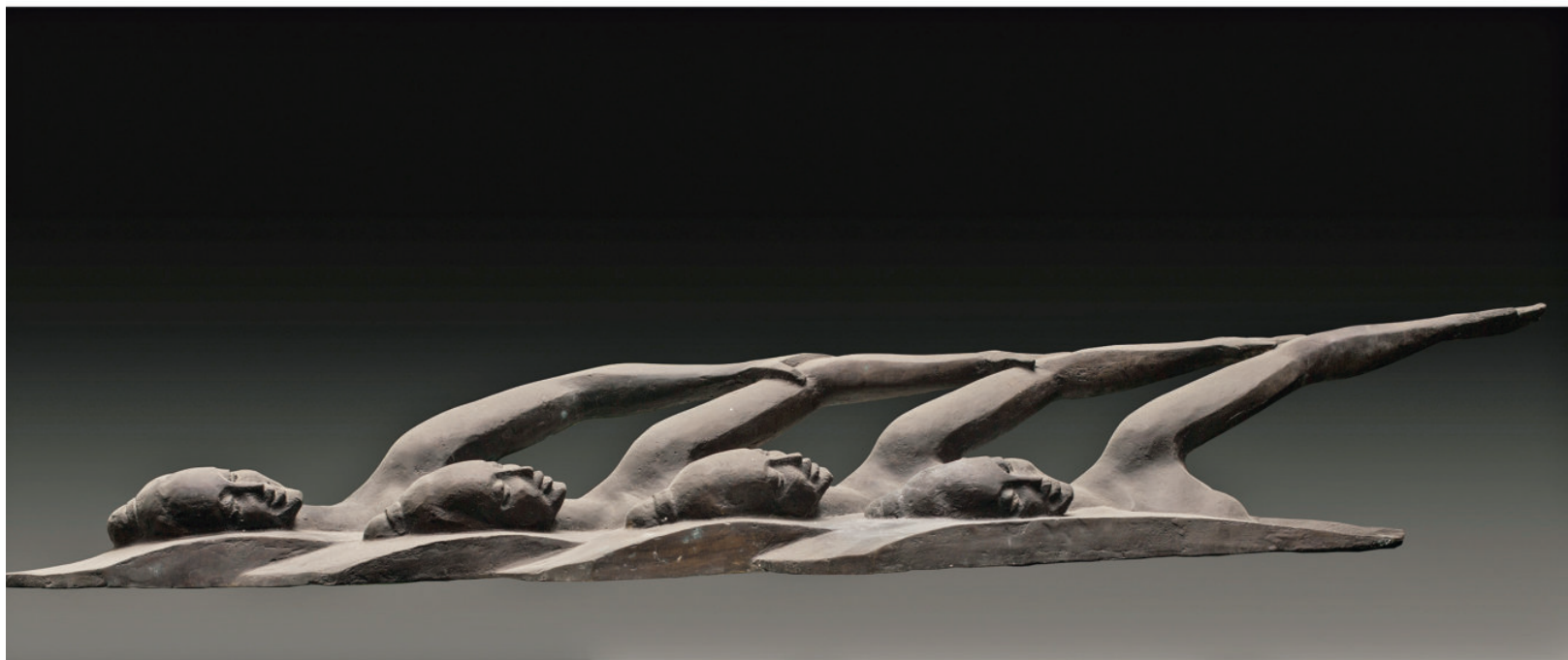
《浪花》 青铜 长 120 cm 2012 年