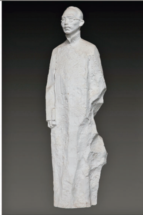
《蔡元培》 石膏 高 60 cm 2010 年