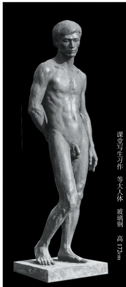
课堂写生习作 等大人像 玻璃钢 高172cm

优秀的城市公共艺术不光给人们以美感，同时裸露在公共空间，任何视角、任何视点都在向人们倾诉，传达内在纯真的思想风韵，是符合人最彻底、最核心、最真的人文精神，潜移默化地影响大众共同的行为意识，是真善美的和谐统一体。从公共艺术文化内涵、作用以及制约当前公共艺术发展成因进行分析，公共艺术对于现代城市公共空间的重要意义和赋予的使命是不言而喻的，人们为营造赏心悦目的城市公共大空间、大环境而绞尽脑汁的思想永远是坚定不移。我仍然会用毕生的精力去创造赏心悦目的城市公共空间和环境，为城市共享空间作出微薄之力。虽说这项工作又累又忙，但很是充实，它有人们难以体味的成功后的喜悦。