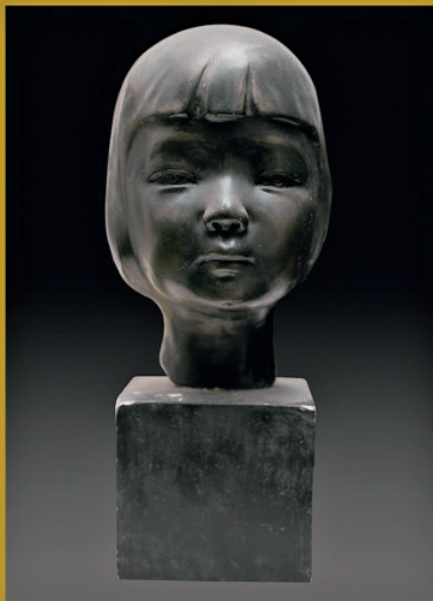
《小女孩》 石膏 高42cm 1990年

教师是崇高的职业，但是教师的职业也着实给了我巨大的压力，如果用“厚积薄发”来形容教师是最恰当不过了，因为当你面对学生时，对于专业知识的解读不光是一个知识点能解决问题，必须把所有的知识点串联起来加以解读，这就要求教师的知识面必须渊博。因此，总觉得自己浅薄，很是努力地快速“充电”，使自己迅速“渊博”起来，由此倒也促使自身的专业能力得到很大升华。自2000年至今的十多年间先后创作了《运河纤夫》《茶馆》等青铜组雕，《戒珠》《过门不入》《同舟共济》等典故石雕，《辛亥英烈陶成章》《爱乡楷模张杰》《科学家徐光宪》《学界泰斗蔡元培》等名人雕像。