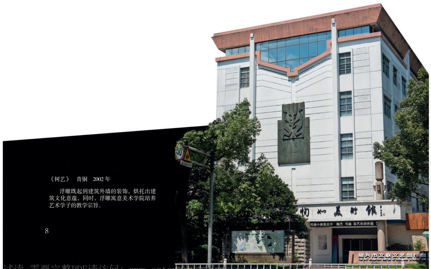
《树艺》 青铜 2002年

浮雕既起到建筑外墙的装饰，烘托出建筑文化意蕴，同时，浮雕寓意美术学院培养艺术学子的教学宗旨。