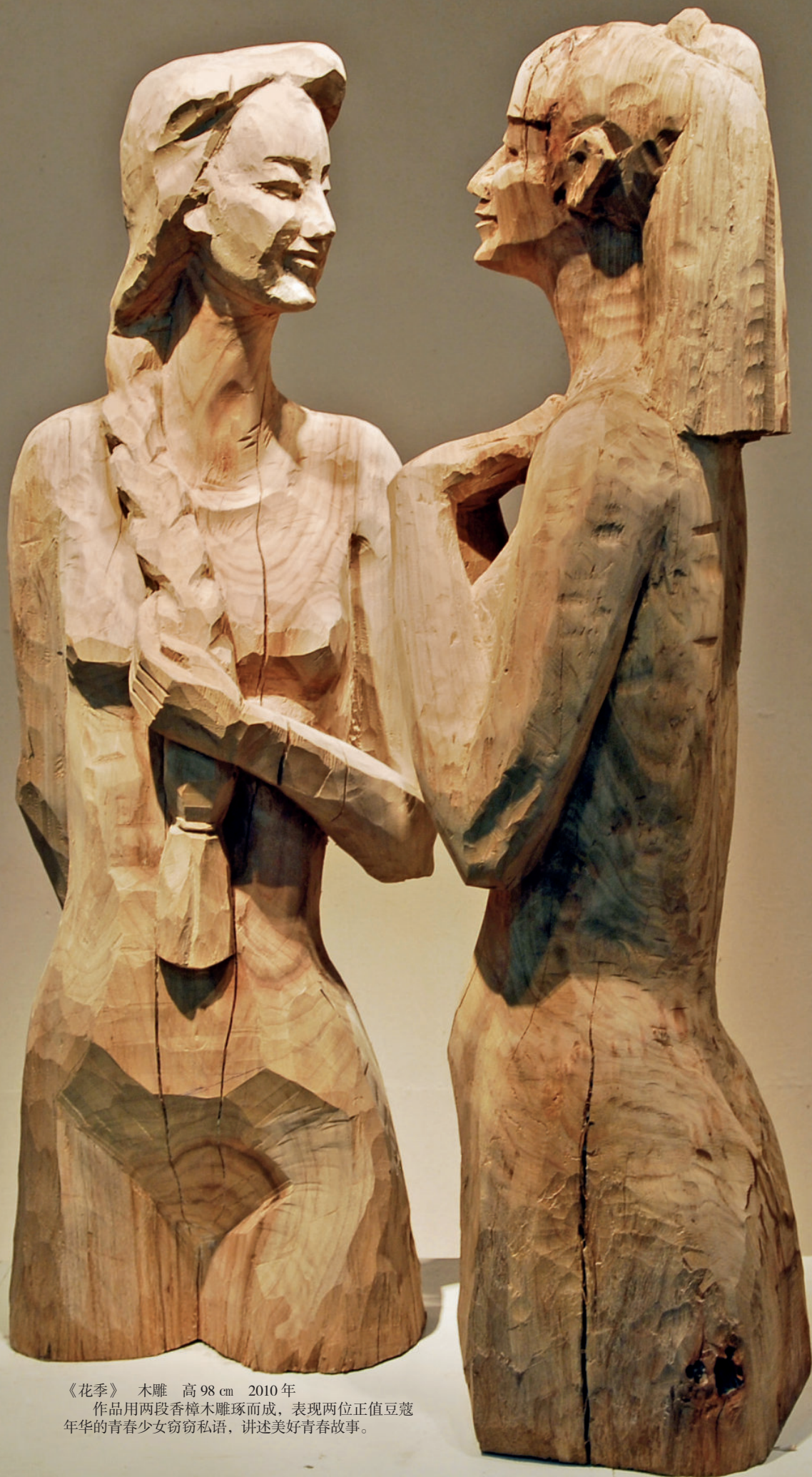
《花季》 木雕 高 98 cm 2010 年 作品用两段香樟木雕琢而成，表现两位正值豆蔻 年华的青春少女窃窃私语，讲述美好青春故事。