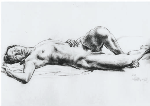
课堂写生习作 素描女人体

其次是体现在公共艺术与城市文明。公共艺术的出现与发展是人类物质文明与精神文明向前发展的必然结果。在现代社会不断进步的今天，人类在创造自己文明的同时，对于艺术美的追求也不断在进步，发达的现代大都市中，在拥挤的人群中我们不难发现在我们中间更有预示着各种精神象征的纪念雕塑，它们是有灵魂且静止的，它们是精神的象征，是人类文明的缩影，它们抒发着人们对未来的憧憬，对过去的怀念，精神的寄托。不论是表达纪念、主题、装饰还是陈列，它们已经是这个城市的组成，是人们生活中必不可少的美的元素。尽管公共艺术只是环境艺术景观中的一个组成部分，但它的作用却已经不能用公共艺术一词来概括，在人类精神世界里，一种在现实中物化的象征，寄托的是怀念，是力量，是人类不屈不挠的创造精神。