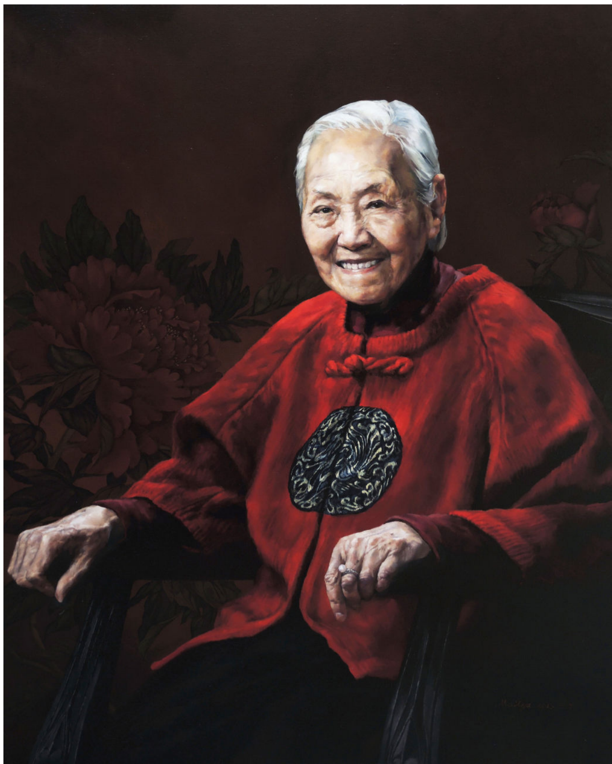
永远的曾杏绯 100cm×80cm 布面油画