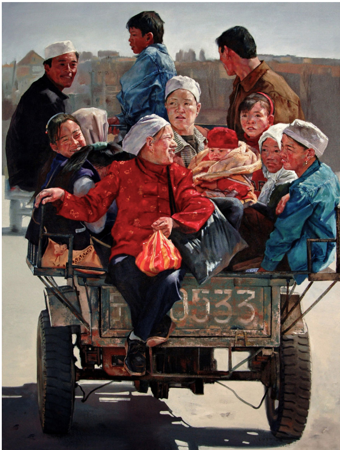
幸福牌 160cm×130cm 布面油画