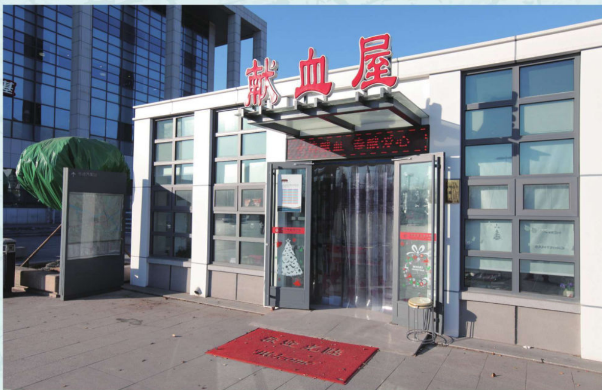
西站献血屋2015年9月建成投入使用