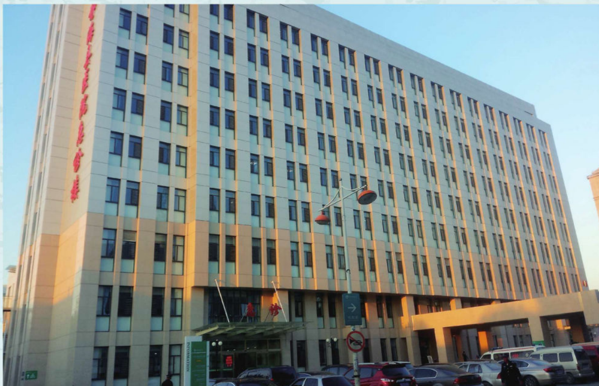
静海医院改扩建二期工程2015年4月竣工