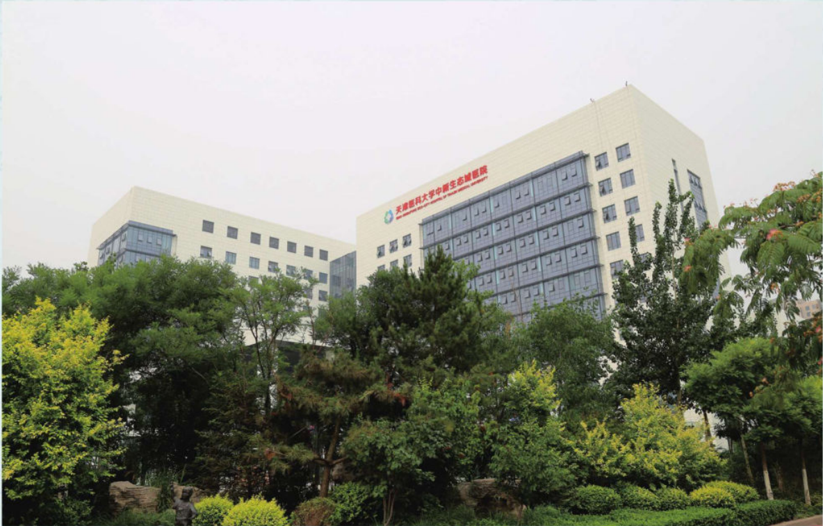
天津医科大学中新生态城医院2015年11月竣工