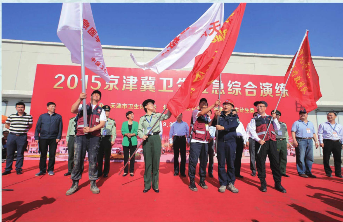
7月11日，2015京津冀卫生应急综合演练在津进行