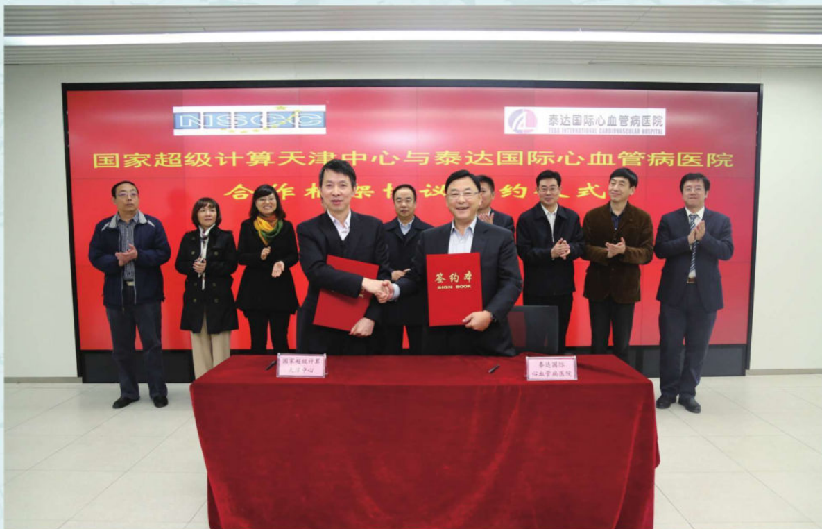
11月4日，国家超级计算天津中心与泰达国际心血管病医院签署合作协议