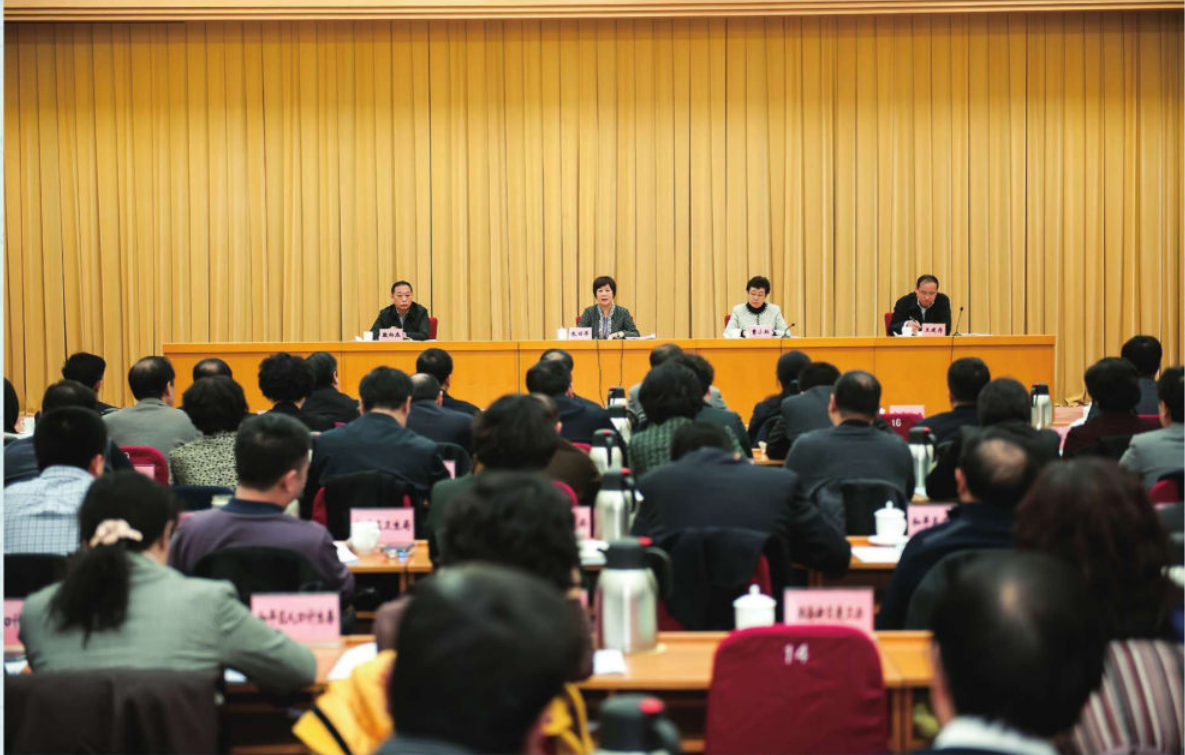
2015年2月9日，天津市卫生和计划生育工作会议召开