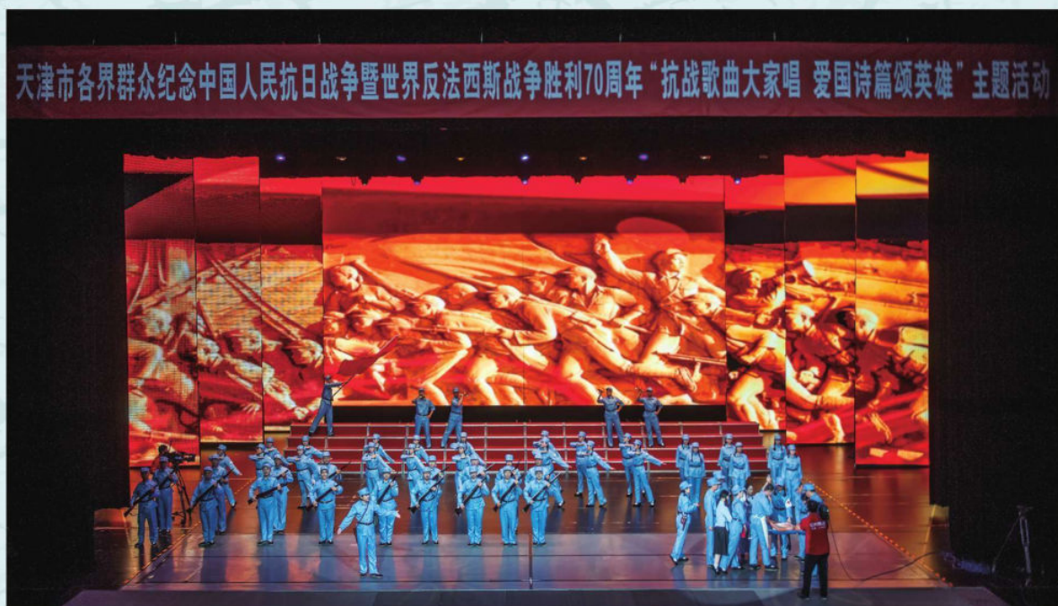
天津市眼科医院参加全市纪念中国人民抗日战争暨世界反法西斯战争胜利70周年活动