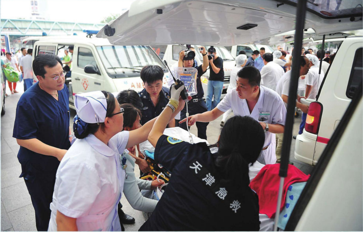
8. 12天津港特大爆炸事故医疗抢救现场