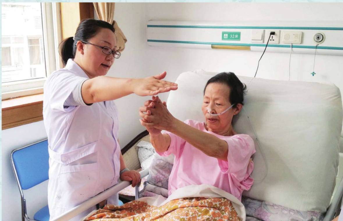
医疗联合体三甲医院医生在基层医院查房、指导