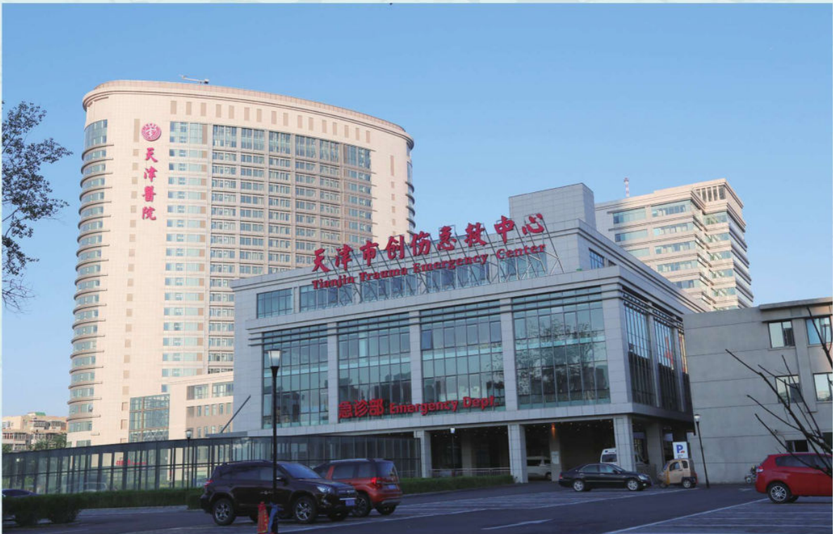
天津医院改扩建工程2015年9月竣工