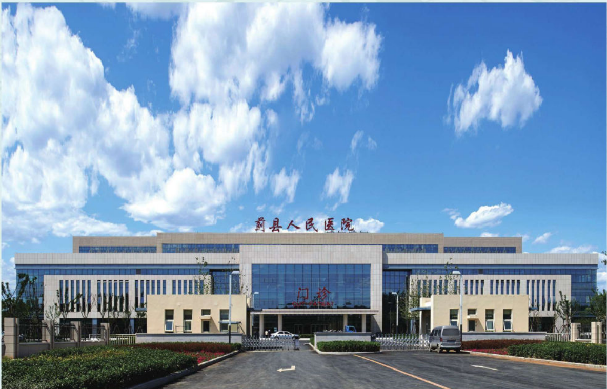
蓟县人民医院迁址新建工程2015年5月竣工