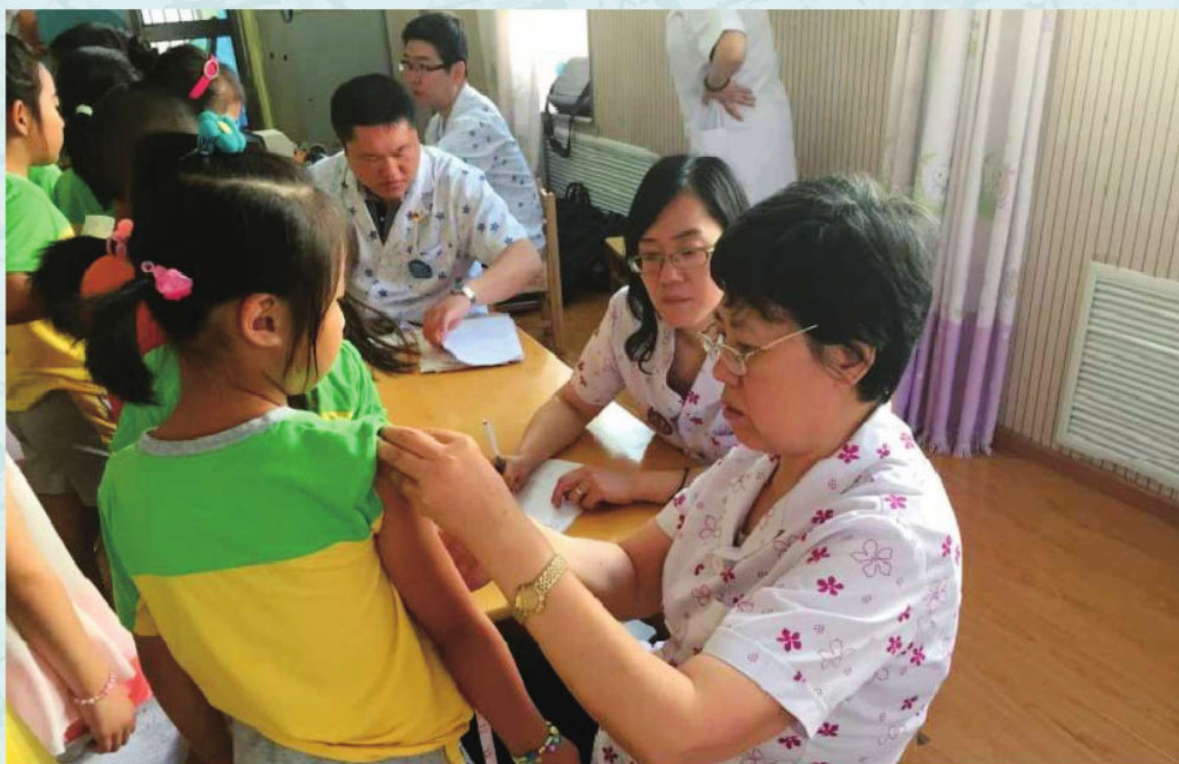
市妇儿中心组织儿童生长发育健康状况调查