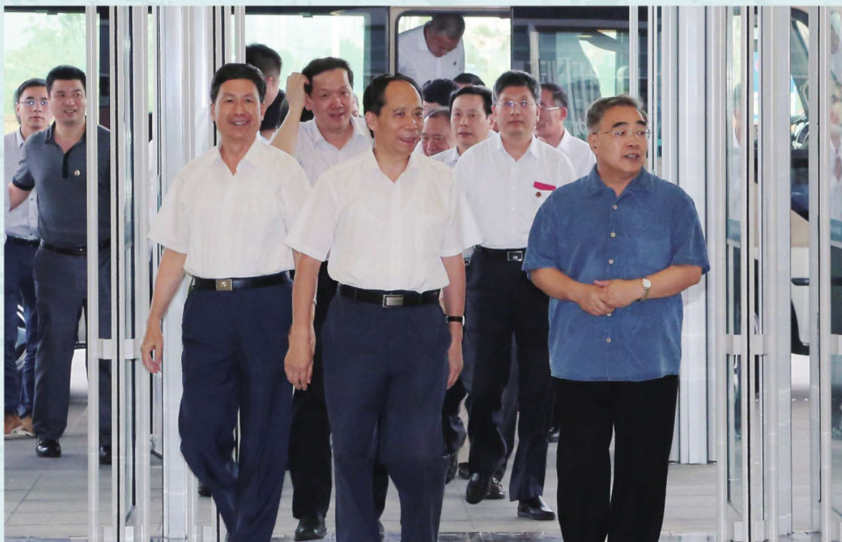
2015年7月11日，全国人大常委会副委员长吉炳轩来津调研