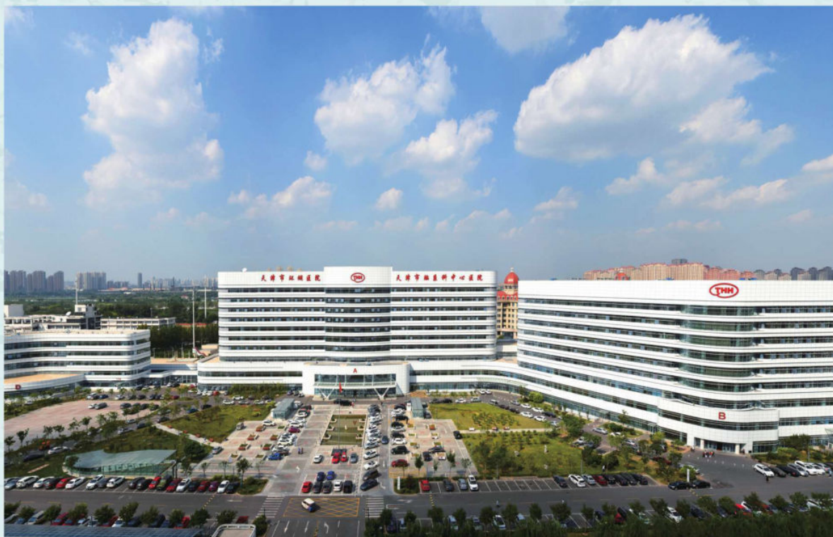
环湖医院迁址新建工程2015年底竣工