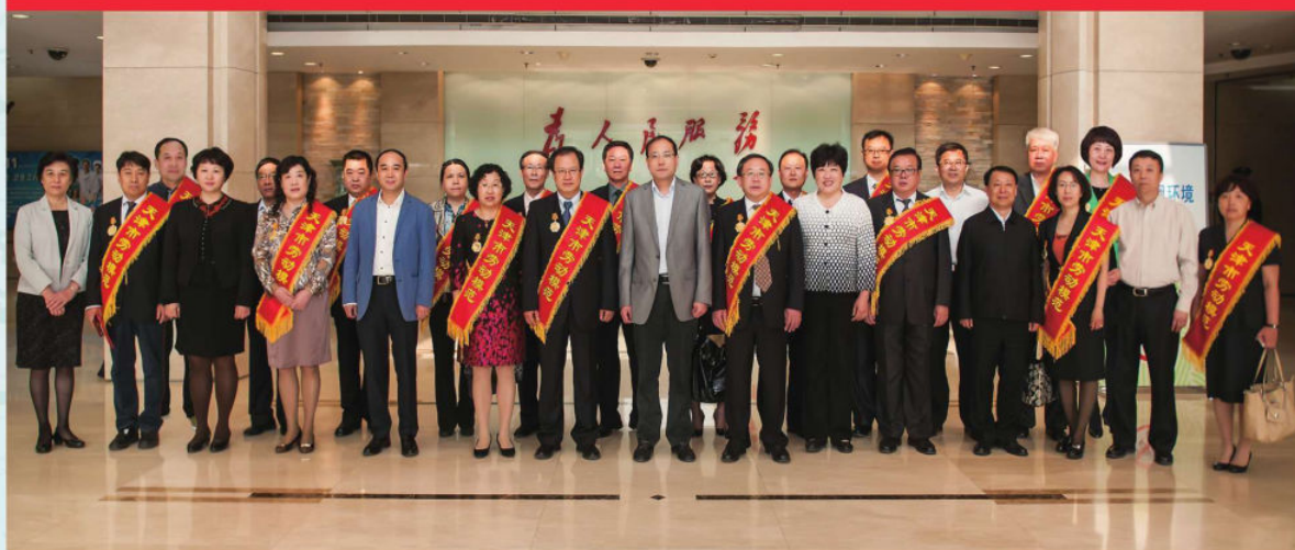
市卫生计生委直属单位劳动模范参加市表彰会