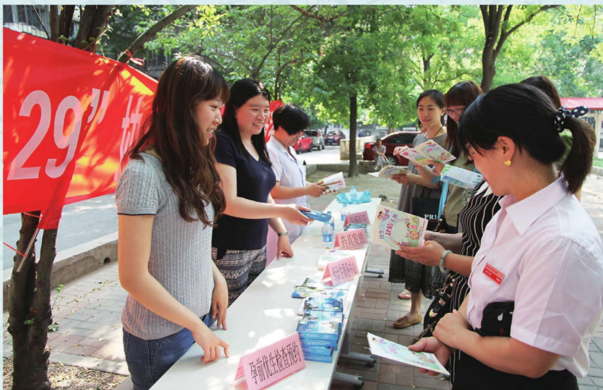
5.29计划生育宣传现场