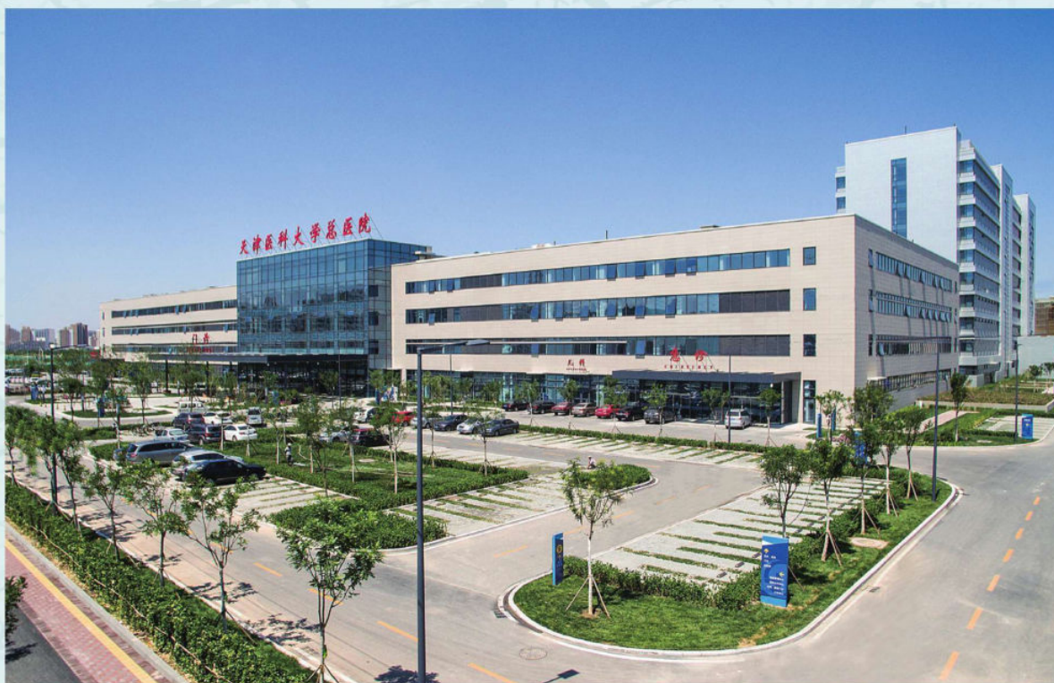
天津医科大学空港医院2015年7月竣工