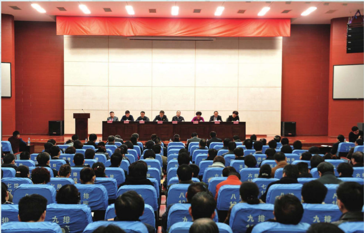
2015年3月13日，天津市卫生计生系统党风廉政建设和行业作风建设工作会议召开