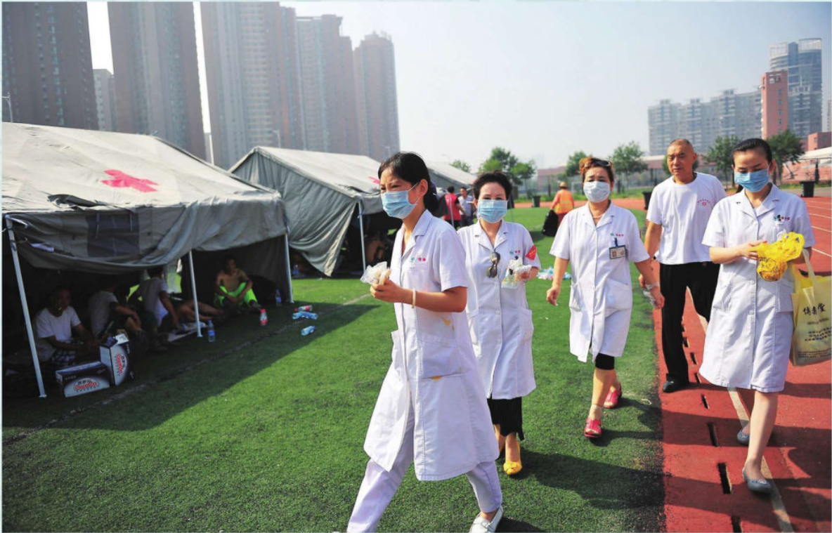
8. 12天津港特大爆炸事故医疗抢救现场