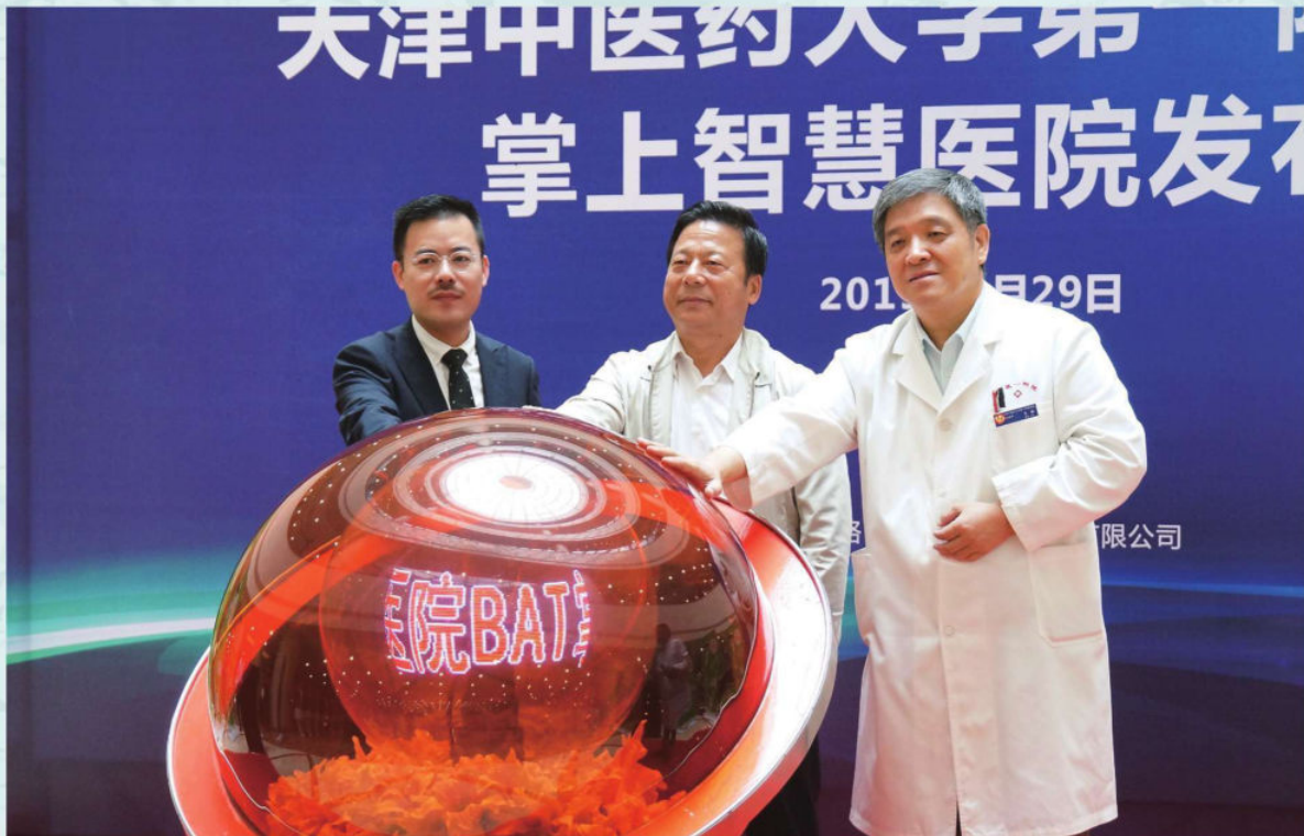
9月29日，BAT全流程“掌上智慧医院”启动