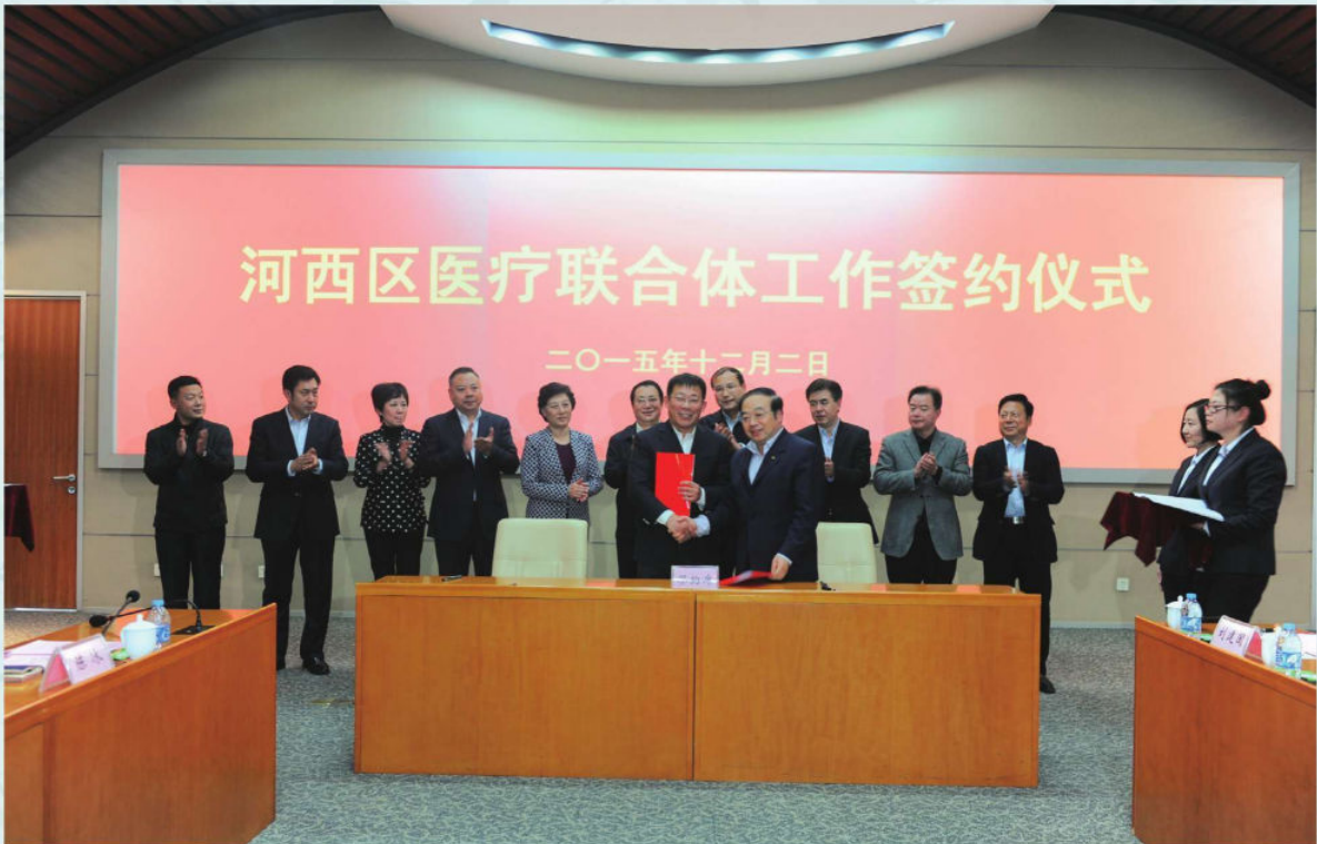
河西区卫计委与多所市属三甲医院医疗联合体工作签约