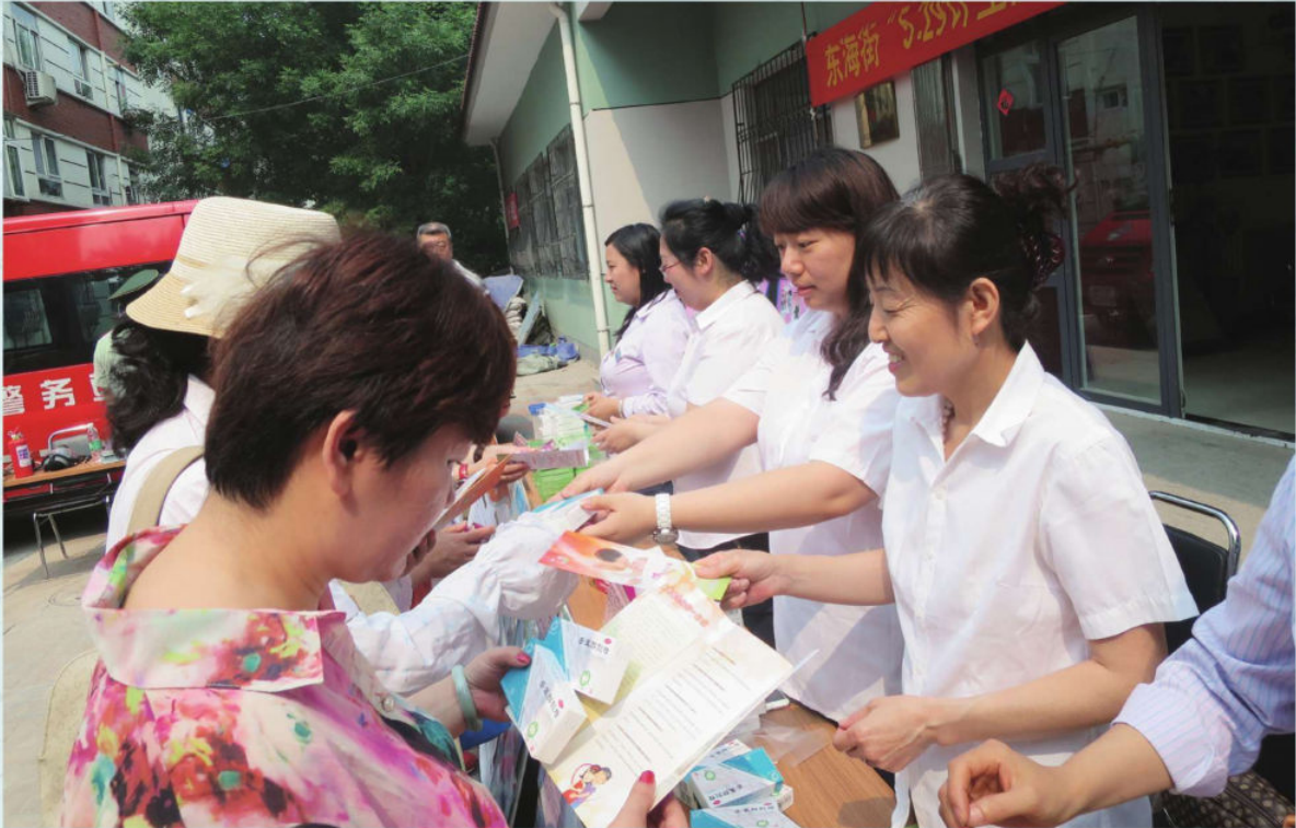
5.29计划生育宣传现场