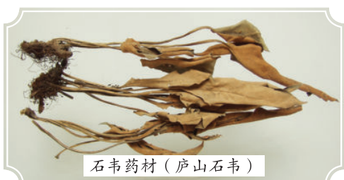
石韦药材(庐山石韦)