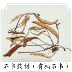
石韦药材(有柄石韦)