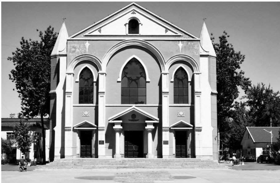
◇ 正定天主教堂（华北大学旧址）

阳春时节，草长莺飞，千年古郡，生机勃勃。2017年4月1日，古城正定迎来了一批特殊的客人——中国人民大学党委书记靳诺一行40余人到正定考察。在天主教堂华北大学旧址，石家庄科技工程职业学院的师生们演唱了当年的华大校歌：“华北雄壮美丽的山河，是我们民族发祥的地方……”嘹亮的歌声仿佛将人们又带回到那段激情燃烧的开国岁月。