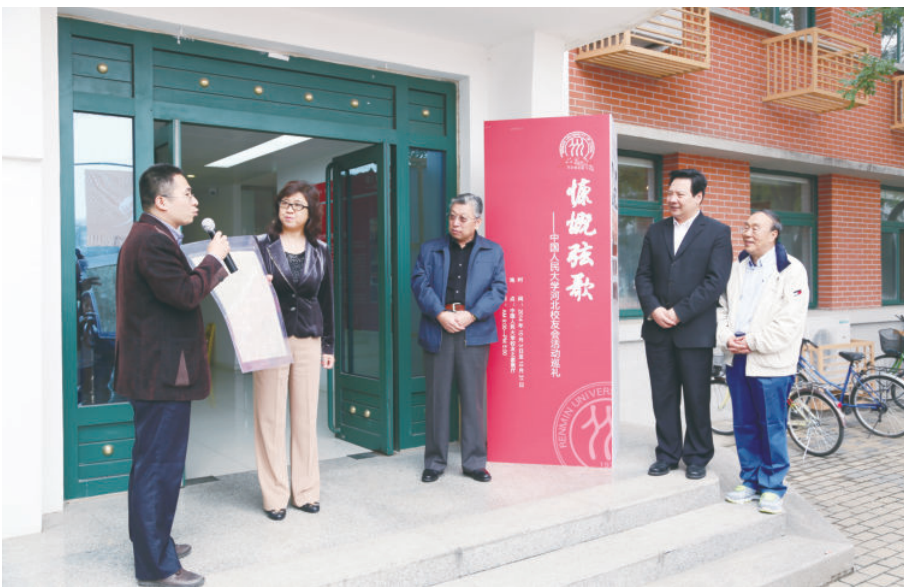
◇ 2014年10月，笔者应邀参加中国人民大学举办的华北大学文献展，并捐献刊登华北大学成立消息的原版《人民日报》