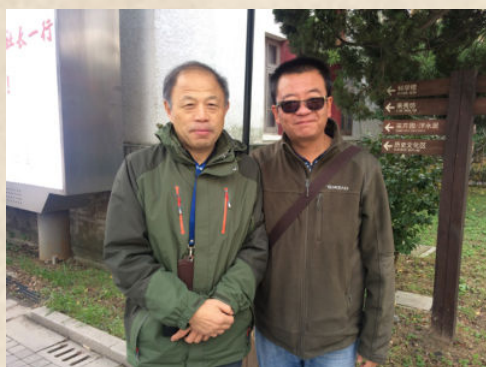
同黄厚江老师一起