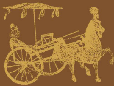
北方草原古代壁画珍品