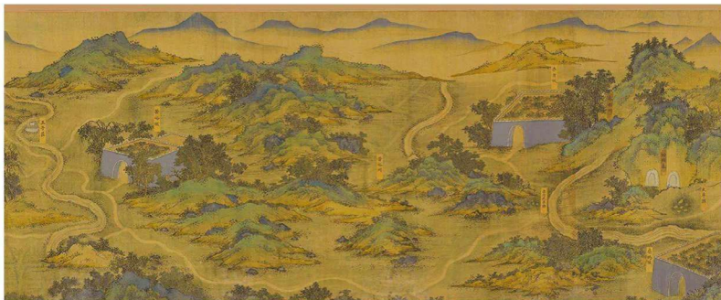
* 佚名《丝路山水地图》（局部）

新疆面积广大，其地形是典型的三山夹两盆，由南往北依次为昆仑山、阿尔金山、塔里木盆地、天山、准噶（gá）尔盆地和阿尔泰山。位于中部的天山是新疆最壮观的山脉，绵延 1700 多千米。天山北侧有丝绸之路北线，天山南侧有丝绸之路中线。丝绸之路南线则位于昆仑山—阿尔金山北侧。