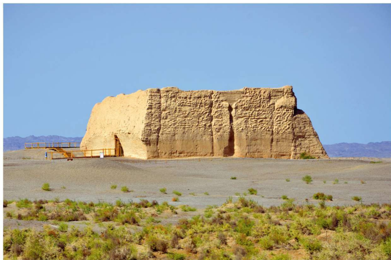
* 敦煌市玉门关遗址