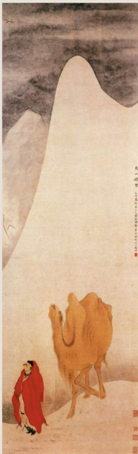
* (清) 华嵒

由于处在东西方文明交汇的区域，这里出现了很多别具特色的绿洲城市，产生了独特的文化，本册主要向读者展示河西走廊以及新疆的壮美景观和多彩文化。