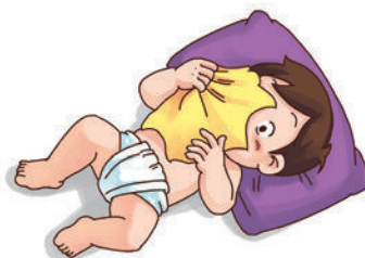
自己会拉开遮盖在脸颊上的手帕