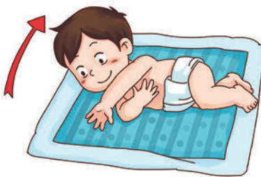
会自己翻身（由俯卧变成仰卧）