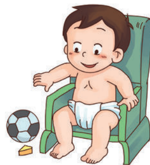
可以自己坐在有靠背的椅子上