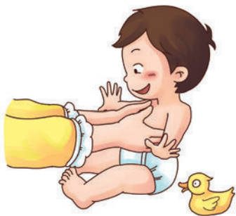
抱直时，脖子竖直头保持在中央