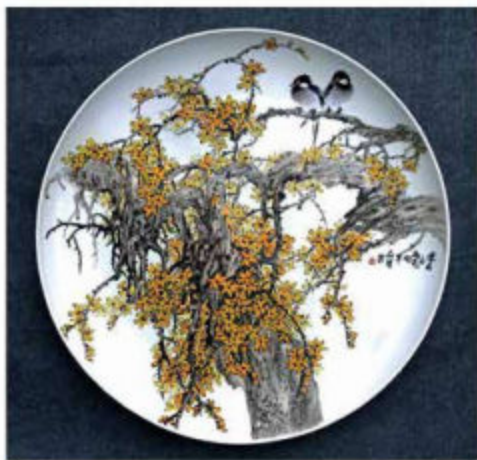
《春雨多雨花开早》20吋盘盘