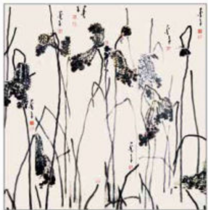
《残砖》 六条屏 138cmX23cmX6