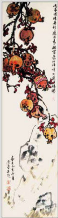
《山乡佳果》 四条屏 138cmX34cmX4