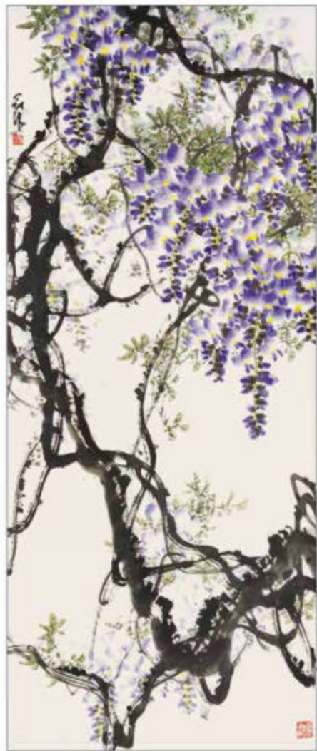
《花团锦簇任君游赏》180cmX70cm