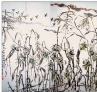
《只有秋声最好听》 四条屏 138cmX34cmX4

回国后任唐山陶瓷职工大学教师，曾先后担任唐山工业职业技术学院艺术系主任、艺术顾问，曾被唐山市老年大学聘任教授国画课程，如今仍然潜心于中国画、书法的研习与创作。