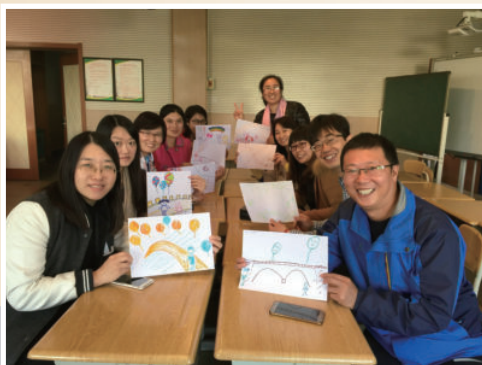
缘聚，你也在这里 2016年11月，青岛燕儿岛路第一小学承办青岛市中小学心理教师经验交流活动。