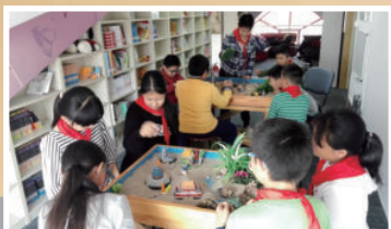
2016年9月，青岛市实验小学的学生在进行沙盘体验活动。