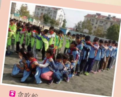
贪吃蛇 2016年11月10日,青岛宁夏路第二小学开展以团结协作,健康成长为主题的室外心理拓展活动。