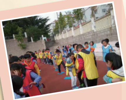
同舟共济 2016年10月13日,青岛宁夏路第二小学开展以凝心汇聚力量主题的特色心理与健康活动。