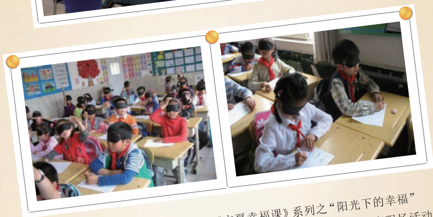
《宁夏幸福课》系列之“阳光下的幸福” 青岛宁夏路小学开展心理健康教育现场活动。