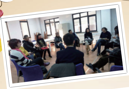
青岛宁夏路成立的存在主义-封闭式-家长效能成长团体活动现场。