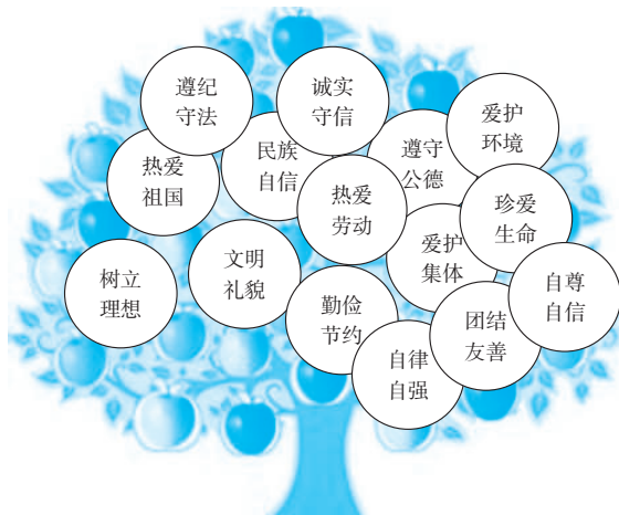
思想品德发展水平指标树形结构图

第三，凡是不违背原则，不伤害自尊的事情，都可以礼让。不应为一点小事和别人去争吵，为鸡毛蒜皮的事出手伤人。