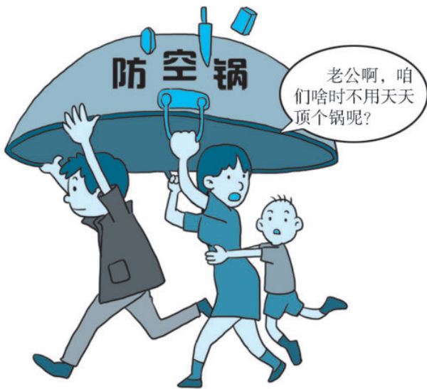
图 1-2 城市“防空锅”