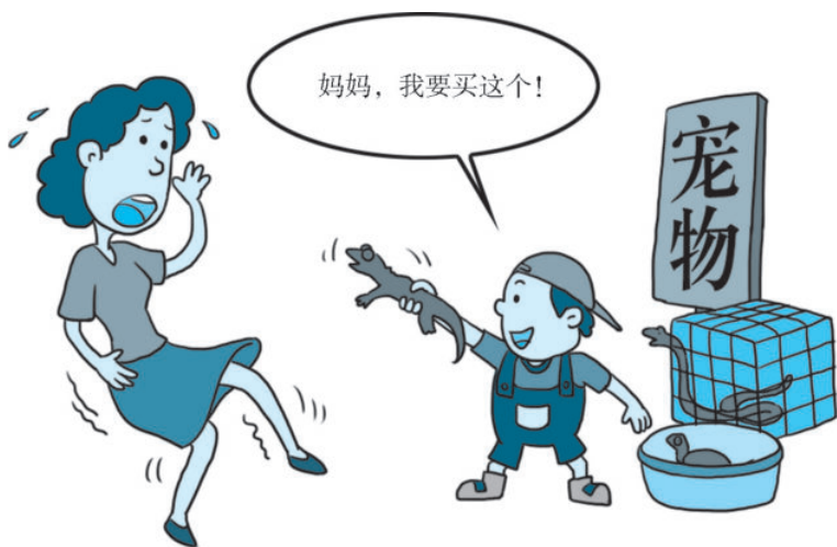
图 2-1 养宠物也要守法

据宁波晚报 2015 年 5 月 24 日报道, 5 月 15 日, 余姚市森林公安局接到群众举报, 称马渚镇小马路一家纹身店里有人饲养蟒蛇。民警当即对这家纹身店依法进行搜查, 很快在一个木箱子中发现了两条蜷伏的小蟒蛇, 每条蟒蛇长四五十厘米, 有着黄黑相间的花纹。