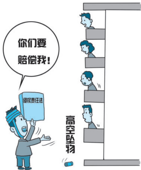
图 1-1 高空坠物伤人须赔偿

渝中区法院认为，除了搬离的两名住户外，学田湾正街65号、67号临街的24家住户均不能排除有扔烟灰缸的可能性。因此根据过错推定原则，由当时有人居住的这24家住户分担责任。法院认定郝跃的损失共计17.8万余元，由各户各赔偿8101.5元；其中，此案受理费及其他费用共计6688元，由各被告各承担304元。2001年12月19日，渝中区法院作出这一判决后，被告不服上诉。2002年6月3日，重庆市第一中级人民法院维持原判。