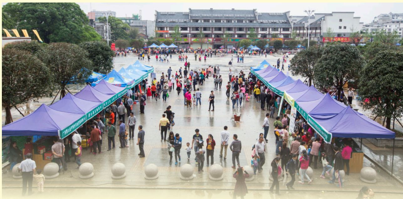
2016年4月9日，蒙山县“三月三”期间举办农产品展销会