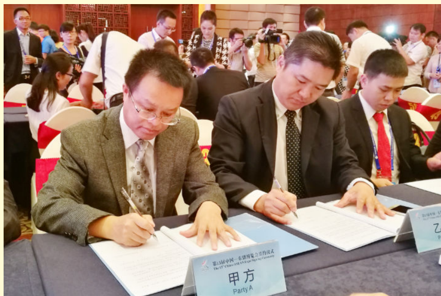
2016年9月11日，在第十三届中国—东盟博览会上，县人民政府与湖南省客商签订投资协议