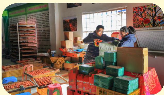
2016年12月16日，新圩镇古定村一个家庭农产品加工作坊员工包装柿饼，准备发给网上订购的客户。电商进农家让蒙山不少农户得到实实在在的利益