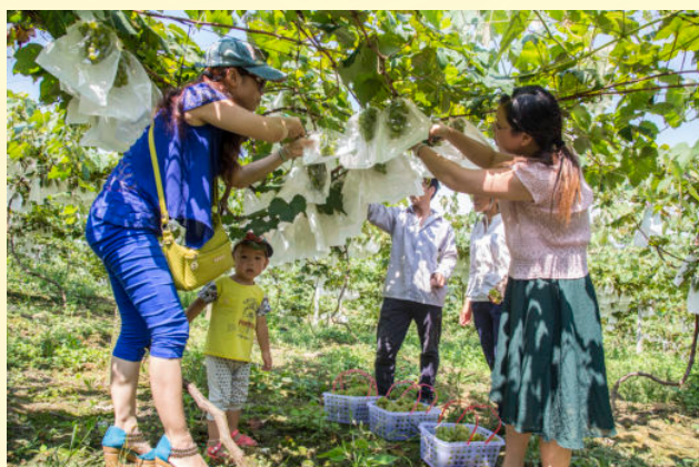
2016年7月9日，游客到新圩镇新圩村奶香葡萄园摘葡萄