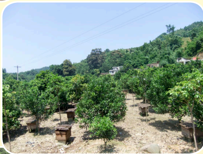
林下生态蜜蜂养殖（2016年摄）