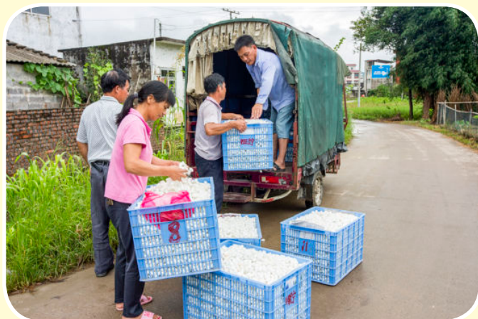
蚕农装运鲜茧运往收购站出售。种桑养蚕成为蒙山农村主要收入来源之一（2016年摄）