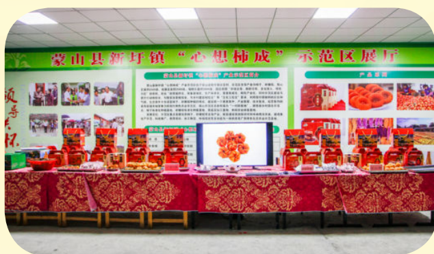
蒙山县电子商务产业园展厅展出的农产品（2016年摄）