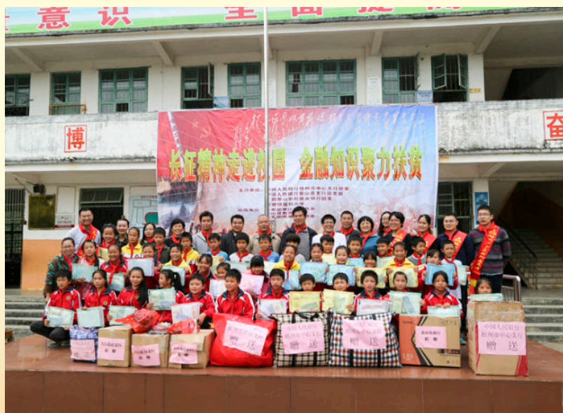
2016年11月11日，蒙山县金融部门联合开展扶贫送温暖活动，为陈塘镇福利小学留守儿童送上助学物品和御寒冬衣