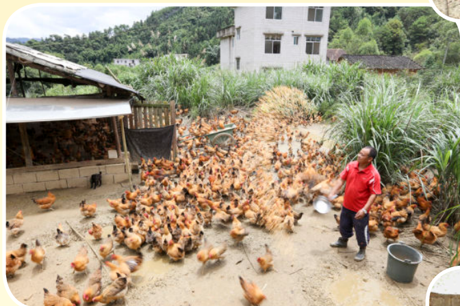
山地饲养肉鸡（2016年摄）