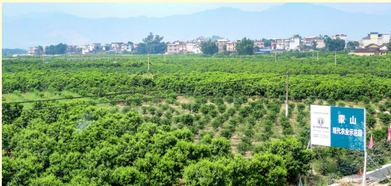
蒙山县东乡橘园现代农业（核心）示范区（2016年摄）