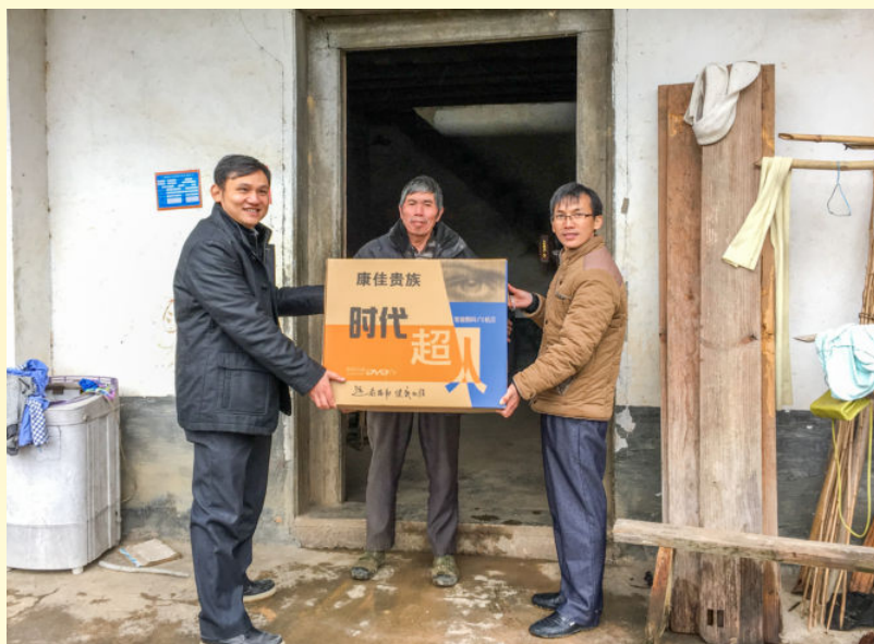
2016年11月25日，西河镇政府帮扶责任人向乐拥村贫困户赠送电视机