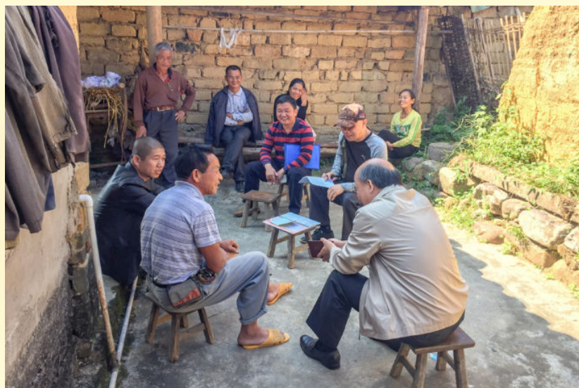
2016年12月15日，扶贫责任人入户宣传扶贫政策 县扶贫办供稿