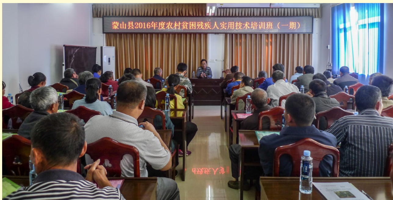
2016年11月3日，县残联举办农村贫困残疾人实用技术培训班