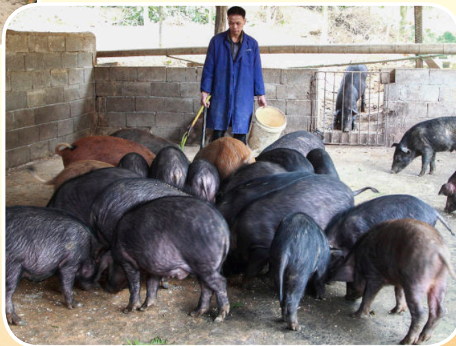
长坪瑶族乡六坪村村民饲养杂交野猪获得成功（2016年摄）