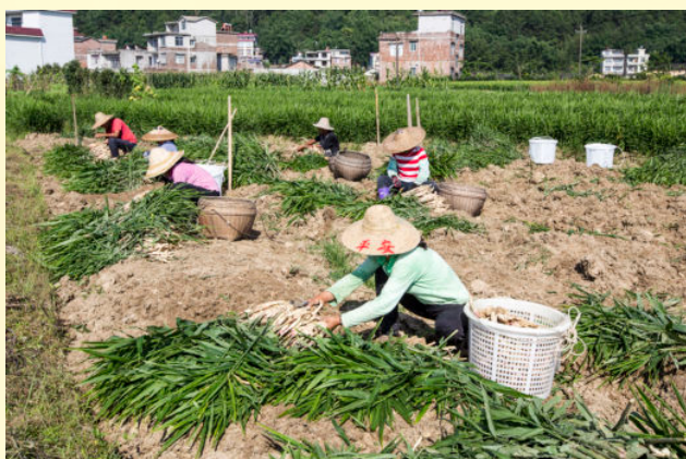
2016年6月25日，文圩镇大明村群众在采收五月姜