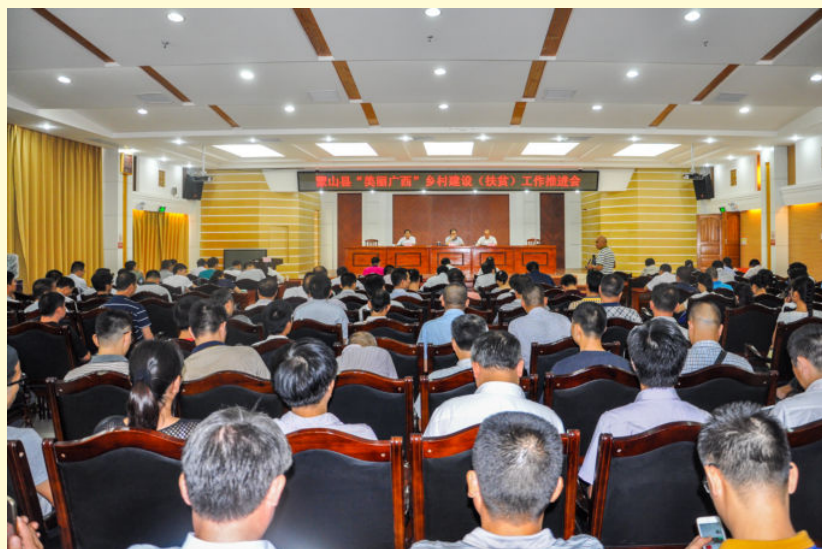
2016年9月7日，蒙山县召开“美丽广西”振兴乡村（扶贫）工作推进会，强力推进全县“脱贫摘帽”工作