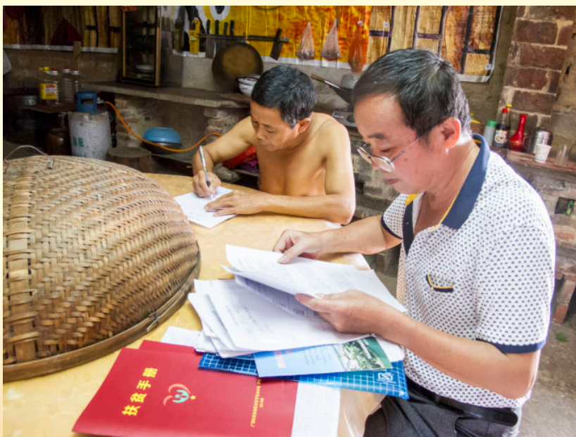
2016年7月12日，扶贫责任人入户完善扶贫手册