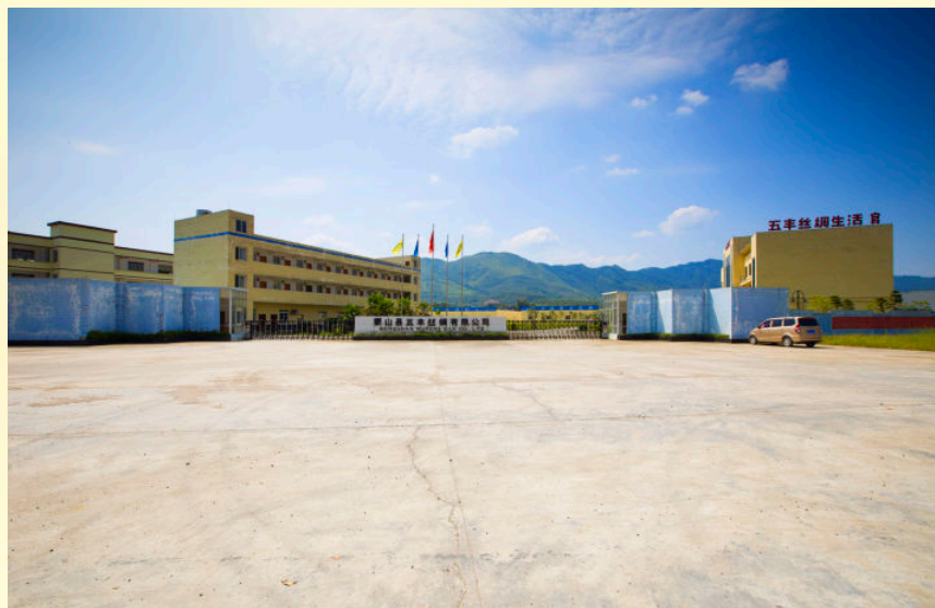
县丝绸产业园区入园企业——五丰丝绸有限公司（2016年摄）