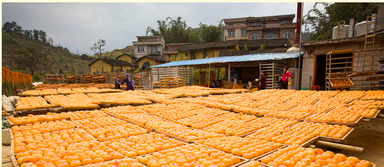
2016年1月3日，新圩镇祥日果品公司工人在晾晒柿饼