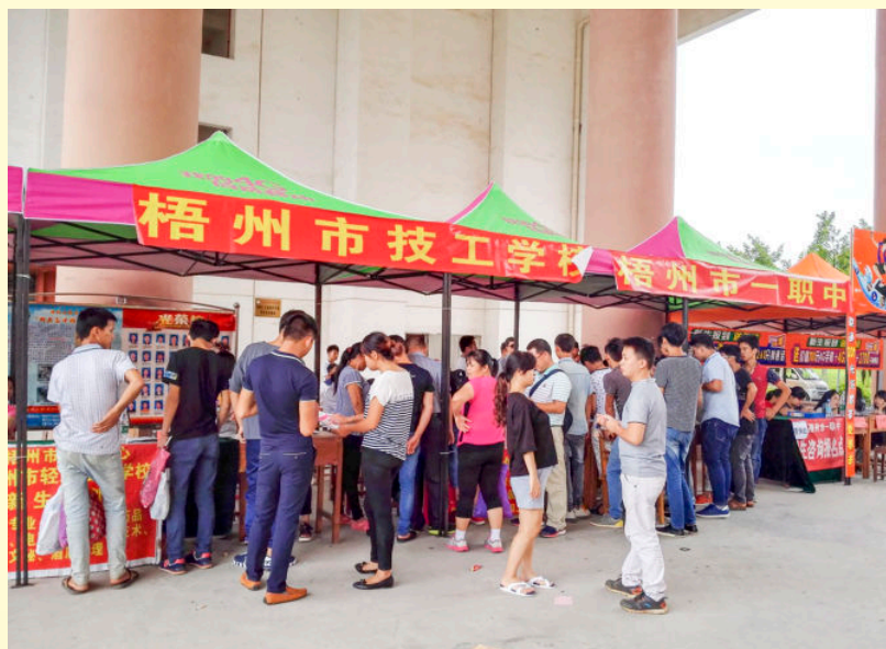
县人社局积极引导农村贫困户“两后生”报读市职业院校，解决读书费用上的困难（2016年摄） 县扶贫办供稿