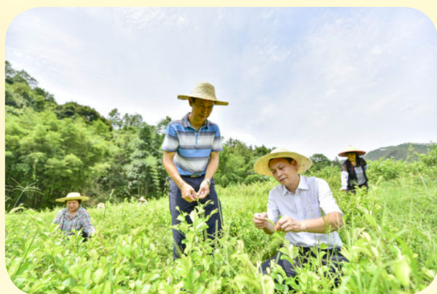
陈塘镇朝垌村贫困户在驻村第一书记的指导下种植中药材牛大力脱贫致富（2016年摄） 县扶贫办供稿