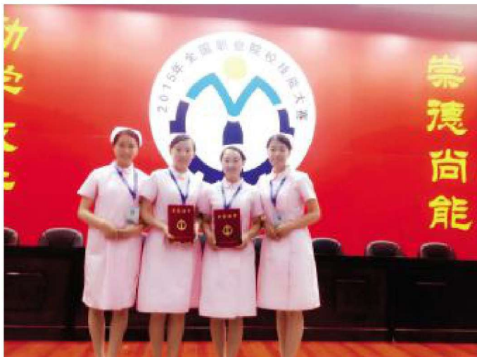
2015年11月,学校学生荣获首届全国护理专业本科临床技能大赛团体三等奖