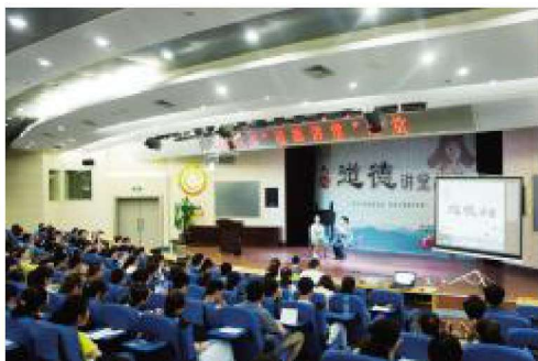
2014年6月,学校开展道德讲堂巡讲