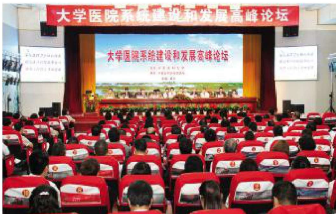
2012年8月,学校举办“大学医院系统建设和发展高峰论坛”