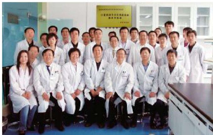
2010年9月，“宁夏 颅脑疾病重点实验室”获批 为省部共建科技部重点实验 室培育基地