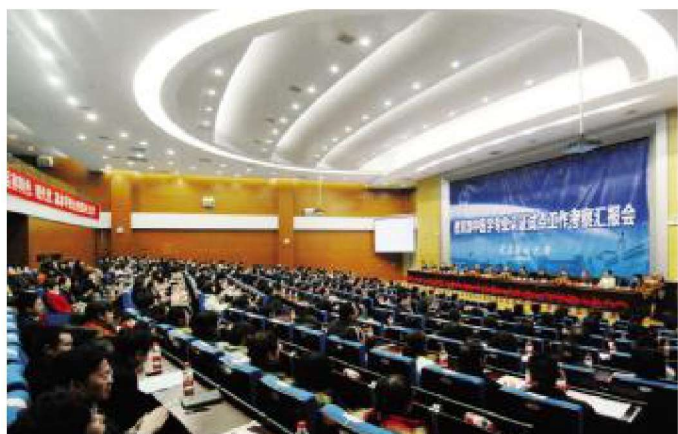
2010年12月，中医学 专业通过教育部专业认证