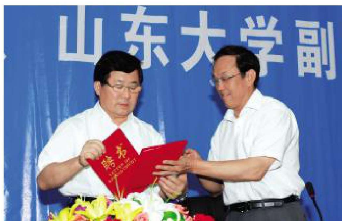
2010年12月，学校双 聘引进中国工程院张运院士