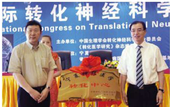
2012年7月,宁夏神经医学转化中心成立