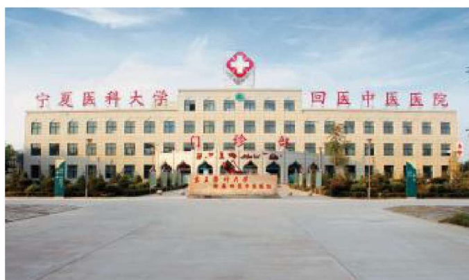
2012年9月，宁夏医科 大学附属回医中医医院建成