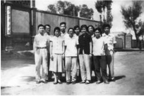
20 世纪 60 年代初期，学校借银川卫戍区司令部（现自治区人民政府对面）办学时部分教师合影