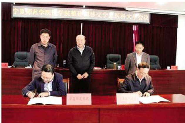
2014年10月,宁夏师范学院医学院正式移交宁夏医科大学