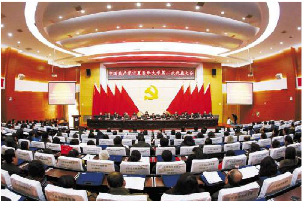
2014年1月13日，宁夏医科大学第二次党代会召开