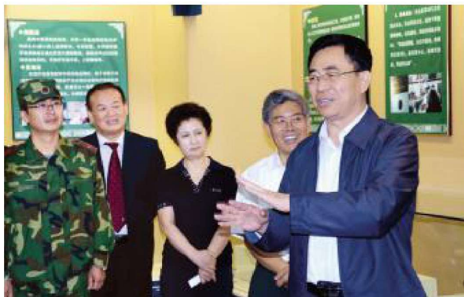
2012年9月，自治区 党委书记张毅来校调研