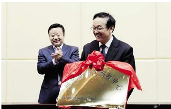
2012年9月，宁夏回 医药协同创新中心成立