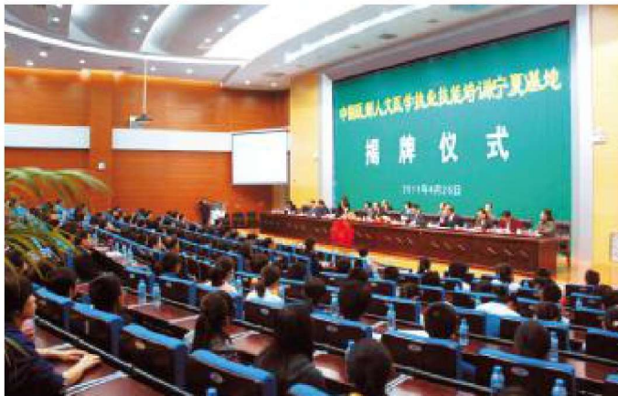
2011年4月,中国医师人文医学执业技能培训(宁夏)基地落户学校