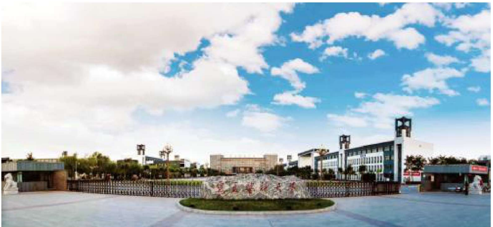
2017 年 7 月，学校雁湖校区建成投入使用