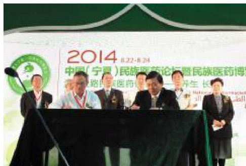
2014年8月,学校与中国民族医药协会签署《创建宁夏医科大学回医药教育发展与科学研究院框架协议》