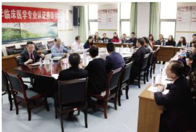
2014年11月，临床医学专业通过教育部专业认证