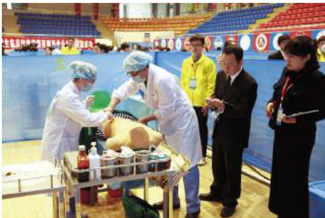
2015年4月，学校承办第六届全国高等院校大学生临床技能竞赛西南西北分区赛