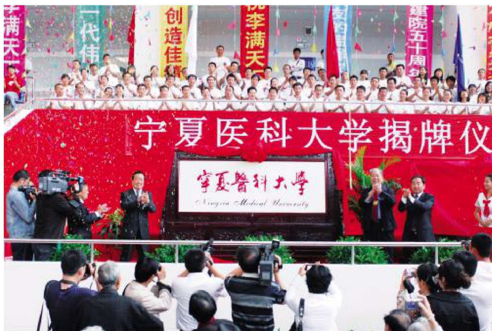
2008年9月6日,学校更名宁夏医科大学暨建校50周年庆典