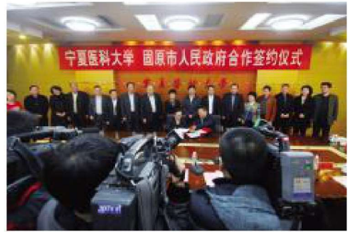
2013年12月，学校与固原市人民政府签署合作协议