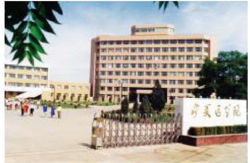
20 世纪 90 年代学校大门