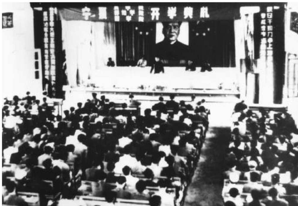
1958年9月15日，宁夏医学院、宁夏师范学院和宁夏农学院共同举行开学典礼