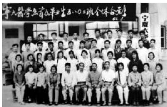
学校首届毕业生——五八〇二班合影