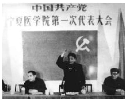
1981年2月，中国共产党宁夏医学院第一次代表大会召开