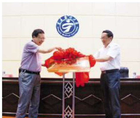
2015年7月，教师教学发展中心成立