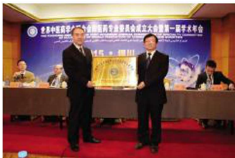
2015年9月,世界中医药学会联合会回医药专业委员会成立